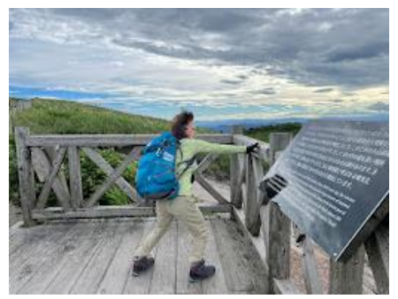
15 キャー、飛ばされる！