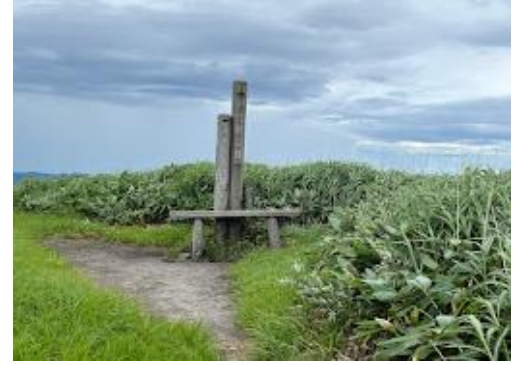
21 登り返して、子三瓶山に到着。