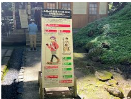
1 投入堂への入り口で靴の裏をチェックされ、入山時間を記入します(下山時も記入。)

投入堂までの道は鎖場がある急坂で、これも立派な登山でした。その後、三瓶山北の原キャンプ場まで移動して、バーベキュー、テント泊。翌日は三瓶山を周回するコースを縦走しました。多くの花が咲いており、展望も良く、急遽企画した山行ではありましたが、充実の山行となりました。