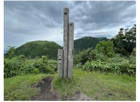
24 孫三瓶山山頂。左奥に子三瓶山、右奥に男三瓶山。