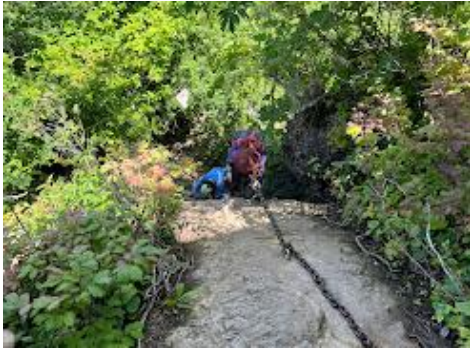
10 鎖場を降りて、三佛寺を後にします。