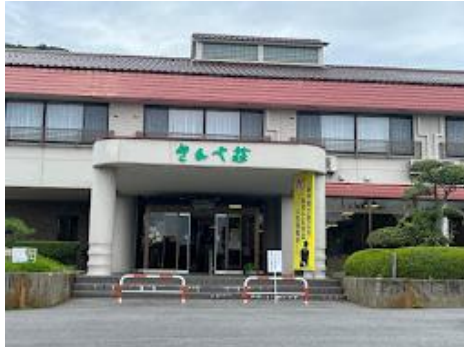
29 国民宿舎さんべ荘で温泉に入り帰路につきました。