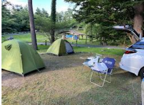
11 三瓶山北の原キャンプ場へ移動して、バーベキュー、テント泊。