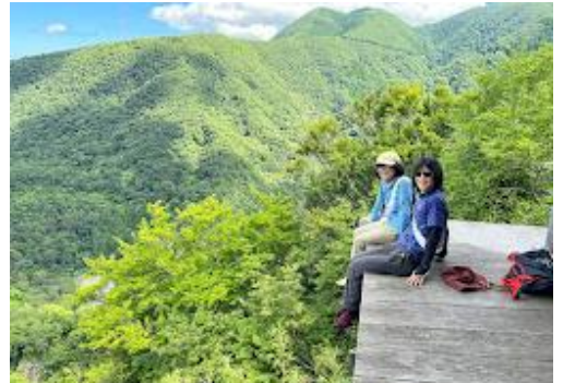
6 この下は絶壁です。