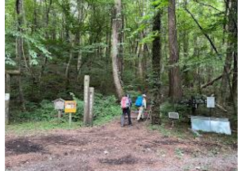
12 翌日は姫逃池登山口から登山開始。