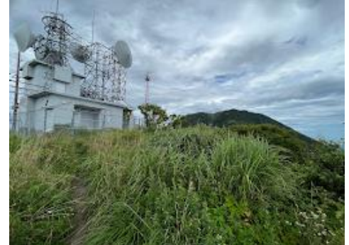
27 最後の山頂の女三瓶山。多くのテレビ局の中継所があります。