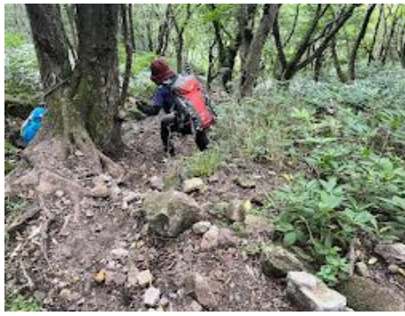
20 結構な急坂を慎重に降ります。