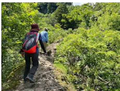
4 蟻の戸渡りの様な道。