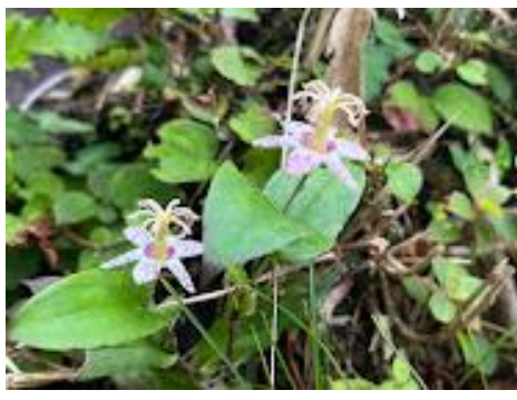
23 ヤマジノホトトギス