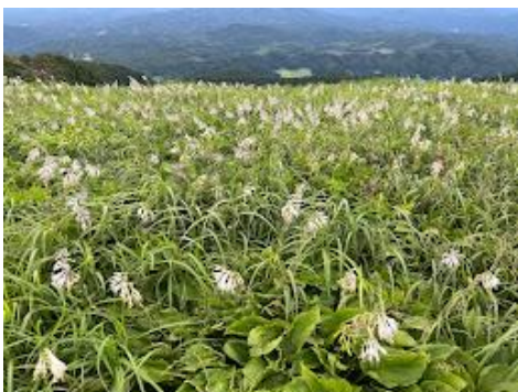
16 オオバギボウシの群生。