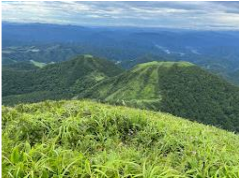
19 これから登る子三瓶山と孫三瓶山。