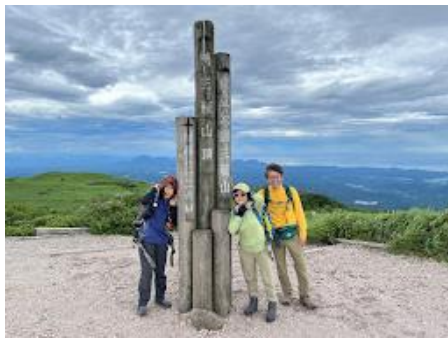
14 男三瓶山山頂に到着。台風の影響が強風。