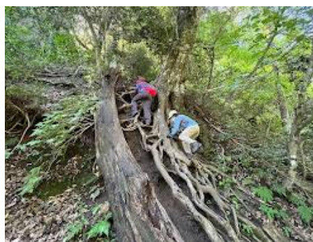
2 こんな急坂を登ります。