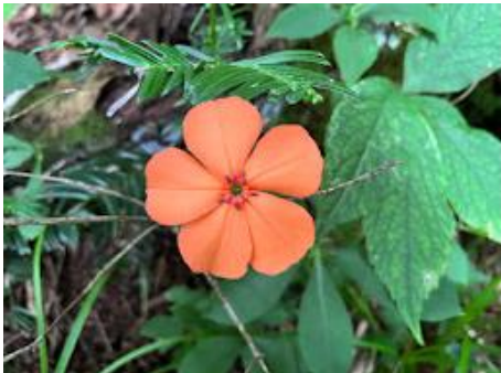
13 多くの花が咲いていました。これはフジグロセンノウ。