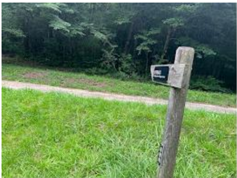
28 姫逃池登山口に戻ってきて登山終了。