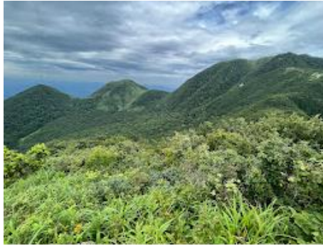
26 左から、孫三瓶山、子三瓶山、男三瓶山。