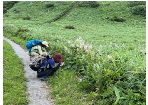
18 写真撮影に忙しく、全然前に進みません。