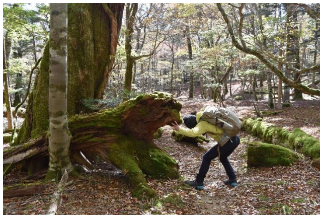
襲われた、それとも闘っている？ 結果は……