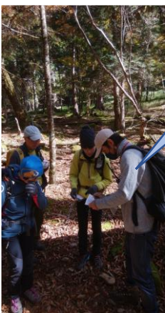
途中監視員による チェックを受ける