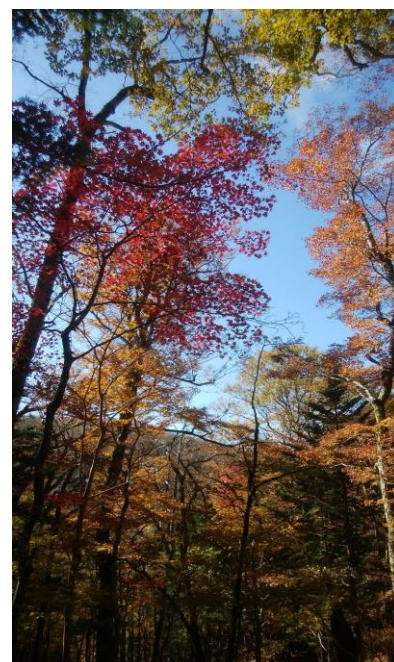
見上げた空に生える紅葉