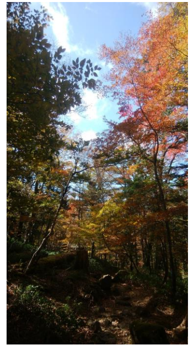
静寂な雰囲気にもまれた中を歩きました