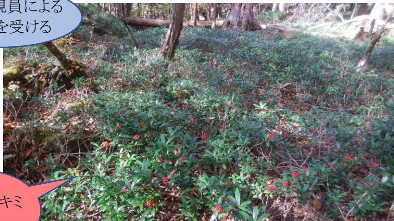
ミヤマシキミ の群生