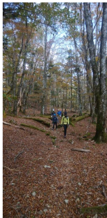
順調に進んでいます