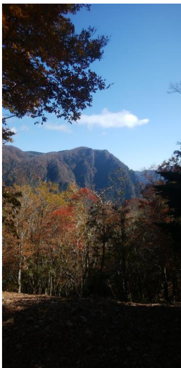
展望所より大蛇岩を見る