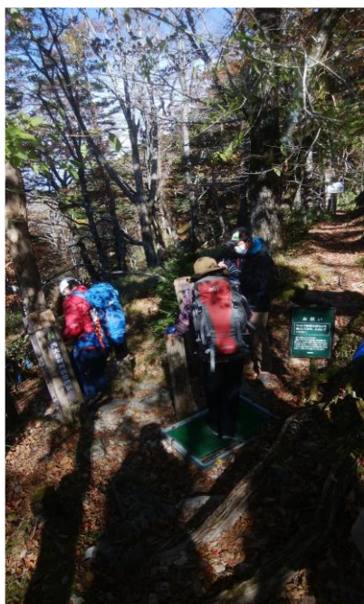
出入口でチェックと靴底泥落とし

メモ : 西大台入山には事前申請と一人1,000円の協力金が必要で入山当日はレクチャーを受けてから出発です。