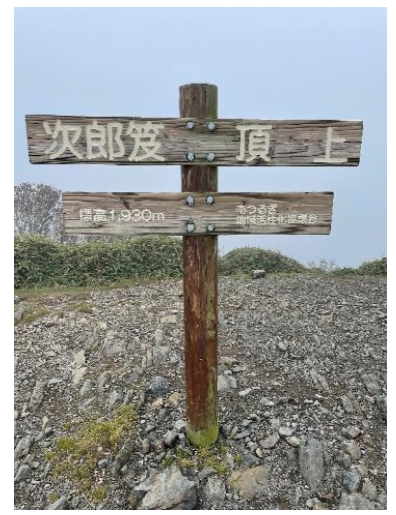
24. 景観 真っ白 其の一