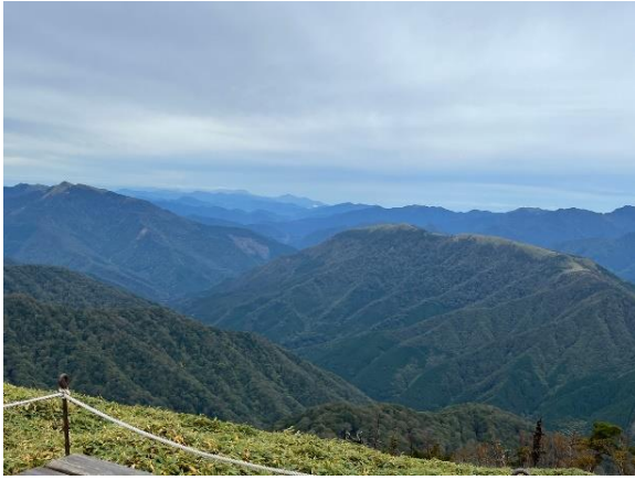
22. 四国の名だたる山が一望できます