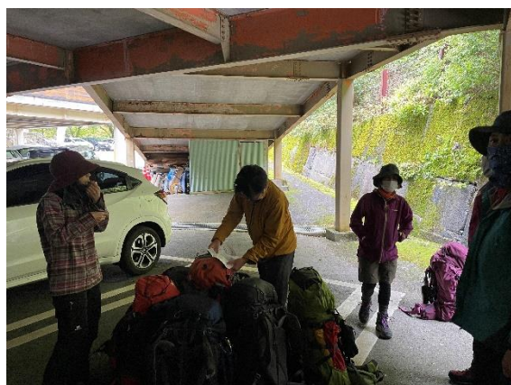
1. 見ノ越駐車場到着

今回の山行は天候に左右されたり、救助活動を行ったり、色々な事があったが楽しい山行だった。