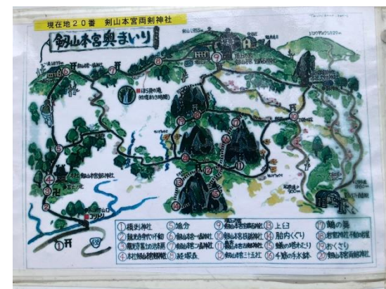
6. 剣山本宮奥まいり