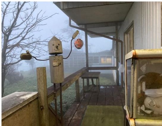
13. 案山子さん？ お出迎え