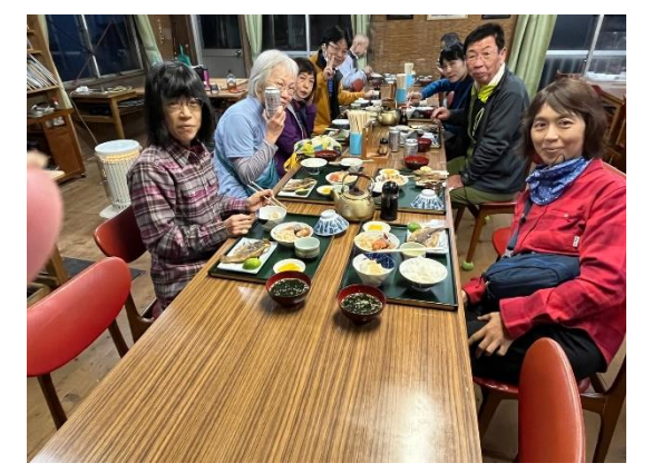
15. 岩魚の揚げ物おいしかった！