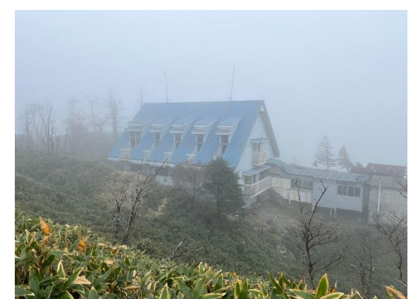
18. 青い三角屋根のかわいい小屋でした