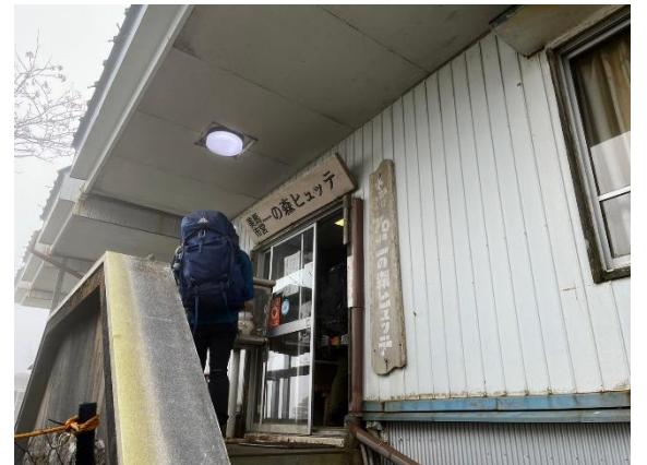
12. 一ノ森ヒュッテ到着