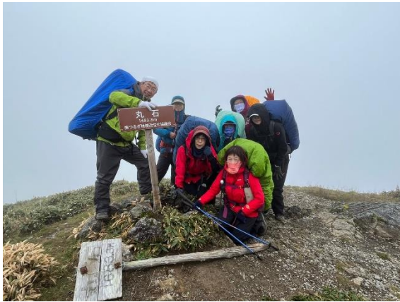
25. 景観 真っ白 其の二