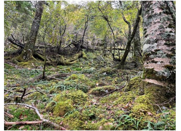
9. 妖精が出てきそうな幻想的な世界