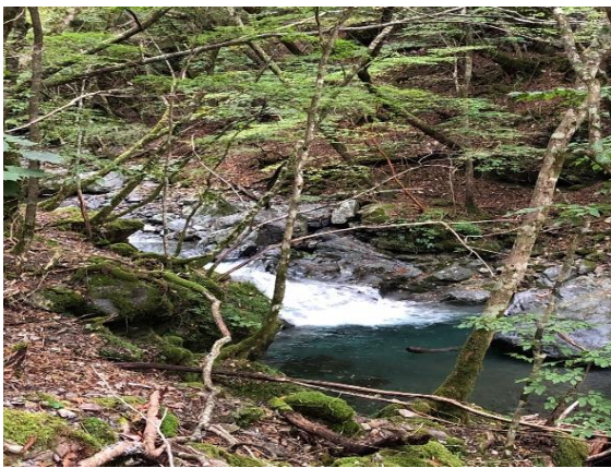
28. 沢の水がきれいでした