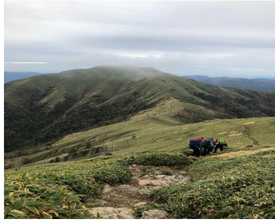
23. ガスがかかり始めました