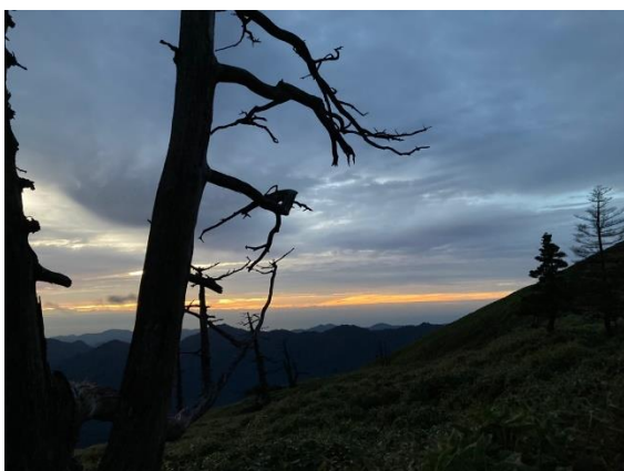
16. 二日目の日 朝焼け