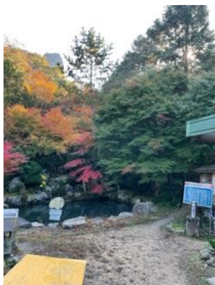
1. 百丈岩登山口到着