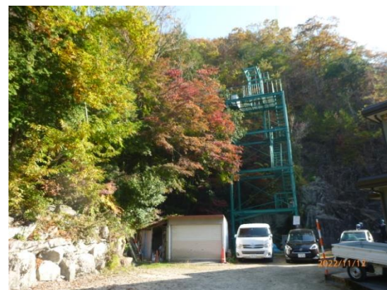
3. ビレー練習塔? (これは大阪労山が作った百丈やぐら)