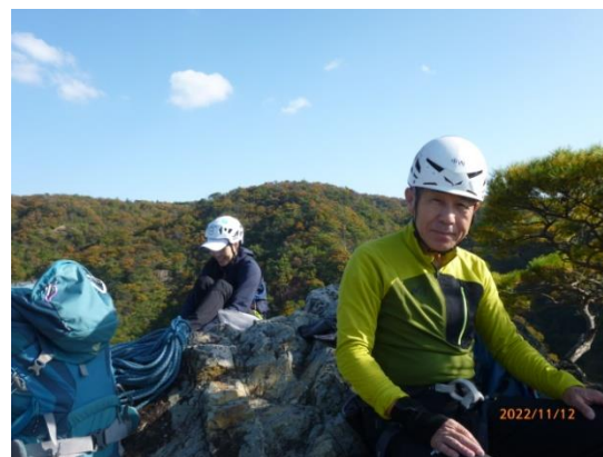
14. ビール飲みたいなー！お疲れさまでした。