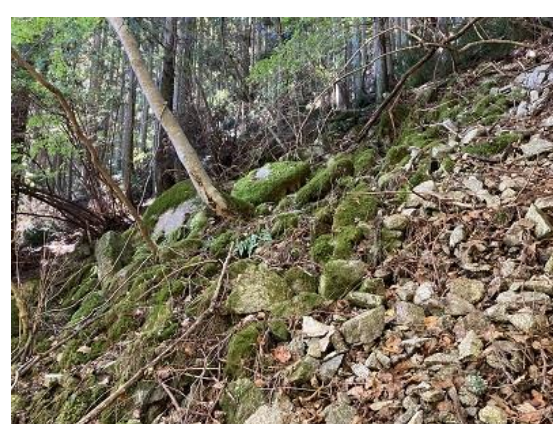
3. 旧登山道はゴロゴロ急坂がある