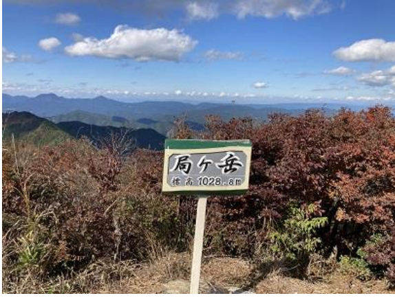
7. ひょいと山頂にでた 遠くは青山高原も見える