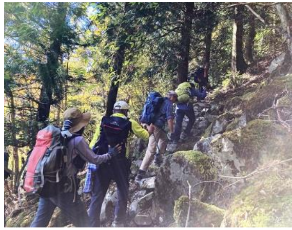
5. また急坂が現れる