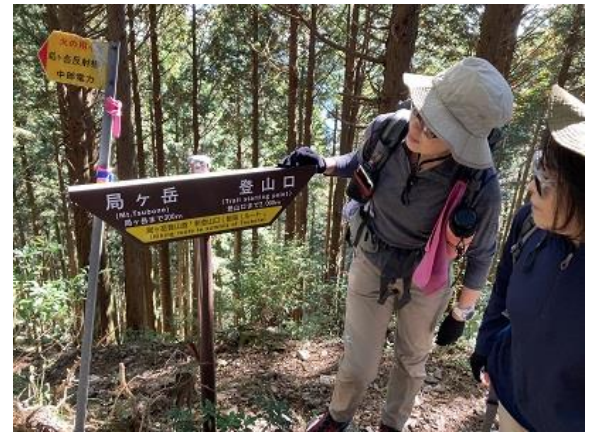
6. 旧道と新道の出会い しばらくで山頂だ