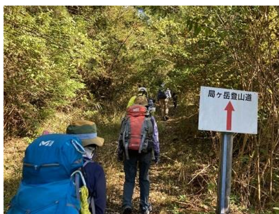
2. とりつきはおだやか