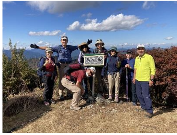
8. シャッターを切ってもらった三重県の登山者と談笑 六甲縦走を紹介した