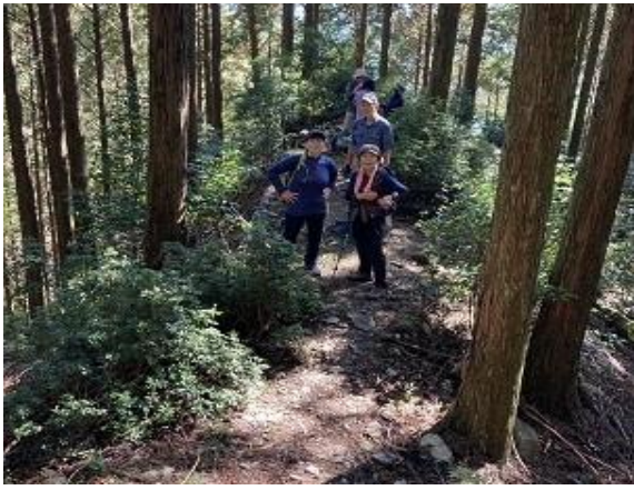
4. 尾根にのる ここからもひとふんばり