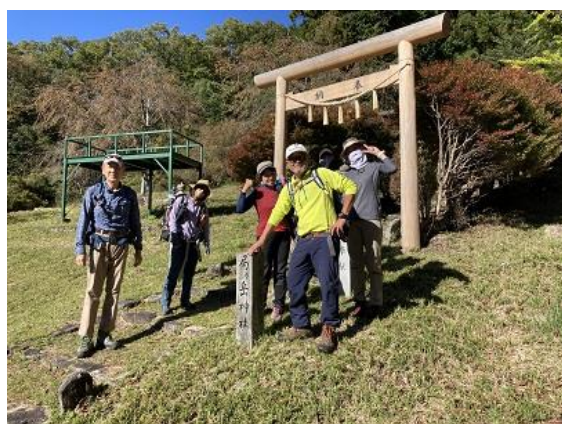
1. 局ヶ岳神社 すぐ近くに駐車場がある

新道は、幅が広く、つづら折りで傾斜をかわしているのとても楽な印象を受ける。新旧と登山道は登山口で合流している。(H.U)