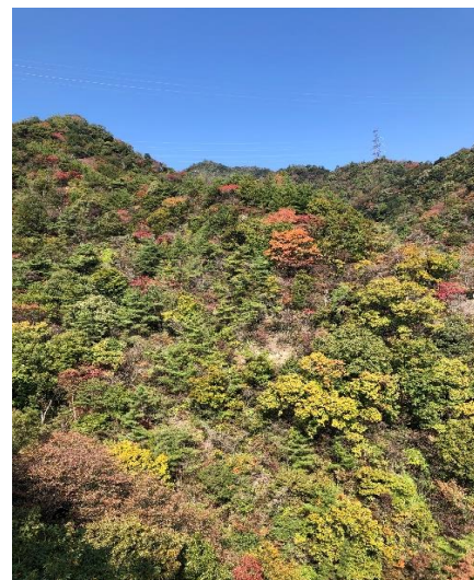
ロックガーデン中央陵