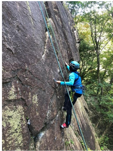
手足の置き場がなく粘り強い登攀