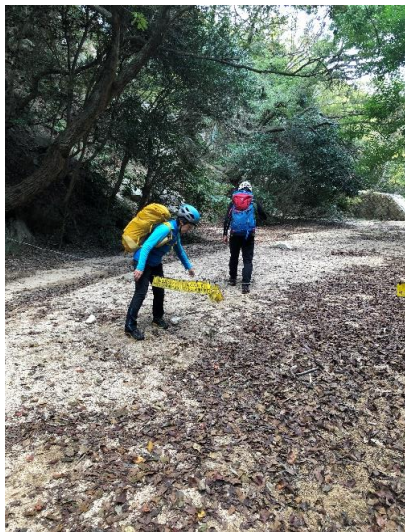
地獄谷入口の鉄線に戻る