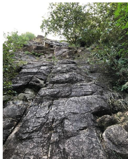
名前通りデンと構えている 高さ25M 手足の置き場は有る