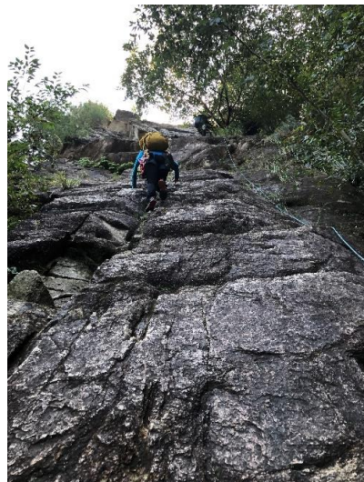
ザックを担ぎアルパイン