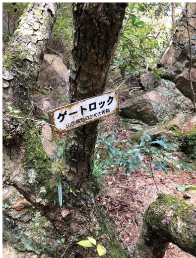
ゲートロック到着 クライミング装備装着