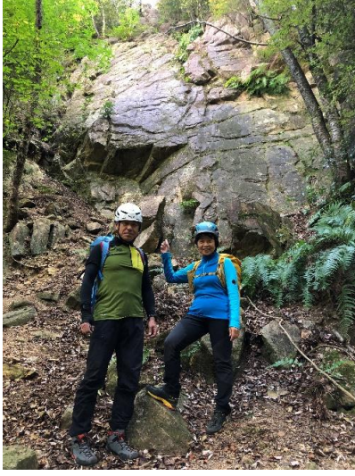
アルパインで登り 懸垂下降①