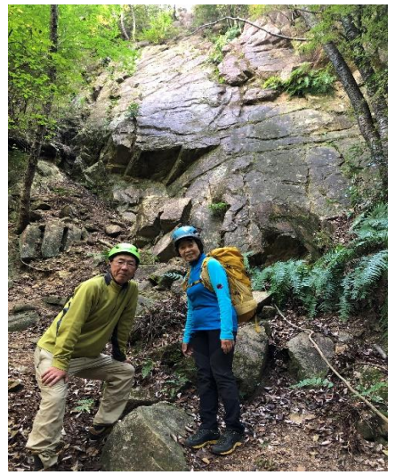
その② 無事終わりました