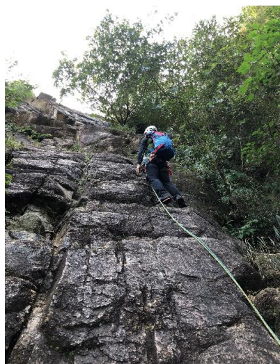
CLがリードで登攀開始