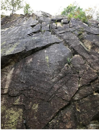
ホワイトフェース全貌