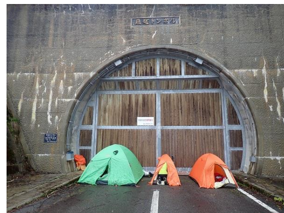
4. 今日はトンネル入り口でテント泊