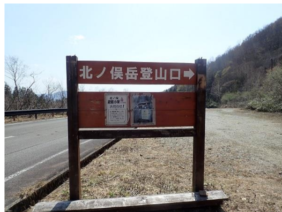
19. 無事下山！この看板出すぎでした。