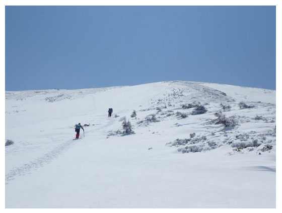
15. 黒部五郎の最後の登り。きつかったー