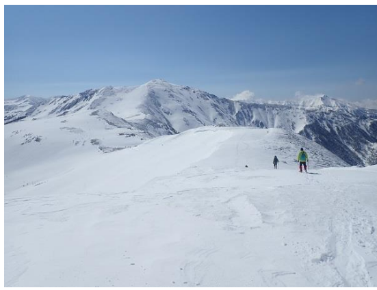
14. 稜線歩き。眺望はずっとすばらしい！