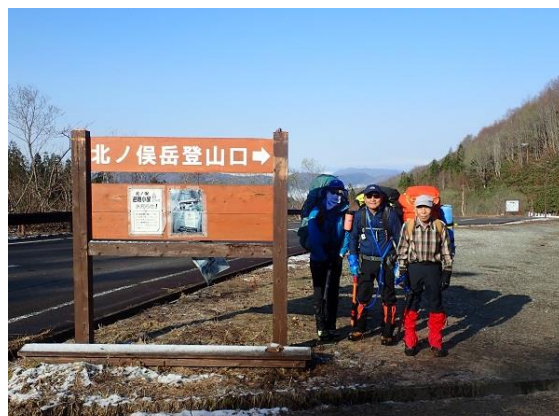
5. さあ出発! 天気もばっちり