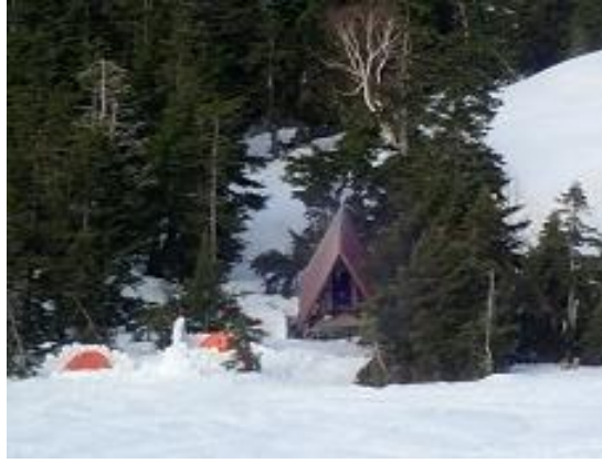
8. 避難小屋を超えて