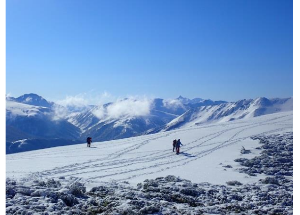
12. ようやく稜線に出た。素晴らしい！