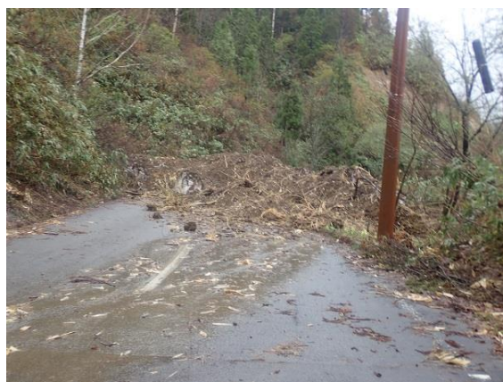
1車ではここまで。雪崩あと。