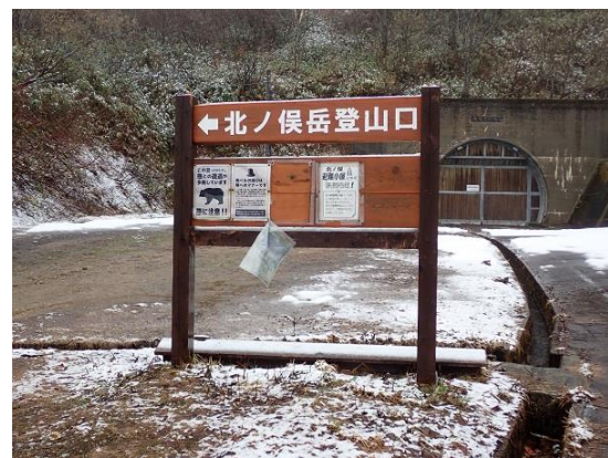
3. 運よく15分くらいで到着