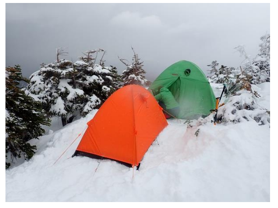
9. 北ノ俣岳手前 2300m 付近でテント泊