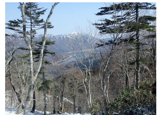
6. 有峰湖 わかりますか?