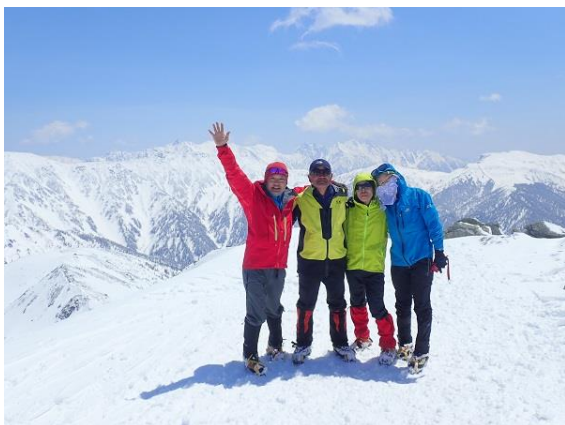
16. 黒部五郎岳山頂！ 大満足！