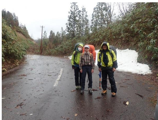
2. さあ出発。登山口までどれくらいかかるの?