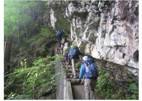
よく整備された歩経路