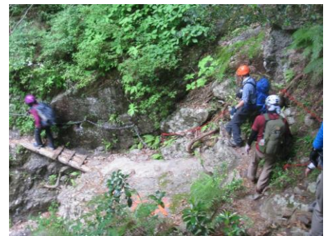
下りは特に慎重に