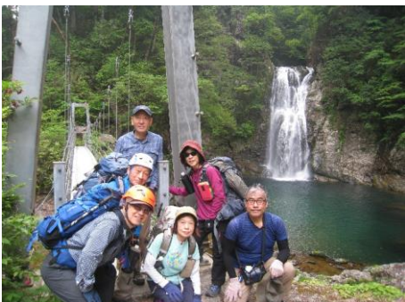
堂蔵滝、吊橋と集合写真①