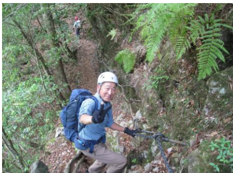
今回山行のリーダー