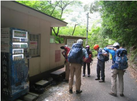
大杉谷登山口(入山料1,000円/人)

色々な顔をもつ「滝」と人工美の吊り橋の連続、そして圧倒される巨岩(一枚岩)の崖というか山、更にビックリの巨石が群れる崩壊地跡、スリル満点の歩経路等々の1泊2日の大杉谷を愉しんだ。残念ながら天候の加減で大台ヶ原周回は、次回とすることにした。(心配していたヒルの被害は、ありませんでした。)