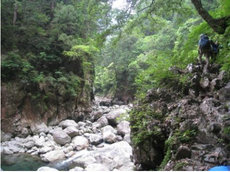
崖面に沿って進む