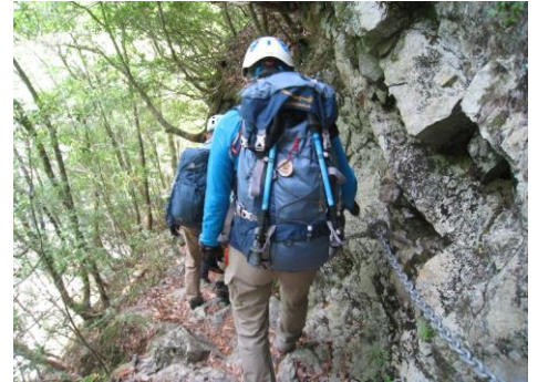
慎重に行きましょう