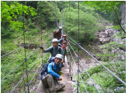
平等崙吊橋 (ああしんど)