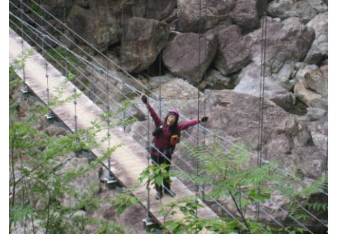
平等崙吊橋 (先頭を突っ走る)