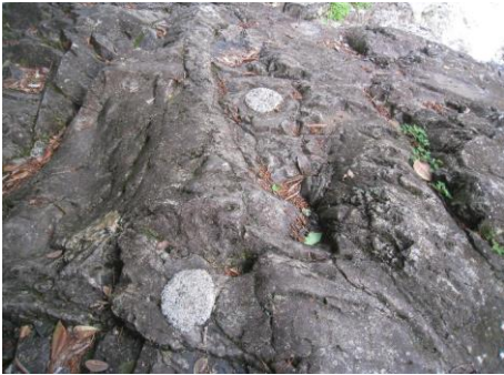
滑り止めのモルタル（白い丸）