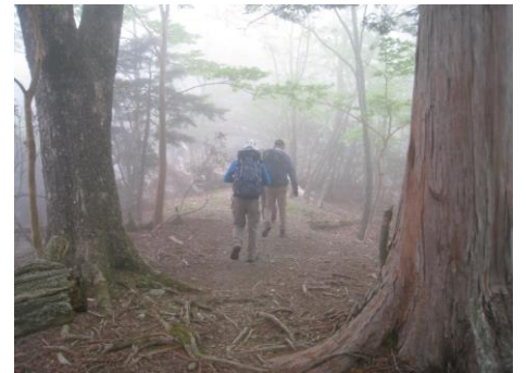
稜線に出る(ガスってきました)