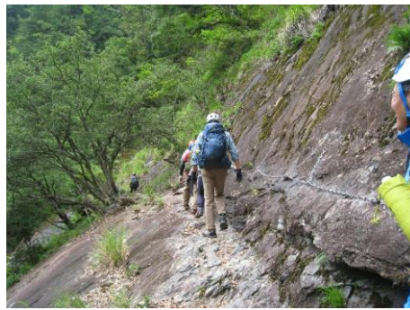
ヘルメット装着して出発