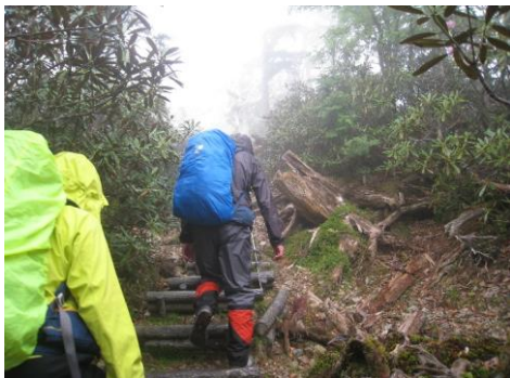
日出ヶ岳へ最後の階段 (降り出した)