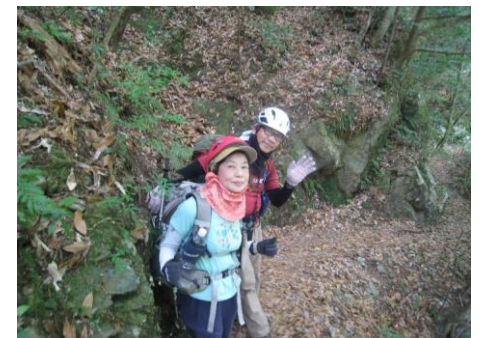
まだまだ元気そう