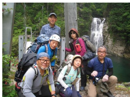
堂蔵滝、吊橋と集合写真①