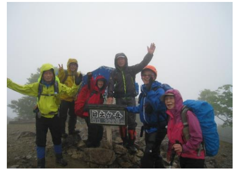
日出ヶ岳到着①(雨とガス)