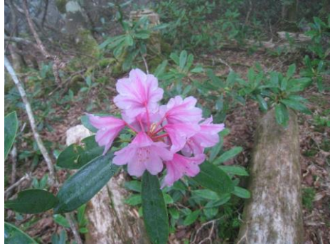
シャクナゲ (一週間ほど遅かった)