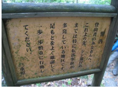
これよりシシ淵付近まで転落事故多発