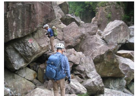
崩落地内を進む(整備されている)