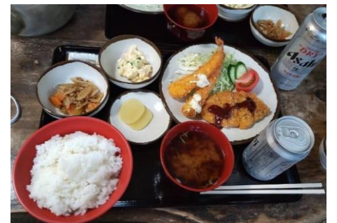
エビフライと大盛り飯