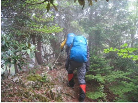
事前に雨対策 (バッチリです)