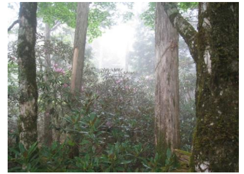
シャクナゲ(わかります?)