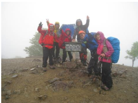
日出ヶ岳到着② (寒いです)