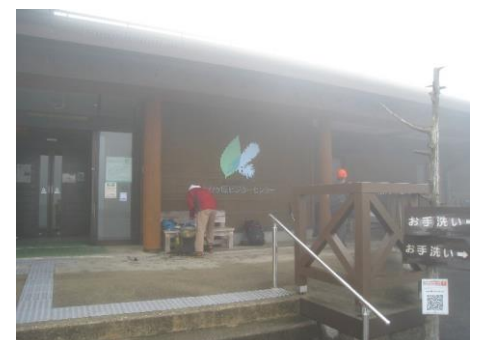
周回中止ビジターセンター直行(お疲れ様でした)食堂兼お土産店でストーブを囲んで「うどんとビール」仲間と楽しい会話でバス待ち