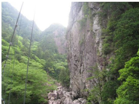
一枚岩の巨大な崖面 (迫力満点)