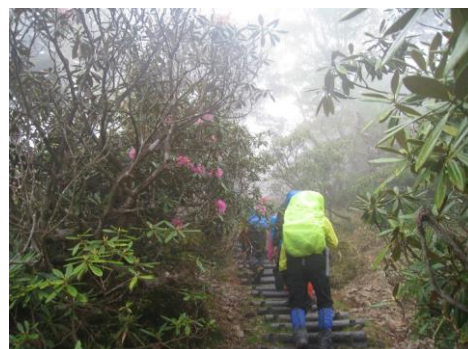
シャクナゲと階段 (降ってきた)