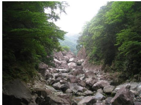
崩落地全景(大迫力)