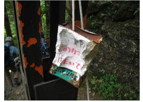
熊予防空き缶叩き(2名叩く)