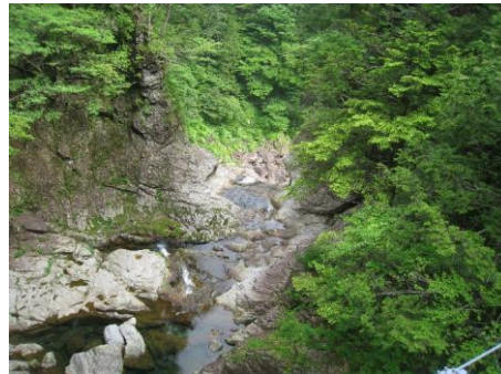
光滝の天端(隠滝吊橋より)