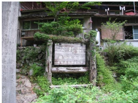
桃の木山の家到着 (当日3組13人)