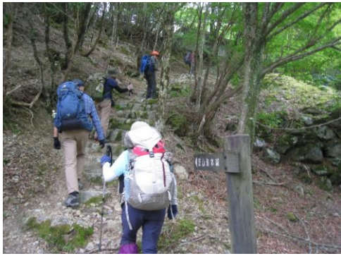
溪谷から外れ山道へ