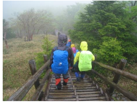
いざ大台ヶ原周回へ