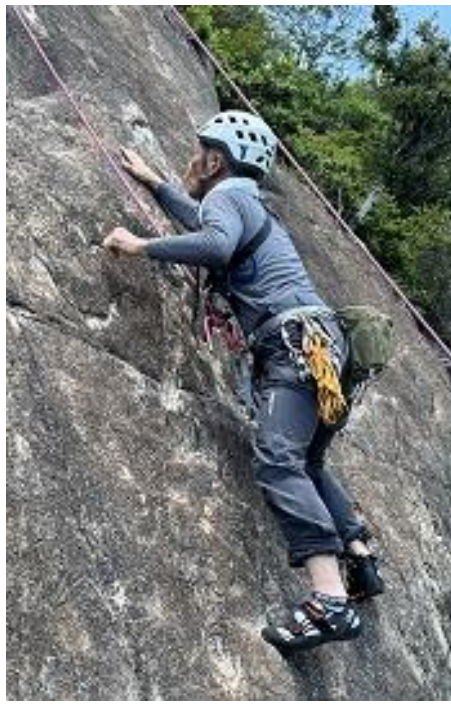
だいぶん登りました