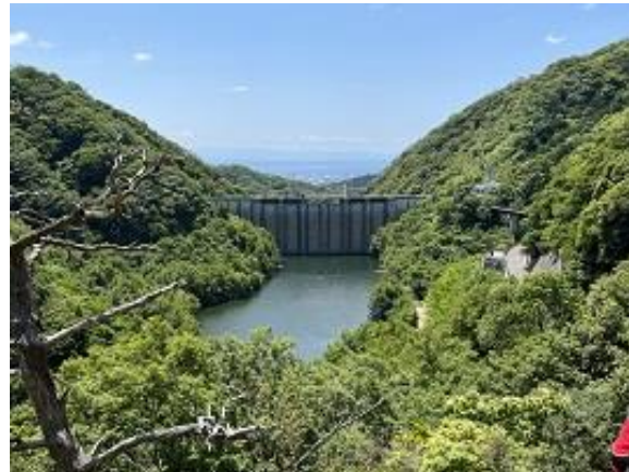
ダム湖が見えます