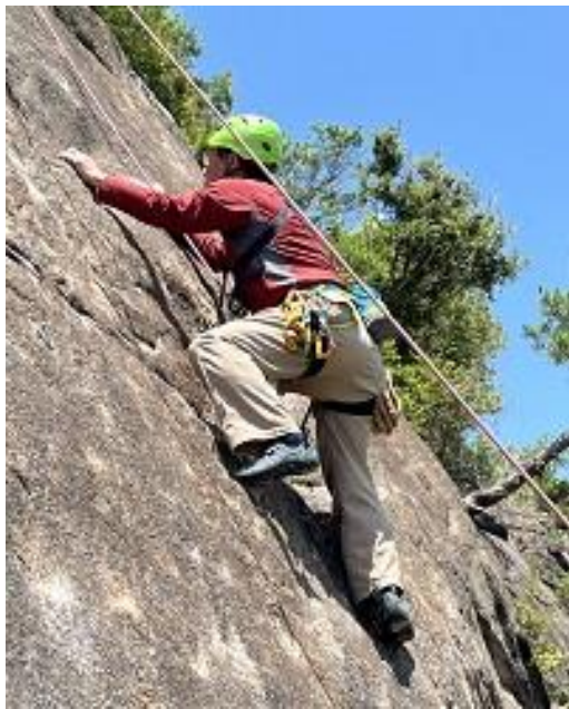
しっかりつま先で乗ります