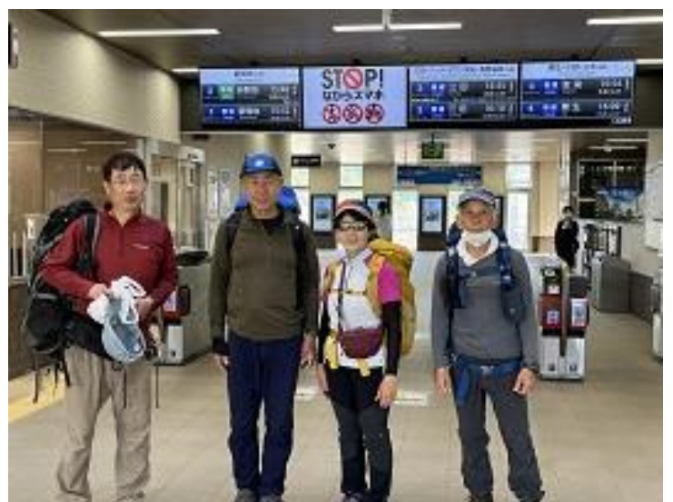
鈴蘭台駅で解散、お疲れさまでした。