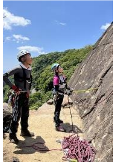
Kちゃんビレーです