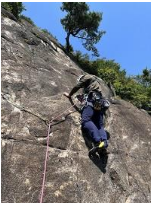
リード中のリーダー、頼もしいです!