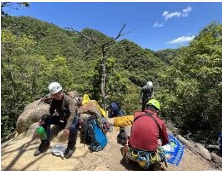
暑い中、お昼休憩です