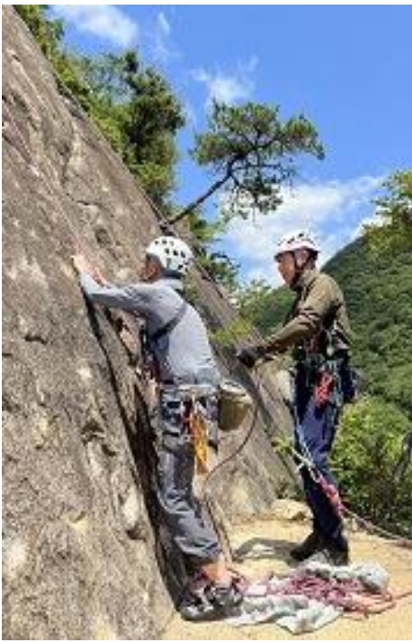
さあ、ハシケンさん行きます！