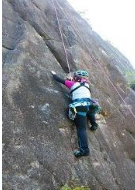
次のホールドはどこ？