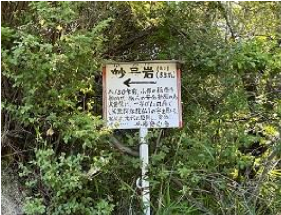
駅から30分ほど歩き立て札目印に右に入ります

6月の岩例会として妙号岩へトレーニングに行く前の壁には、一辺1.3mの「南無阿弥陀仏」の経文が彫られていて、そこに足をかけて登ることは禁止されている。 とにかく暑くて、一日中カンカン照りだ(-_-;) 基本をしっかりと学び、4人それぞれ弱点を見つけながら、登りました。