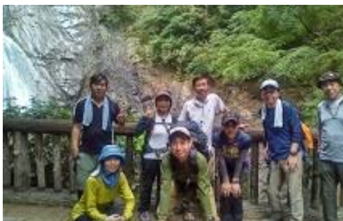
布引の滝にて。お疲れ様でした。