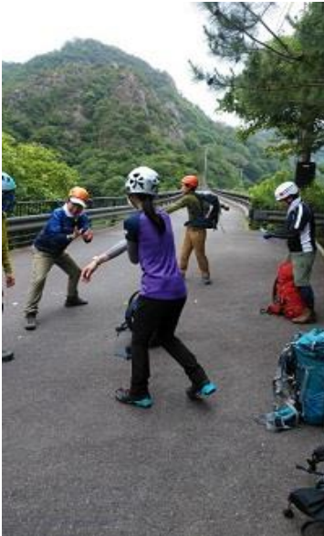
個性的な・・・人々。