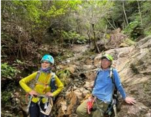
つかの間の・・・安堵の時間