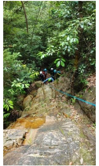
気合いの入る一瞬です。