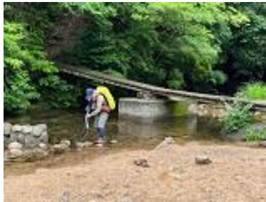
市ヶ原で何やらする人。