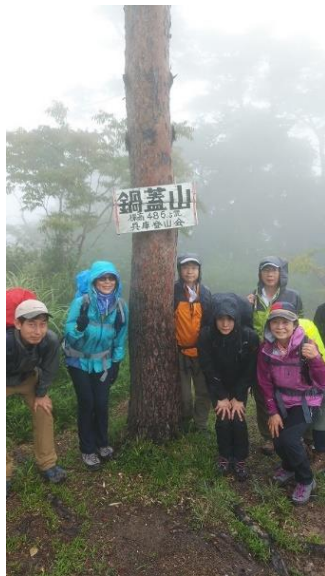
鍋蓋山に到着しました。 ヤレヤレです。