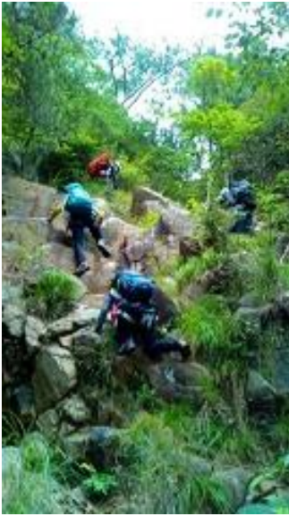
容易な岩場はフリーで。