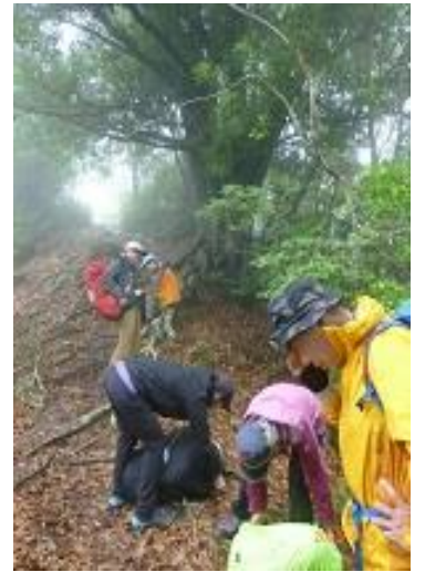
雨が降ってきました・・・。