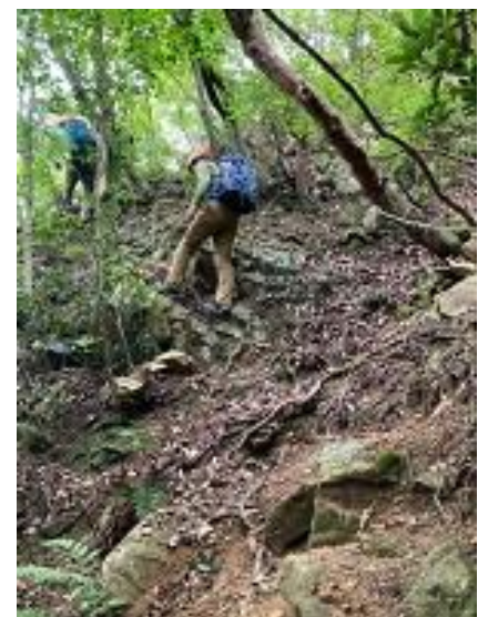
尾根に上がっていく。