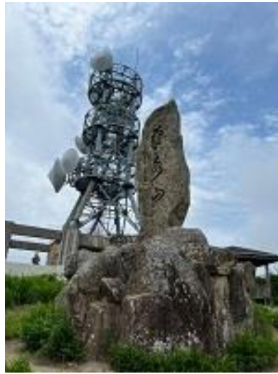
菊水山に着きました。