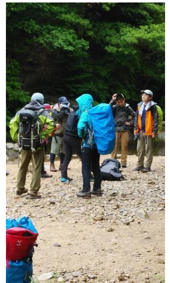
市ヶ原で何やら相談する人々。