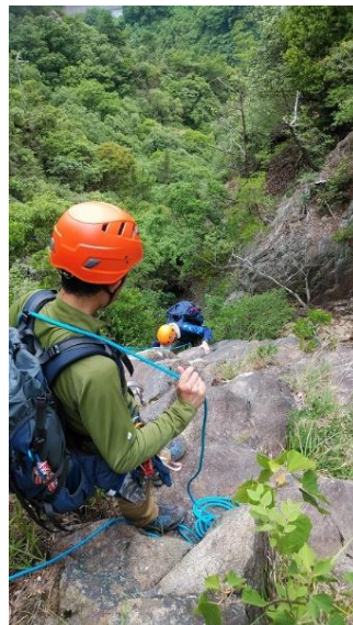
肩がらみでラストをビレー