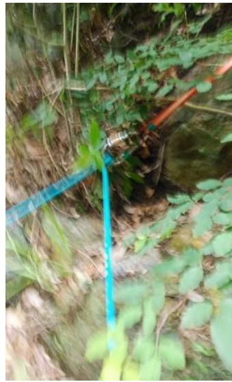
危険箇所はフィックスロープを。