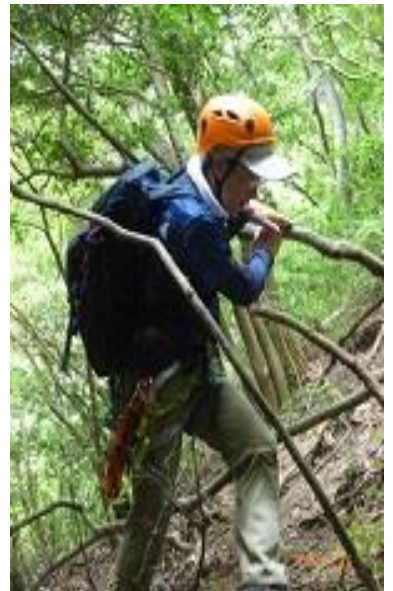
ときには木を掴み登る。