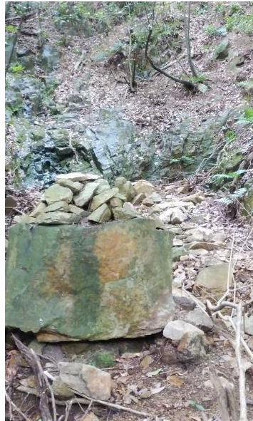
菊水ルンゼ入り口