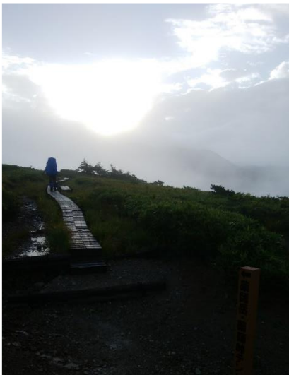
太郎平小屋から薬師岳へ