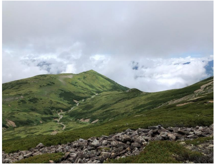
東の間の晴れ間に見えた稜線風景