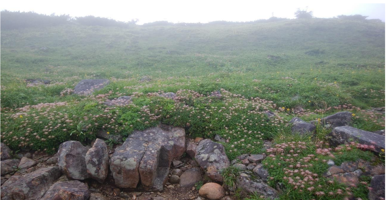
登山道脇のお花畑(最盛期はもっときれいであったと想像できる景色でした)