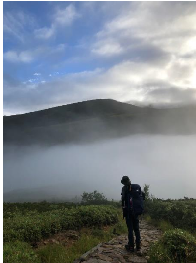
奥に薬師岳薄っすら見えています