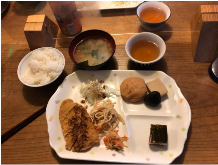
太郎平小屋の夕食