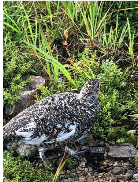
太郎平木道で出会った雷鳥