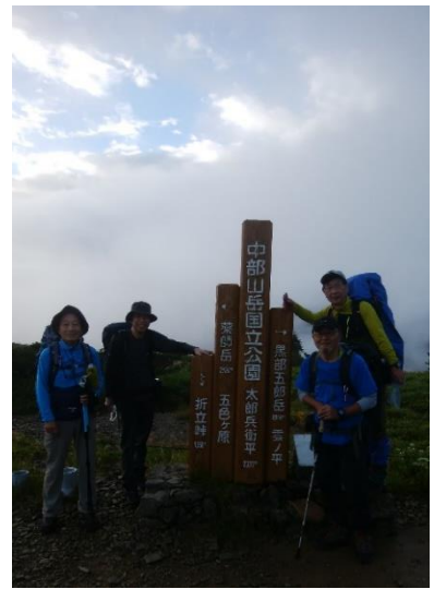
太郎平小屋前記念写真