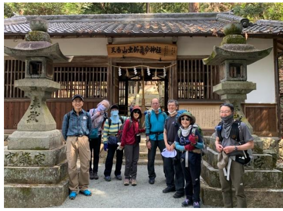
天香具山神社にて