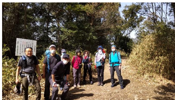
2座目耳成山山頂付近、楽勝でした