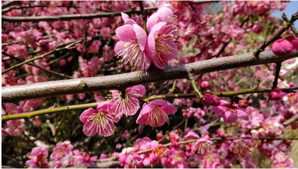
ソフトクリームを食し、梅を見ながら次の目的地に