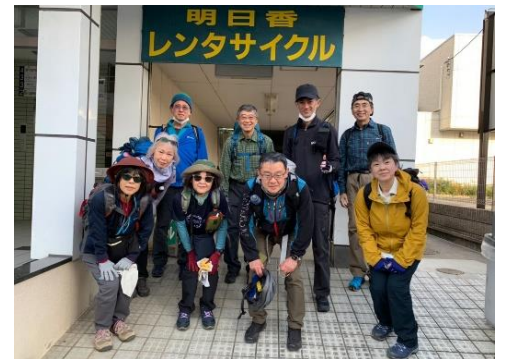
無事に帰ってきました。お疲れさまでした。