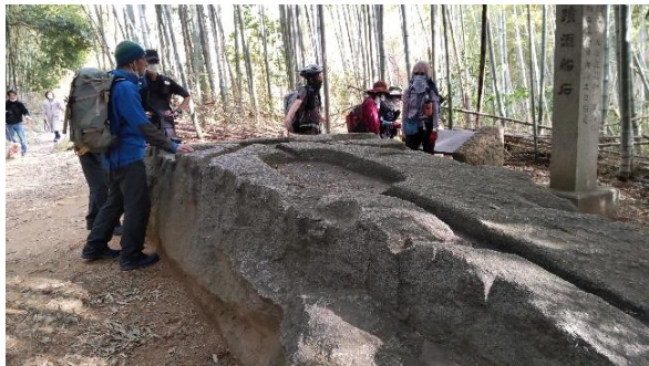
酒船石に興味津々、何に使ったのだろう？