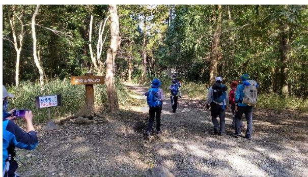
神社参拝後に畝傍山に向かって出発