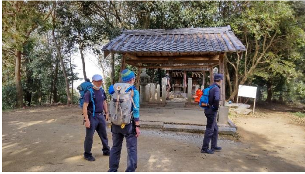
3 座目天香具山山頂付近とみられる神社にて