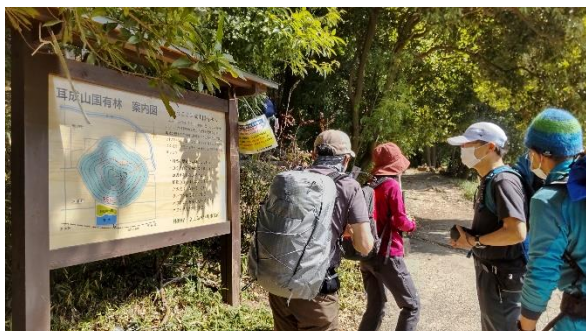
耳成山登山口に到着