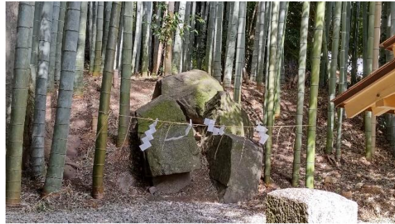
ここにもあった、天岩戸神社、その裏にある御神体の岩、どこに隠れていたんだろう？