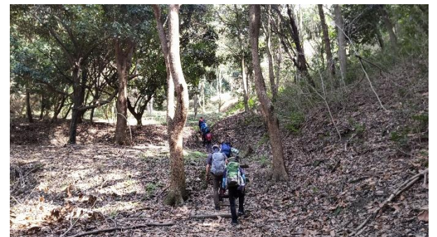
次の目的地天香具山に向けて登山開始