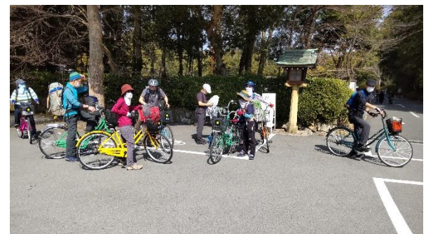
耳成山に向けて出発