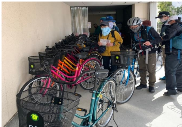
よりどりみどり、どの色にしようかなあ。どれも同じ自転車です！

一気に春の訪れを感じさせる陽気のなか、汗をかきながらのサイクリングと登山になりました。今日は100m級の登山で楽勝と思っていましたが、さすがに3座（甘樫丘を入れて4座で500mのアップダウン）と、総行程29.3km、6時間50分という長時間行動に心地よい疲れで満足をすることができました。古い街並みや歴史的建造物を巡りながら、古来からいわれのある大和三山にとりつきながら、いつもにはないバリエーションを堪能することができました。裏道まで熟知したナビゲーションを行っていただいた企画&ガイドのはしゃーんさんに感謝です。