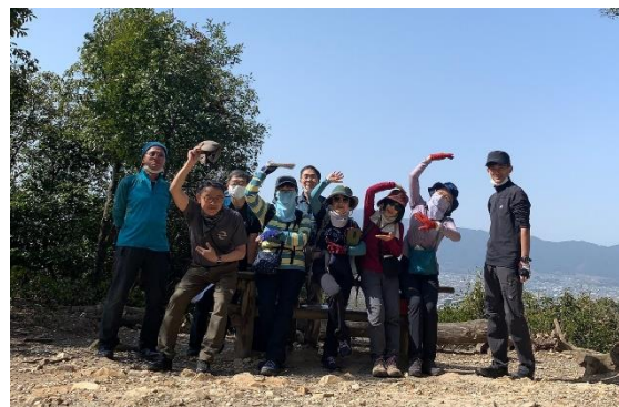
1座目畝傍山頂にて、ちょっと汗をかきました