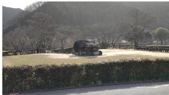
石舞台古墳、遠くから眺めただけでした