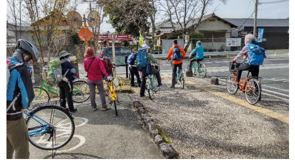
これからは飛鳥路サイクリングを楽しみます