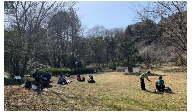
万葉の森に到着、少し遅めの昼食休憩