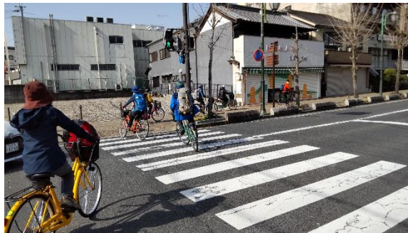
チャリンコ部隊出発、9台はけっこう大所帯