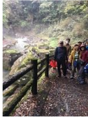
全国遊歩道百選にも選ばれる