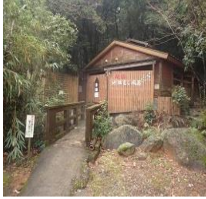
地獄蒸し風呂は最高だった 宮崎えびの産焼酎名月で乾杯