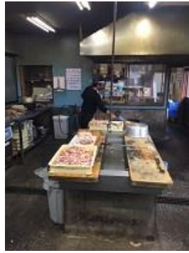
宮崎の焼鳥はバーナーで焼く