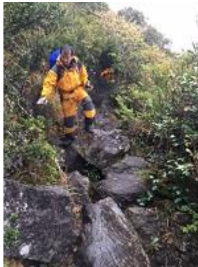
雨の中滑らない様慎重に