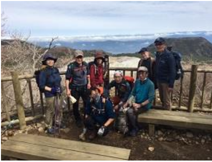
硫黄山火口展望所で休憩