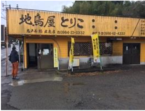
夕食用に宮崎地鶏の焼鳥を調達