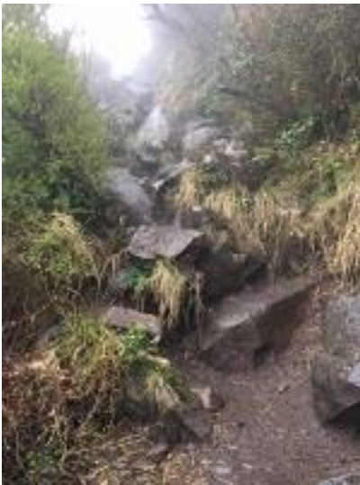
巨岩が転がる道に登る