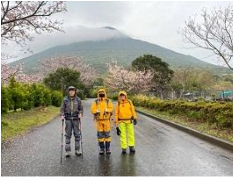
開闢岳と桜を背景にいざ出発