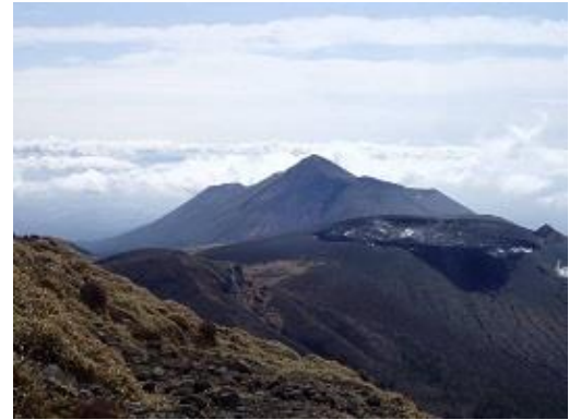
山頂から見た新燃岳と高千穂の峰