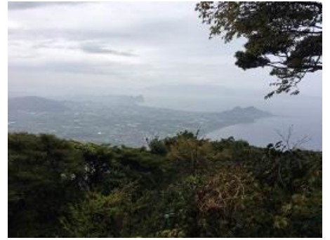
長崎鼻 遠くに佐田岬も見えた