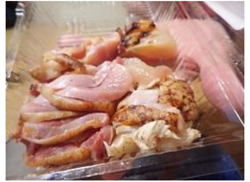
地鶏のたたきが最高に美味