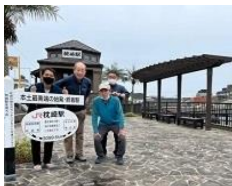
日本最南端の駅 枕崎