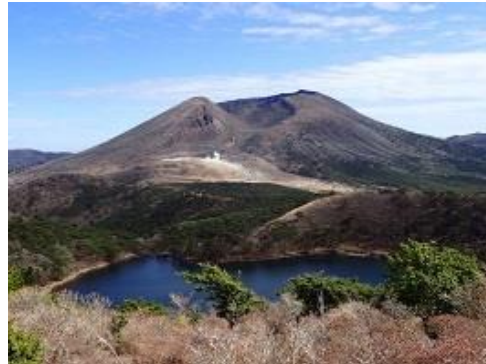
山頂から望む白紫池と韓国岳