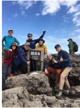
韓国岳山頂に到着