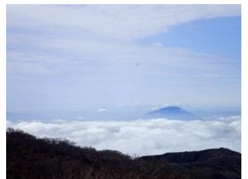
雲海に浮かぶ桜島と遠くに開聞岳