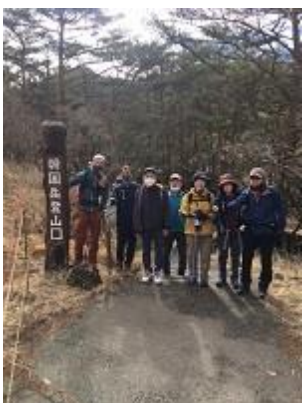
韓国岳登山口にて