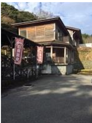
1 日目と 2 日目は白鳥温泉上の湯で宿泊