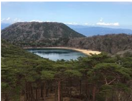
午後は白鳥山へ 六観音御池と甑山