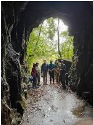
1km に及ぶ三宮溪谷を散策