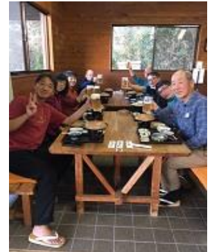
夕食は豚の陶板焼き