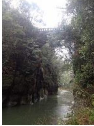
11 の手掘りのトンネルや手作りの石橋