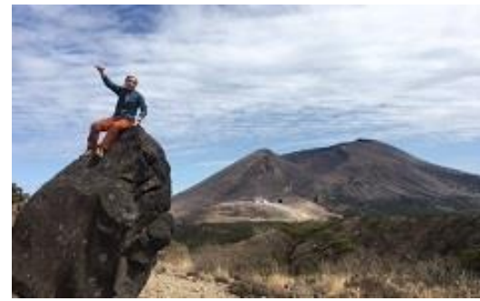
巨岩の向こうに韓国岳