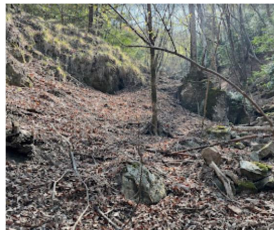
3. だんだんと登山道がはっきりしなくなるが、GPSを頼りに登る。