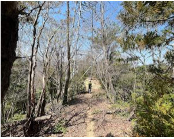
10. こちらは、しっかりとした道がある。