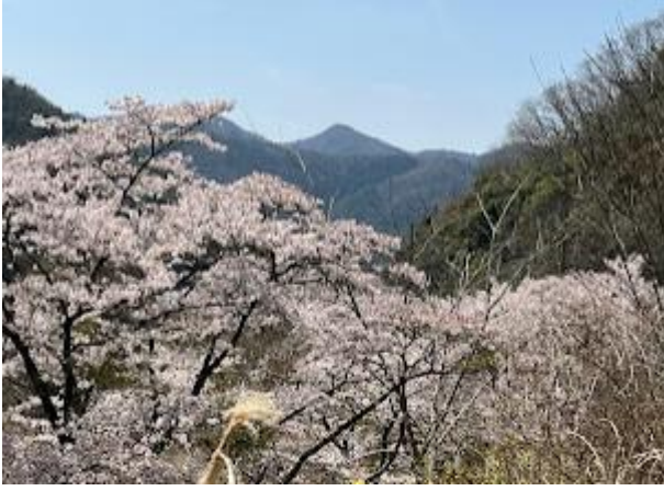
13. 北摂トレイルが続く屋ヶ岳でしょうか。