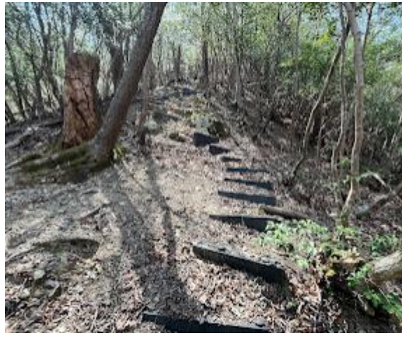
11. 階段も付いている。 北摂トレイルはこのルートがいいよう だ。テーピングをしながら下山。