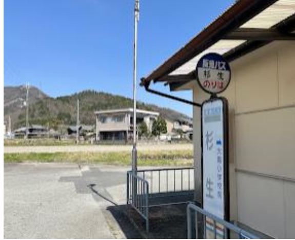
14. 杉生バス停で登山終了。