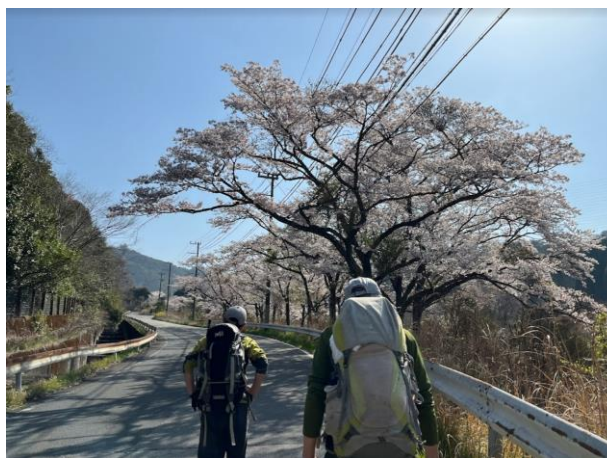
1. 杉生バス停から猪名川変電所方面に向かう。

杉生バス停で、A、B 2班に分かれ、A班は前回踏査時のルートを通り、B班は猪名川変電所側から急斜面をルート探索しながら山頂を目指す。国土地理院地図に記載のある537ピークまでの道を探しながら登るが、途中から道は無くなり、木を掴みながら強引に登る。537ピークからはしっかりとした道がある。下山は丸山からの分岐から猪名川変電所へ向かう。こちらは階段も付いており、しっかりとした登山道であった。