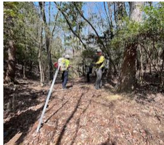
9. 少し堂床山方面に戻り、ルート探索再開。