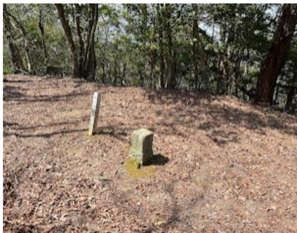
7. 堂床山山頂。展望は無い。ここで昼食、A班を待つ。