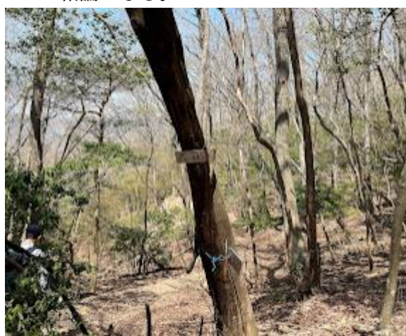
8. A班と山頂で合流後、一足先に出発、丸山に寄る。