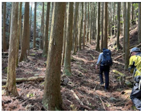
2. 車道から登山道に入る。しばらくは、しっかりとした道がある。