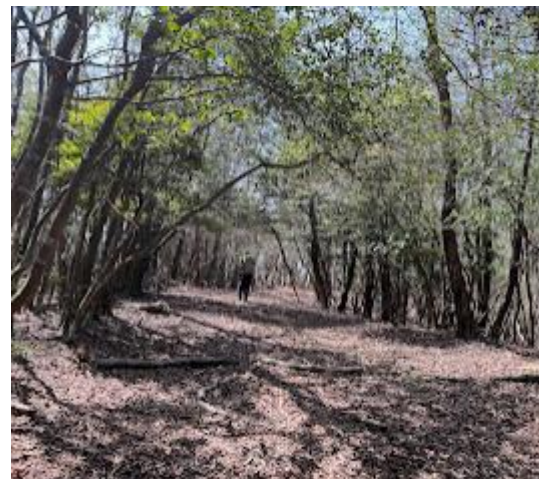
6. 堂床山山頂までは、打って変わって、とてもいい道。