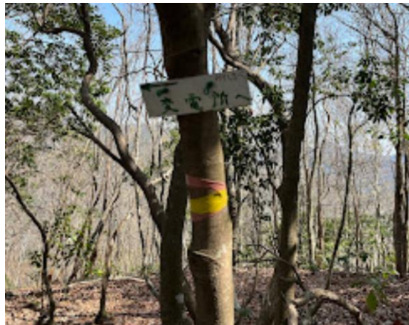
5. 537ピークに到着。こんな標識もあるのだが。来たルートを降りるのは、無理との結論になる。