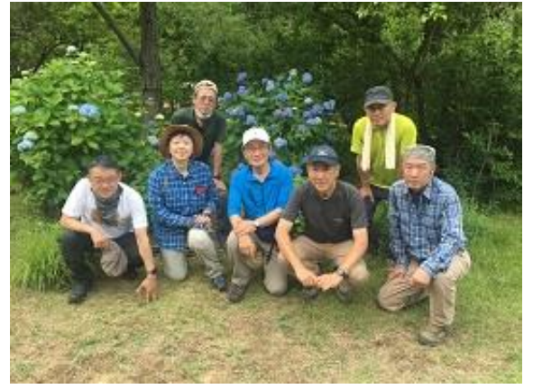
アジサイをバックに集合写真