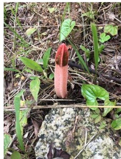
途中正体不明のキノコも