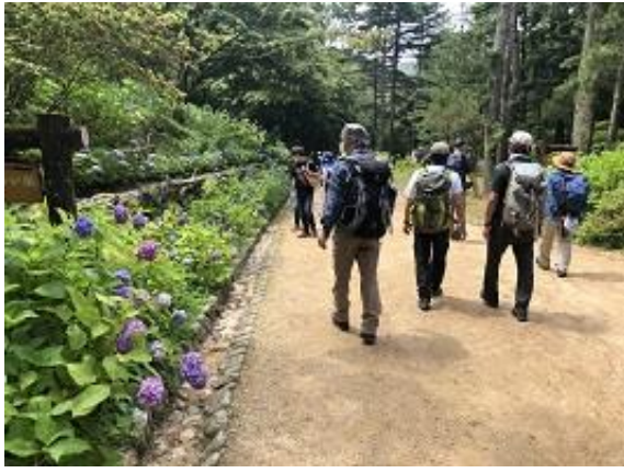
アジサイの咲き誇る道を散策