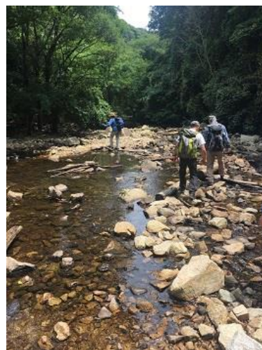
トゥエンティクロスを越え