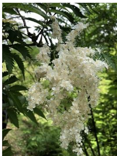
ホザキナナカマド