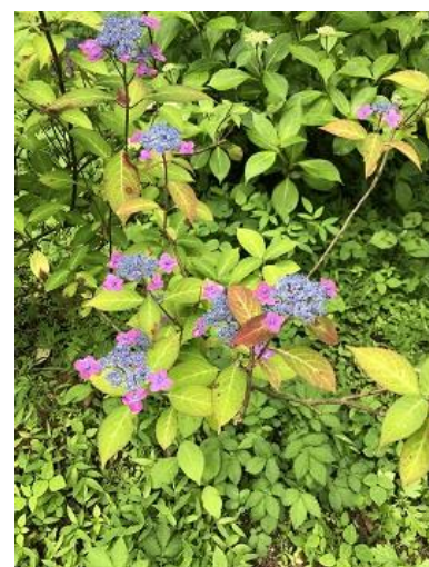
コモチ八重アジサイ