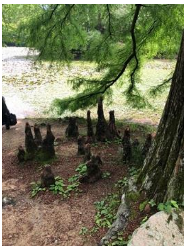
ラクウショウの気根