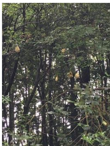
モリアオガエルの卵