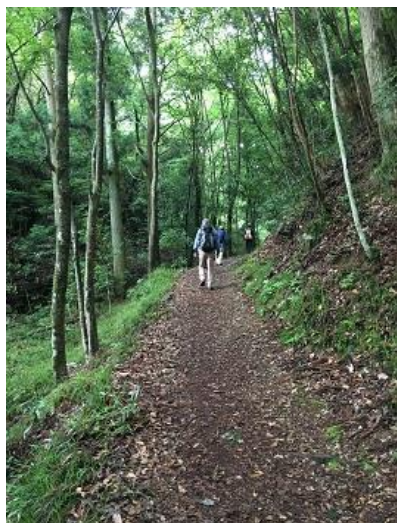
下りで使う事の多い山田道、登ってみると中々気持ちの良い道

13時45分ハーブ園山頂駅到着。一旦ここで解散しロープウェイで下りる組、新神戸まで下山する組に分かれる。下山組は14時10分出発、14時50分見晴台 15時5分新神戸駅着 解散。