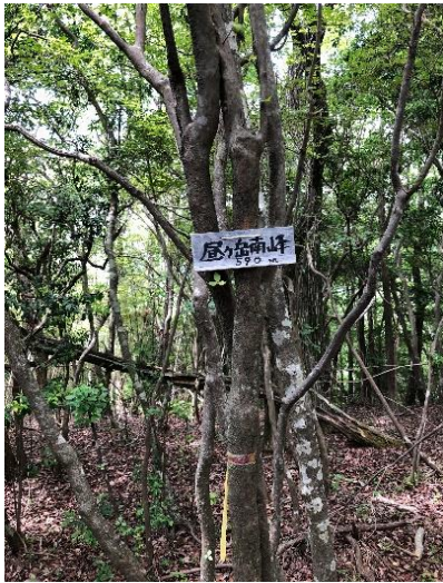
かなりの急登に落ち葉の洗礼 やっと着いた昼ヶ岳南峰