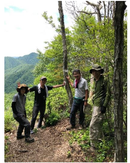
昼ヶ岳頂上から。まだ元気。