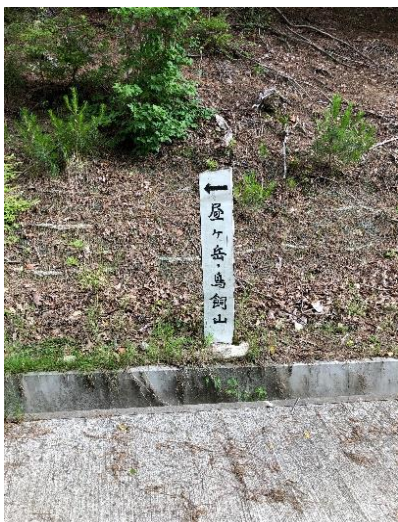
里山道より登山道に入る ここから急勾配が続く