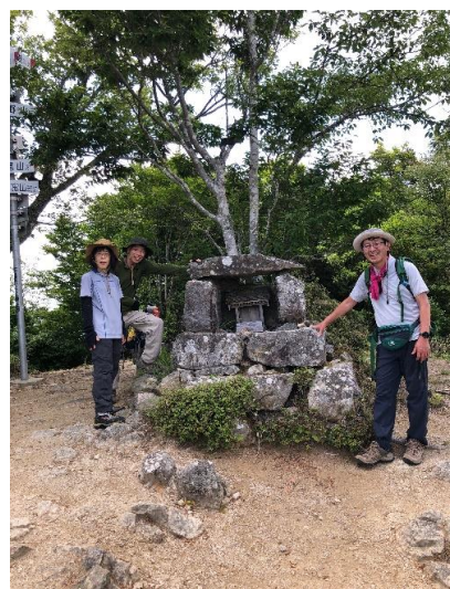
やっと大舟山に到着。 今は使われてない内川池からの 尾根道を詰める。