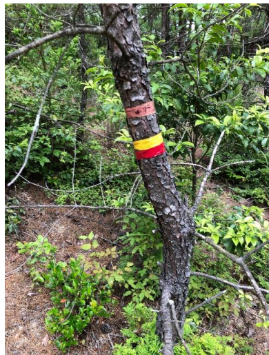
不明点は黄色と赤のテープを 貼りながら進行