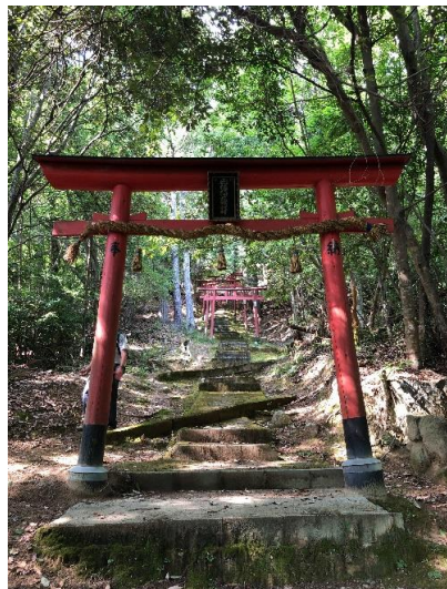
木器手前の天柏神社。 ここに降りるのにまず頂上からの 降口が分かりずらく、猿のように 木をつかみながらの下山。