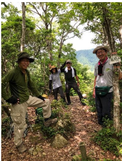
最初のピーク鳥飼山。 皆さん笑顔の余裕。