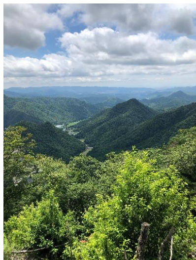
これから向う大舟山遠望