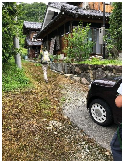
登山道は民家の横を通りぬけて進む 標識はなし。