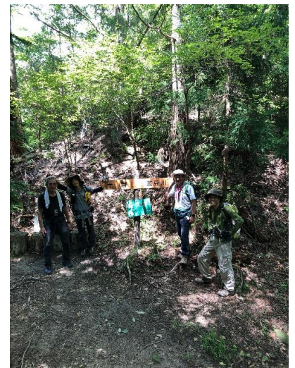
峠に到着。十倉 大舟山 波豆川 の分岐。会長とはここで別れる。