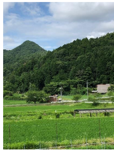
雑木林を抜け田園風景になる 正面が大舟山？