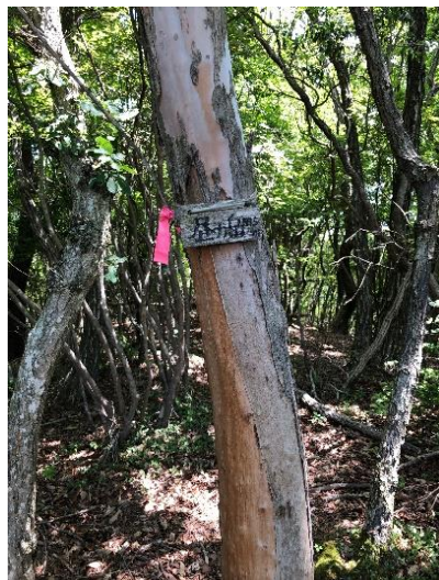
南峰よりまたアップダウンがあり 昼ヶ岳本峰の標識。小さく目立たない