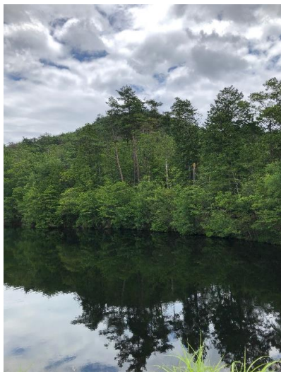
破線の急降下道で内川池 この周辺は落ち着いた雰囲気