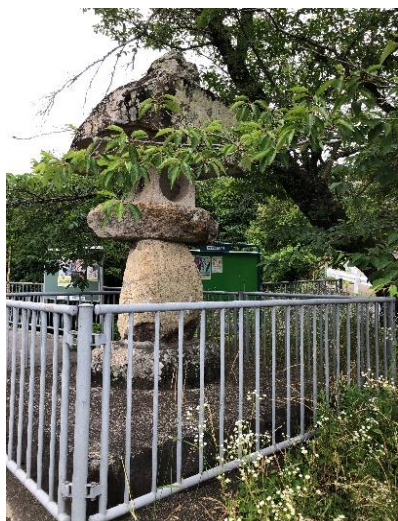
六瀬センターバス停近くの石灯籠 ここを左折する。

4回目の北摂トレイル再踏査である。阪急バス停六瀬総合センター下車、石灯籠を左折。鳥飼山 昼ヶ岳 大船山を踏査する。コース概略として距離12Km 上り1180M 下り1140m。鳥飼山までは里山散策コースだが、昼ヶ岳へは急登り下りが連続する。内川池から大船山登山口まではなだらかな道になるが、尾根沿いの新しい道はまた急勾配が連続する。大船山頂上から木器への登山道も整備はされているが迷うヶ所が数ヶ所ありアップダウンが多い。今コースは距離も長く急勾配が連続し一般向けハイキングでは難しいと思った。