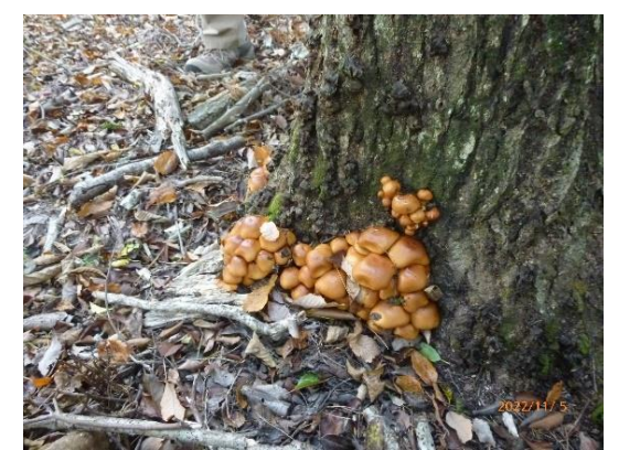
591mピーク近くで見つけたなめたけ群生？