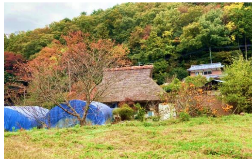
すっかり秋色に染まった農家の景色に癒されます。