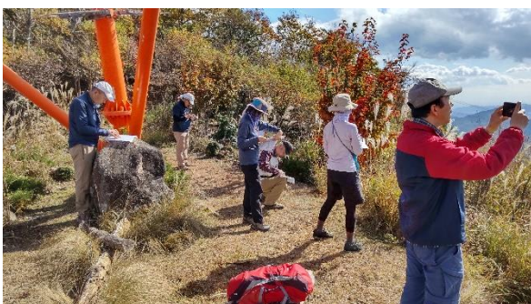
山頂から少し下ったところで昼食と山座同定、コンパスの使い方はなかなか難しいなあ