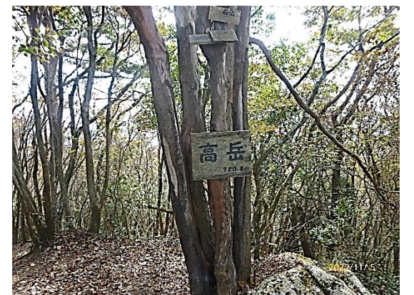
高岳山頂、見晴らしは無いのが残念