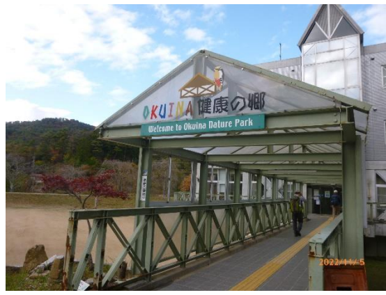
時間がなくて、からすの行水のようなあわただしい入浴となりました。