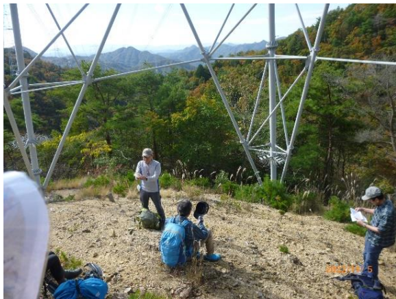
ようやく山座同定できる高度に到達:510m地点