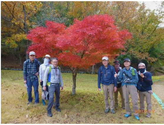
健康の郷近くまで下山、すっかり秋景色。