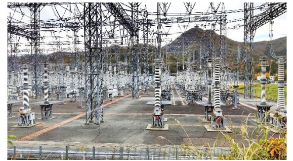
登山道入り口にある大規模な猪名川変電所、幾何学的な美しさも感じられます。