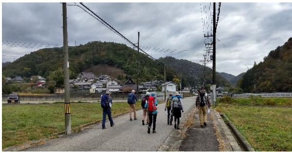
バス停から登山道入り口へ。のどかな里山風景を楽しみながらそぞろ歩き。

山歩きの基本的な技術であるコンパスの使い方を習得する学習登山として「北摂トレイル」高岳コースを歩きました。高岳までは一般的によく知られたコースをたどりながら、指定された地点を見つけ、コンパスで進行方向を決める実習で使い方を習得。山座同定にも応用しました。高岳山頂以降は「北摂トレイル」踏破時にマーキングしたテープを探しながら尾根筋をたどり無事にゴール。マーキングの一部はすでに劣化しているものもあり、設置ポイントの見直しも含めて継続的な手当が必要だと感じました。