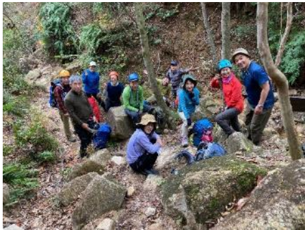
奥高座の滝近傍にて②」