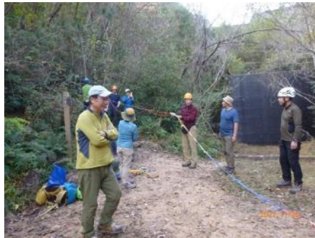
ロープワークレッスン ↑ →