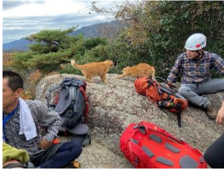
猫 サンデーモーニング