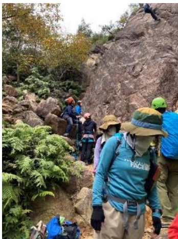
キャッスルウォール トレーニング中のクライマーの横を通過

<おまけ> 1頭しか写せなかったけど横にもう3頭! 丸々と肥えた4頭の親子連れ(?)