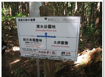
東海自然道分岐に到着