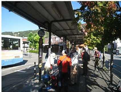
阪急箕面駅①番バス停

CLの復帰第1戦になるはずの4人1組例会山行、体力を考慮しての箕面と聞いておりました。ところがどっこい、「北岳」に2週間前に行ってきたはりました。そんなことで紅葉もない箕面でしたが、晴天の秋空のもと新入会員の方、ほんまに久しぶりの方々のハイキングを楽しんだ。