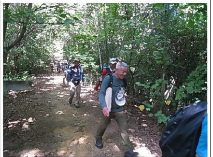
新たに入会されたSさんです