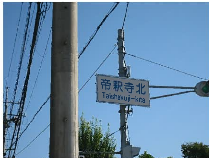
帝釈寺交差点を左折(北上)