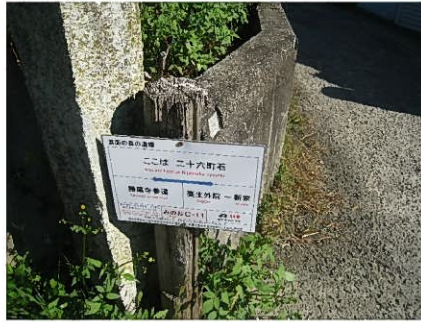
この案内板が各ポイントにあります(勝尾寺参道)