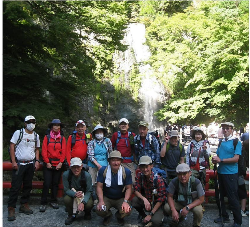
箕面大滝（全員で13名）