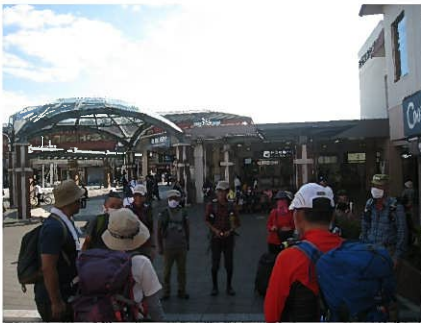
阪急箕面駅 到着（全員反省会へ）