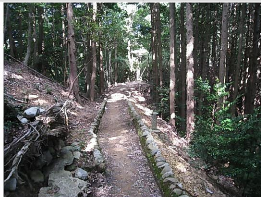
勝尾寺へ参道を下っていきます