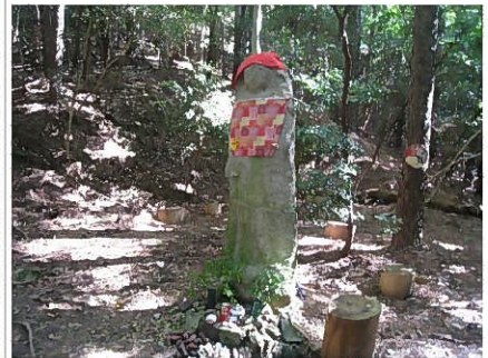
ちょっと寄り道(しらみ地蔵)