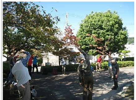
帝釈寺交差点近くの公園にて