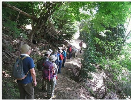
勝尾寺裏手から東海自然道へいざ出発