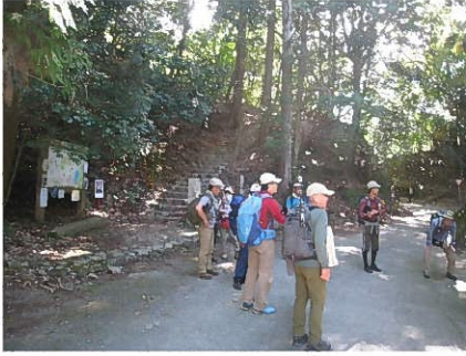
政の茶屋園地 1 到着（昼食）