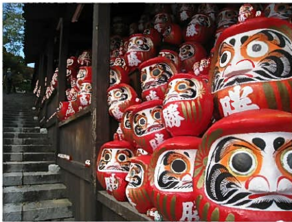
いいね! ③ (もうええわ)