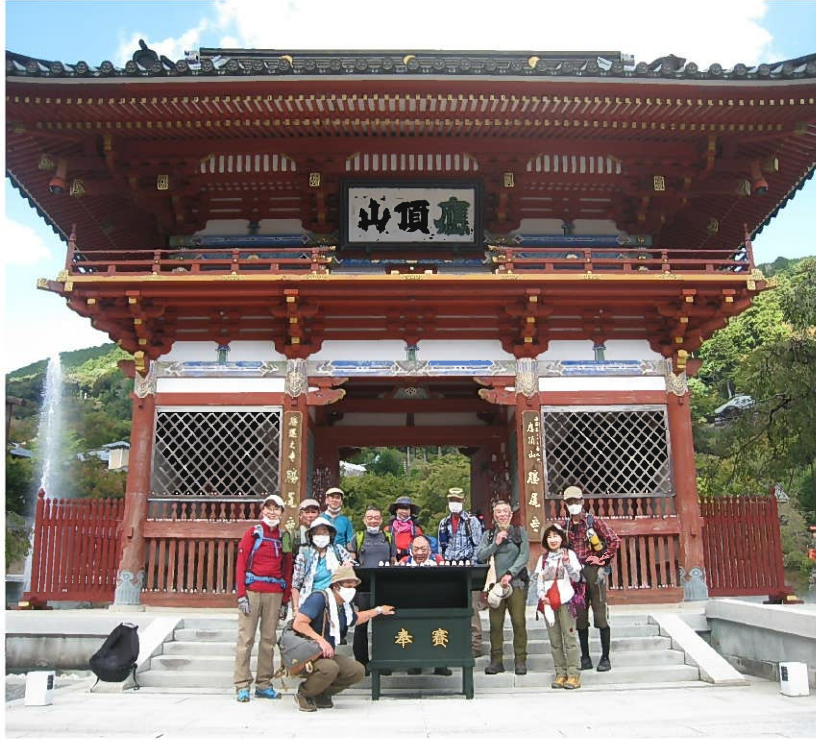
勝尾寺(記念撮影) (小さなダルマと大きなダルマ)