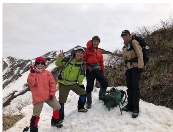
5. 山頂にて(剣ヶ峰をバックに)