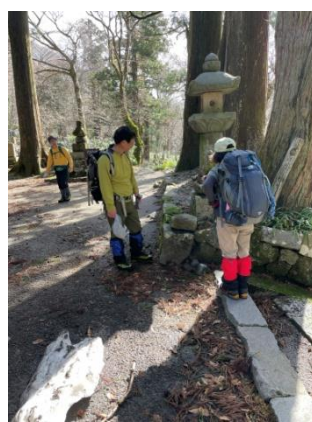
14. 無事に戻りました