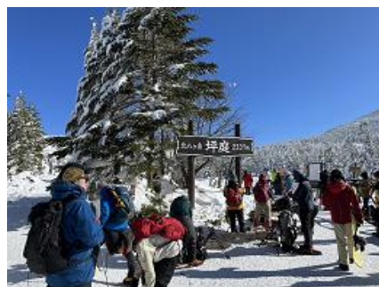
ロープウェイ前に到着、たくさんの人