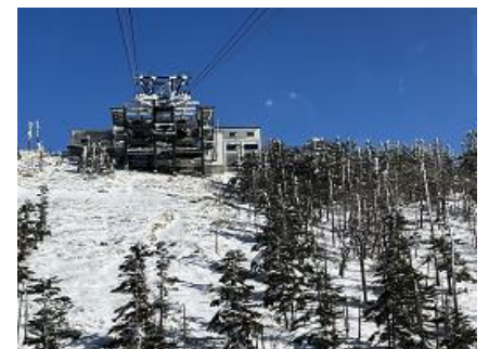
ロープウェイの中から