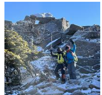
楽しそうに岩場を下る2人