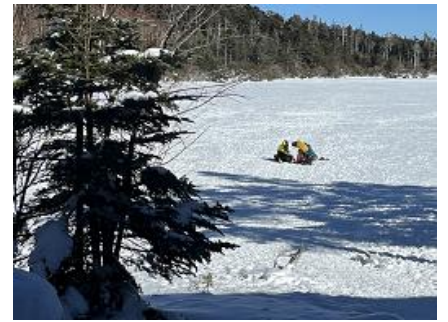
白駒池の上でコーヒータイム