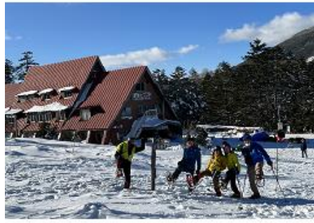
麦草ヒュッテ傍でワカントレ