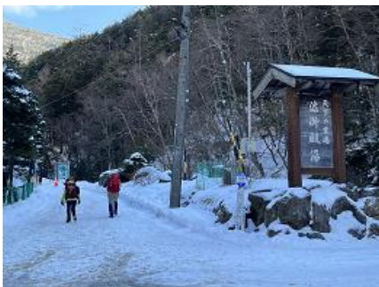
さあ、渋の湯から出発

楽しみにしていた北八ヶ岳縦走 三日間ともお天気に恵まれ、素晴らしい 八ヶ岳ブルー を見ながら歩くことができました ニュウからの富士山、中山展望台からの雄大な眺め、白駒池・雨池の上を歩けたこと 麦草ヒュッテの暖かな部屋・美味しい食事、 ワカン履いてトレーニングと言いつつ大はしゃぎして遊んだこと。ここには書ききれないほど楽しかったです。谷野CLと皆さんありがとう！