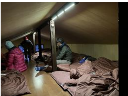
3階の部屋、以外に暖かい