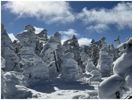
ミニモンスターたち