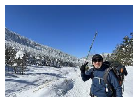
嬉しそうなTリーダー