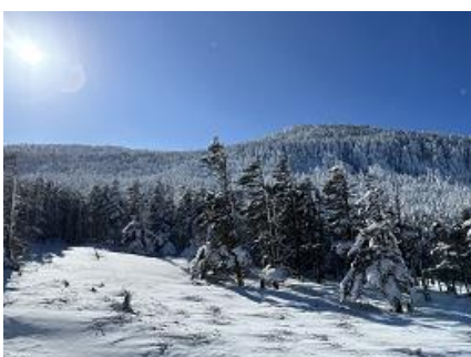
名残惜しい雪景色