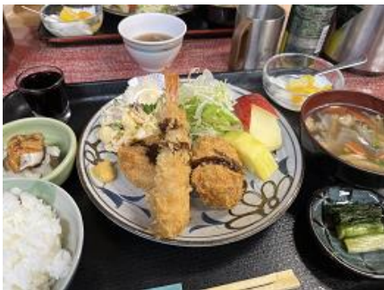
山小屋とは思えない食事