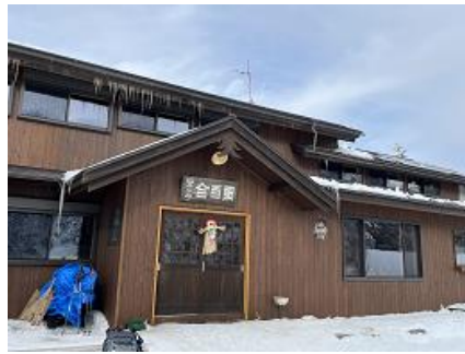
黒百合ヒュッテ到着