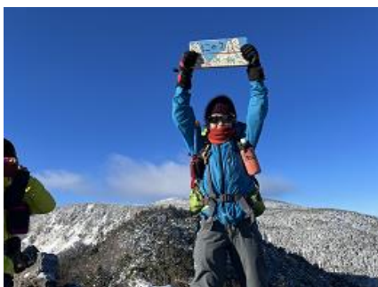
ニュウについたドー