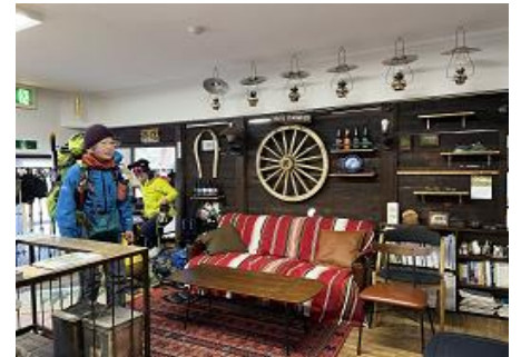
ステキな麦草ヒュッテ