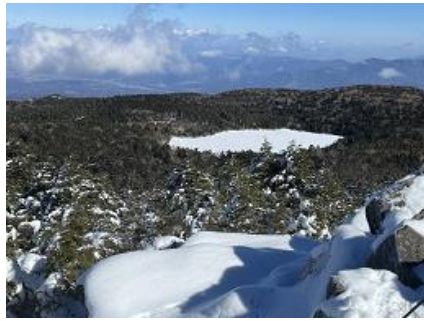
完全に凍ってる白駒池