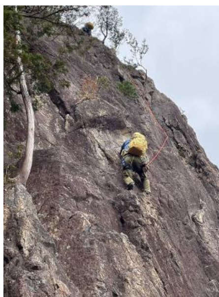
正面壁・・・頑張る人①