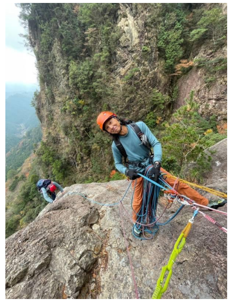
大テラスで笑う人