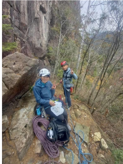
馬の背の下でピースの人と人