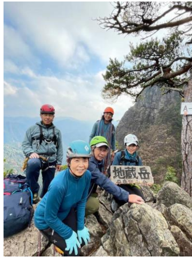
頂上で喜ぶ人たち！