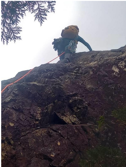
馬の背をいきます。