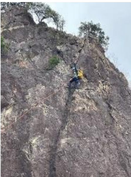
正面壁で手を振る人