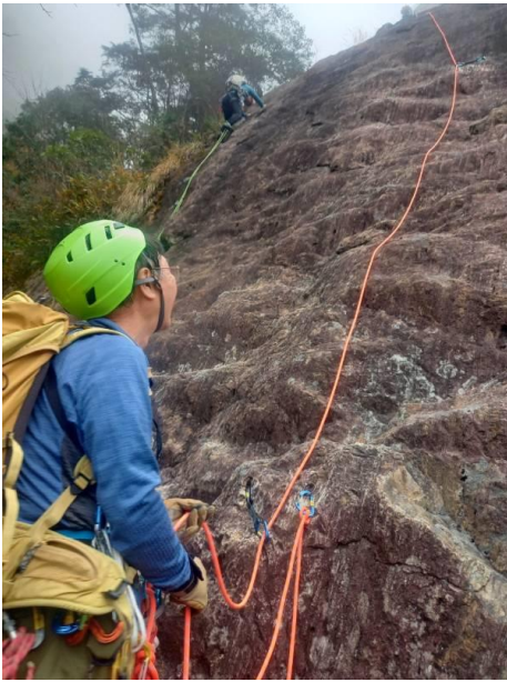
ビレーするおじさん