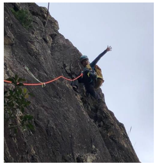
ここは正面壁。 快適にロープが伸びていきます。