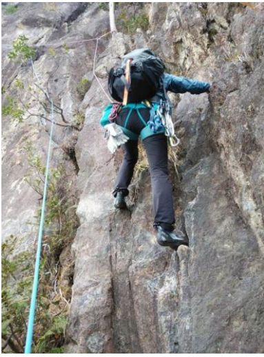
正面壁・・・頑張る人②