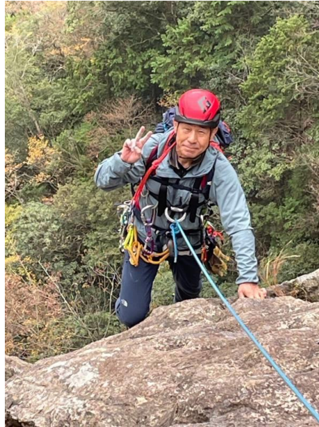
ピースするおじさん