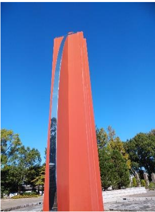
荒牧バラ公園の震災慰霊碑です。