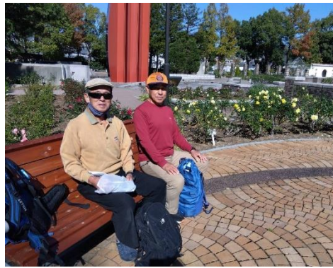
食事する・・・おじさんとおじさん。