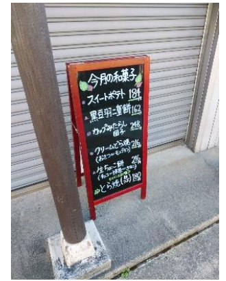
二軒目の和菓子店は休店でした。