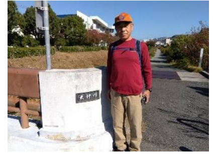
鯉も住む天神川は水が少なくなっていました。今年の少雨の影響でしょうね。反対側の天王寺川は流れてましたけど。