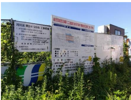
洪水を起こした天神川の工事はもう少しかかりそうです。