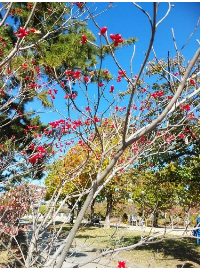
ハナミズキの実が赤く鈴なり。