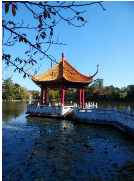
中国佛山市より贈られた「賞月亭」 緑ヶ丘公園