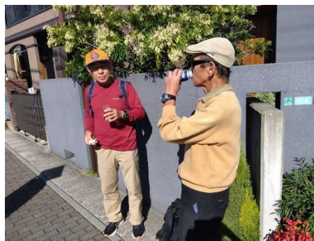
終点・・・一息つくおじさんとおじさん。