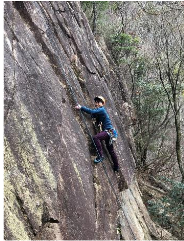
⑧ 奮闘!! 手が冷たい