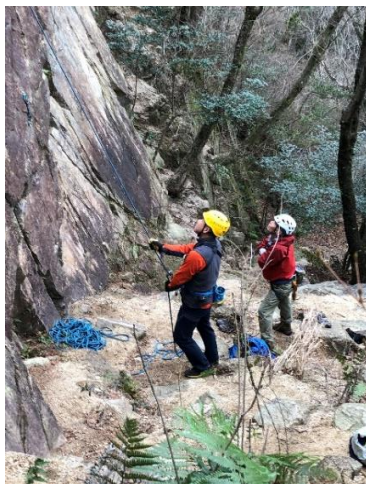
⑪ 真剣なビレーヤー