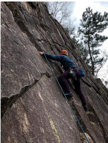
⑩ 手 足が疲れて震えます