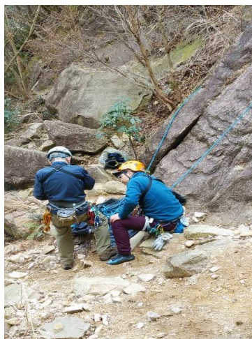
⑤8の字確認 基本の基本 大事です