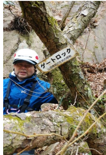
③ゲートロック看板とおじさん