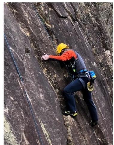
⑫ 手探り 慎重に行動