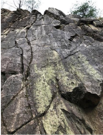
⑦ オーバーハングもあり