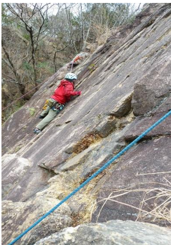
④奮闘中のおじさん