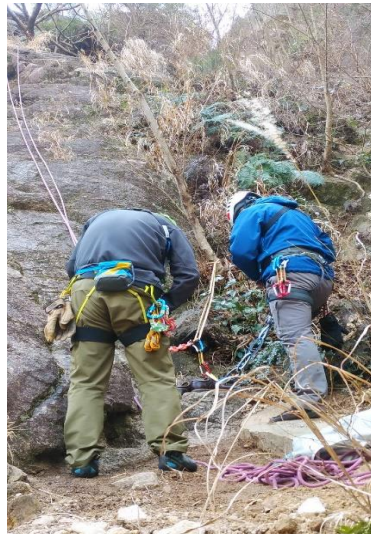
②確認作業 基本は丁寧にすべし