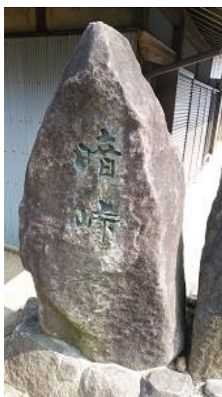
ここが暗峠である。