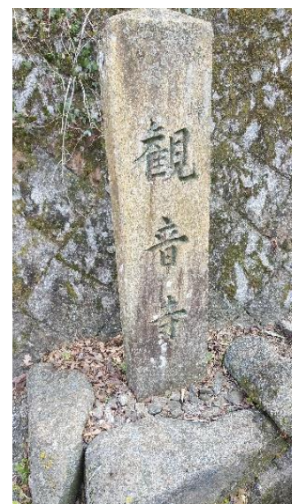
お寺がたくさんあります。