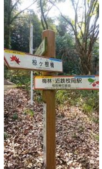
ハイキングコース多し