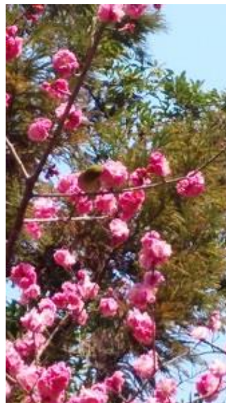
梅にメジロである。