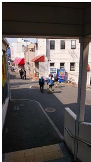
枚岡駅で水分確保