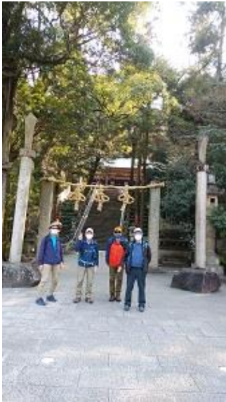
枚岡神社到着。珍しいしめ縄