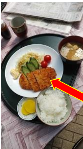
すえひろさんのとんかつ定食