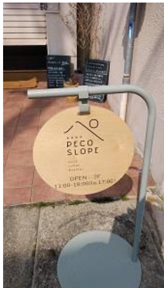
駅前にはかわゆいお店が。