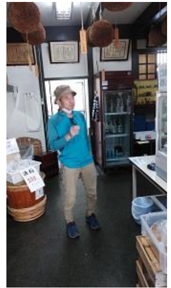
更に・・・飲む人