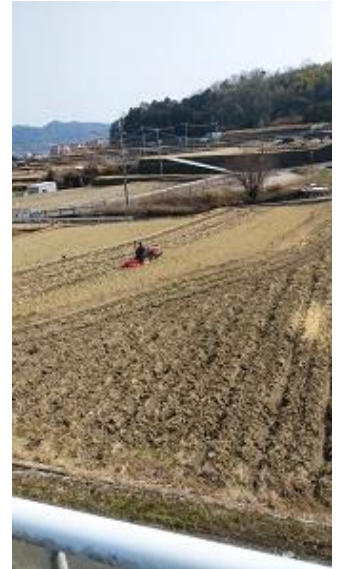
かな風景が広がります。