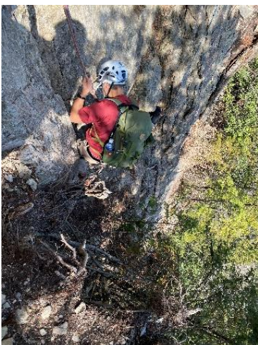
7. 危険ルート その1