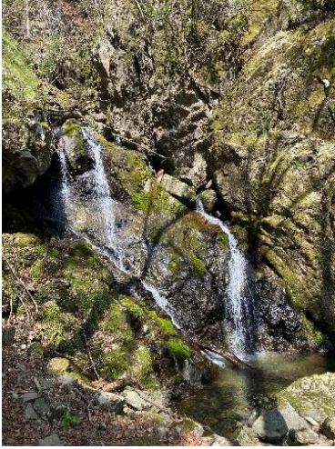
13. 途中の滝 その1