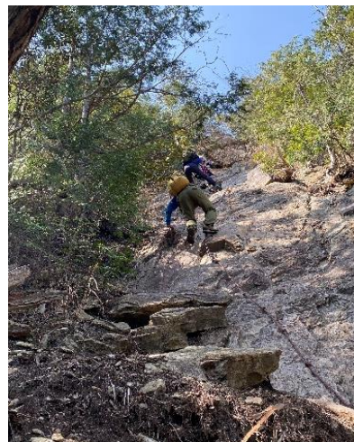
8. 危険ルート その2