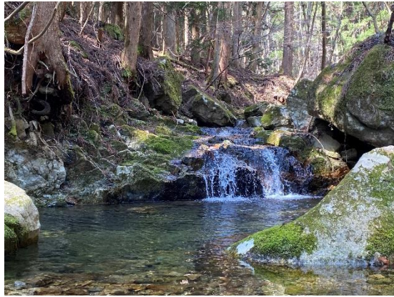
14. 途中の滝 その2