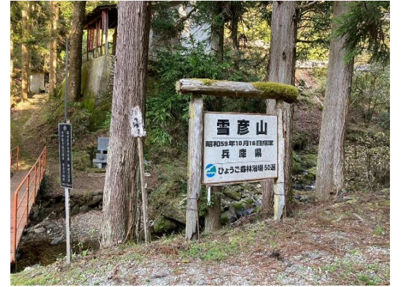
15. 結構時間が掛かってしまったが、 全員無事下山しました