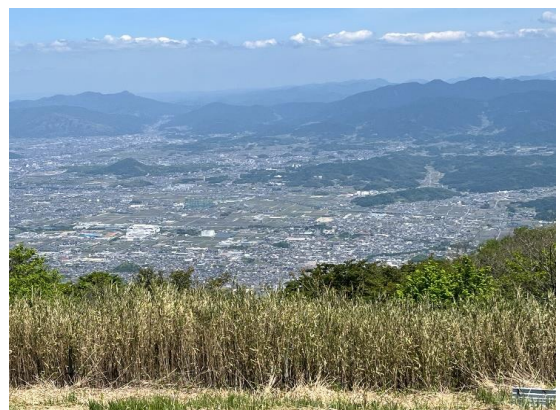
大和三山(天香久山、畝傍山、耳成山)