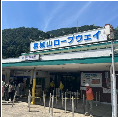
葛城山ロープウェイ駅

一目百万本のつつじを求め「葛城山」を計画。平日なのに沢山の人ですが、ロープウェイにもスムーズに乗れているようです。また、意外と歩いて登る人が多い。つつじは満開(少し遅かったかも)、迫力あります。(櫛羅の滝、見過ごしました、次回は・・・)