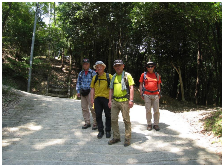
西坂ルート(急勾配のCo舗装道)