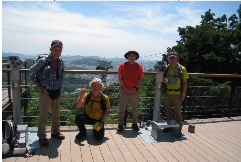
ロープウェイ山上駅天望スポット