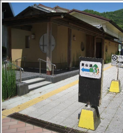
ロープウェイ登山口の看板