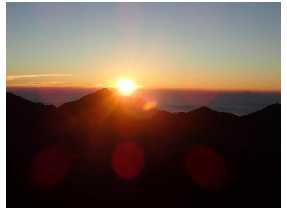
涸沢組のサンライズ