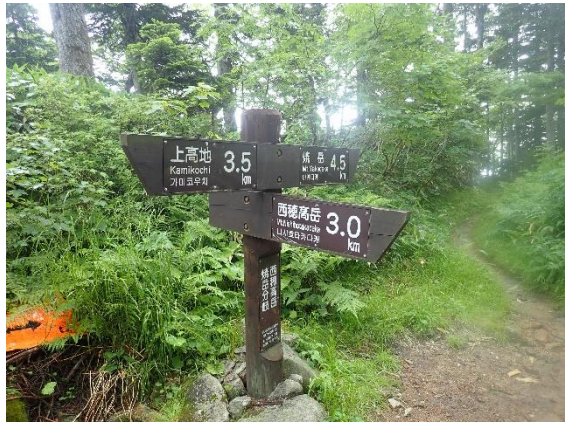
焼岳との分岐。ここを越えてから雨、そして雷。 近くに落ちました。ビビった！