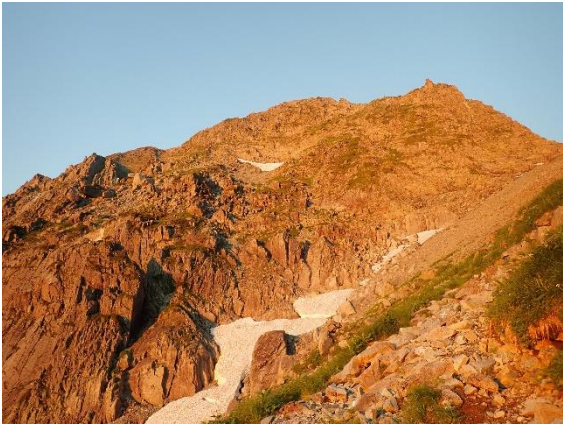
涸沢組のモルゲンルート