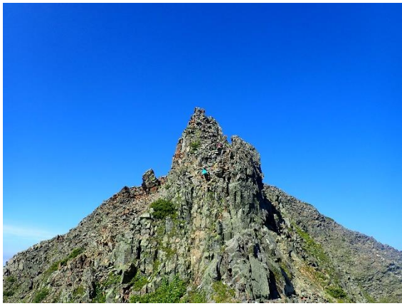
西穂から逆層スラグまでのどこか