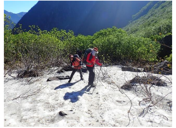
涸沢から下にも雪溪あり