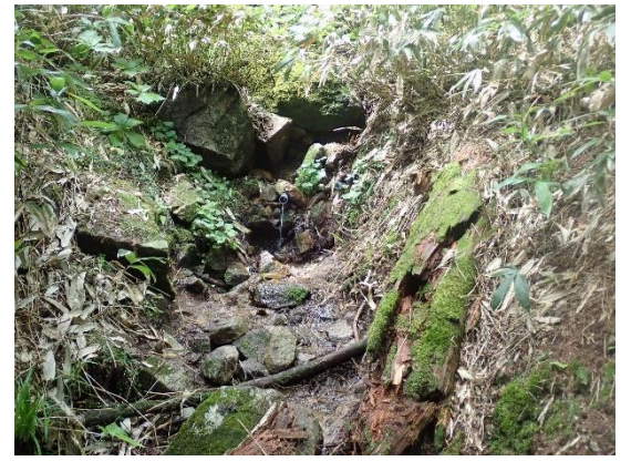
ここが「宝水」メッチャうまい！ 必ず寄るべし！