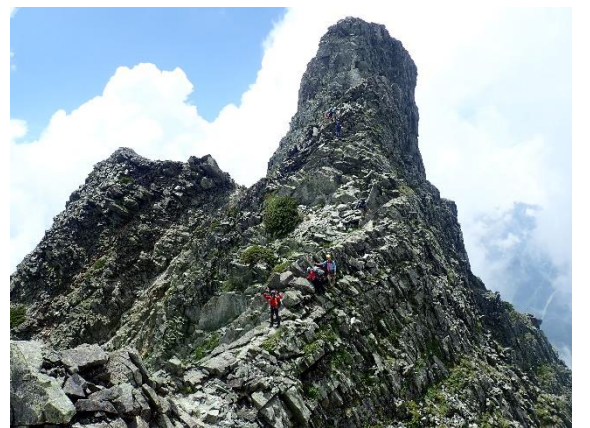
やっぱりジャンはこっちからがカッコイイ