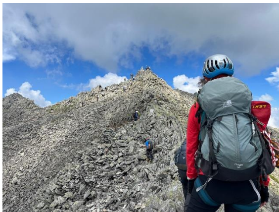
奥穂までもう少し