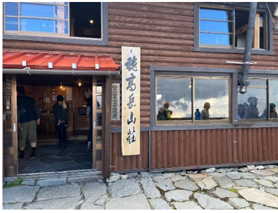
みんなよく頑張った！本当に頑張った！ 全員無事でよかった！ 穂高岳山荘に無事到着