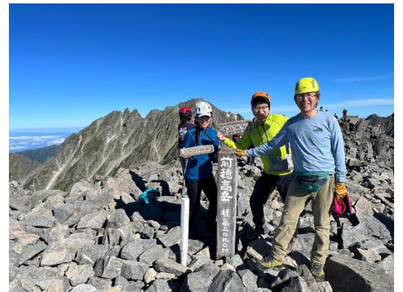
吊り尾根を通過し、前穂ゲット！