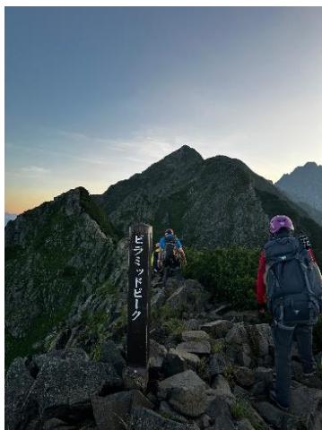
ピラミッドピーク通過