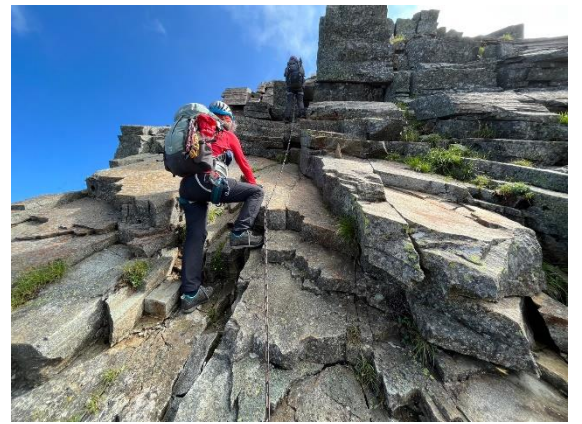
逆相スラグその2 濡れてたらやばいポイントですね