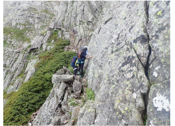
こんなところも通り