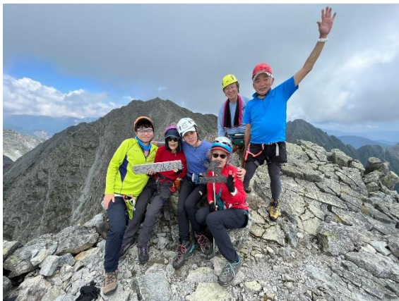
ようやく目的地！！ まだ危険部があるので気を抜かないように！