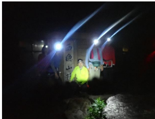
不安と期待いっぱいの中、出発！