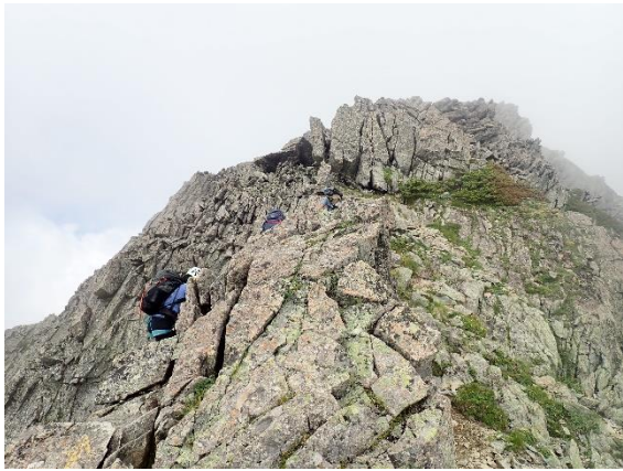
こんなところを上がると