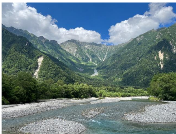
全員無事上高地へ下山。 何度も言いたい。本当によく頑張った。 全員無事でよかった！