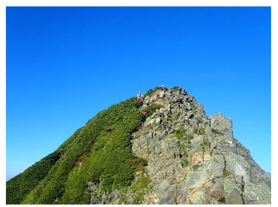
西穂から逆層スラグまでのどこか