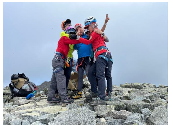
程なく、歓喜の瞬間