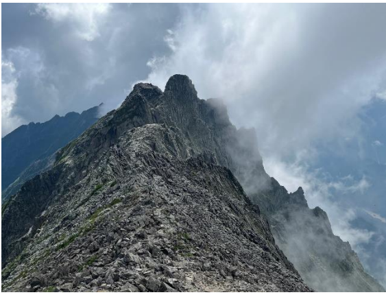
奥穂からのジャン