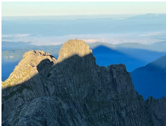
奥穂からのジャン 影奥穂か？