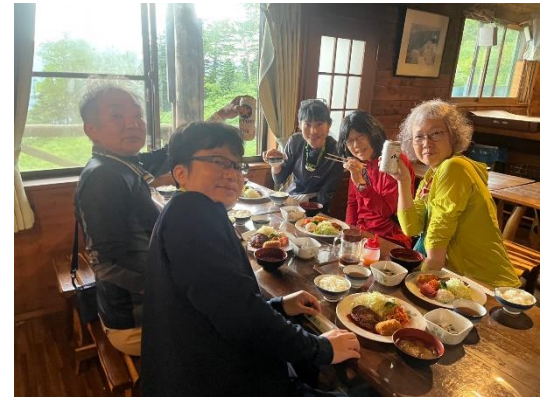
明日の山行の成功を祈念し カンパイ！！！！