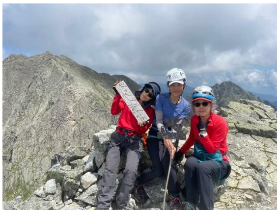
あなたたちも気を抜かないように！