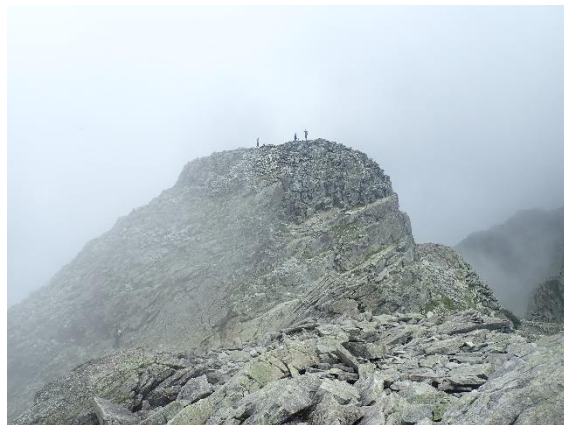
憧れのジャン出現 こっちから見るとなんか違うやん！