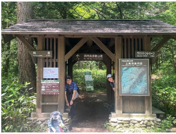
さーて、西穂山荘まで出発！