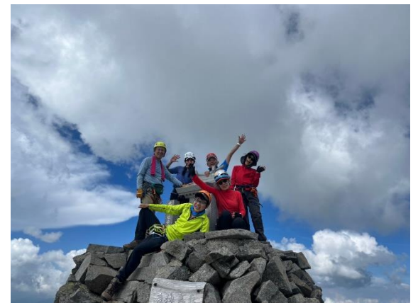
ってことで、最終ピークの奥穂到着 よくここまで来たもんや！