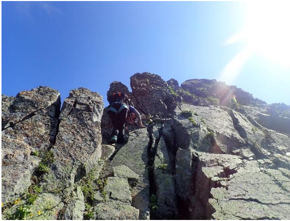
こんなところを通り