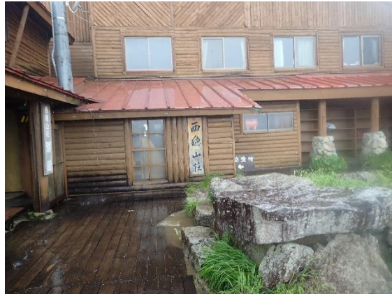
雨と雷の中、西穂山荘に到着