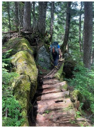
西穂山荘までの登り。まだ楽勝だが暑い。