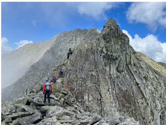
まじで！これ登るん？ 写真ではわかりにくいけどナイフエッジです。