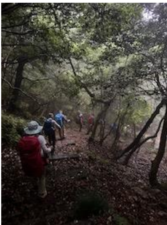
13、丸太も木の根も濡れて滑りやすいので慎重に下る