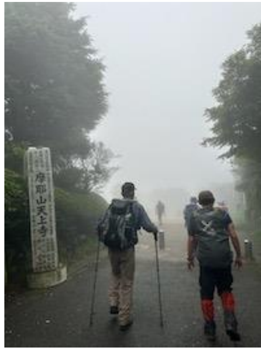
8、掬星台は霧に包まれる