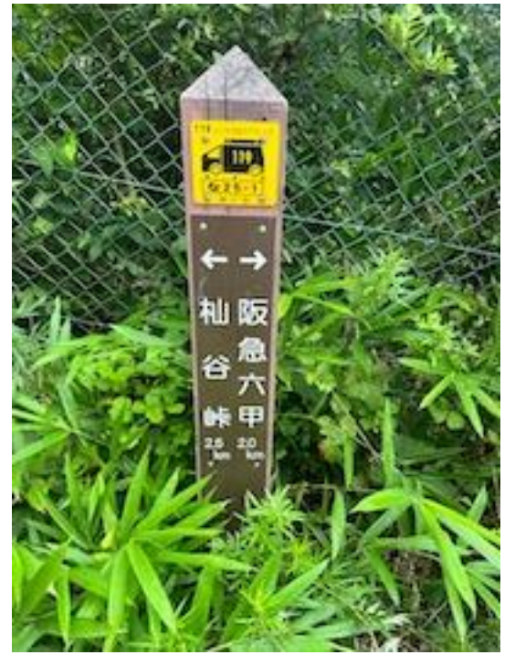
18、ここより車道歩き