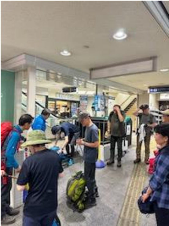
19、六甲駅到着、解散。お疲れ様でした。