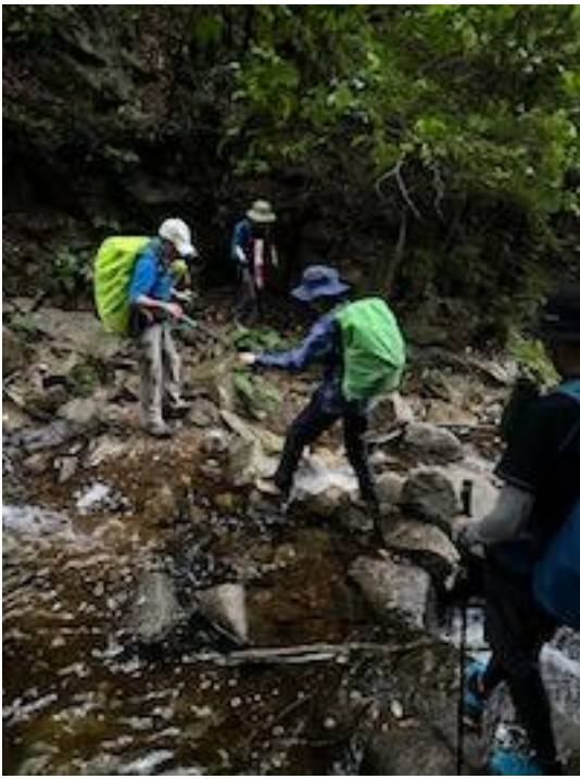
16、慣れないと怖いです