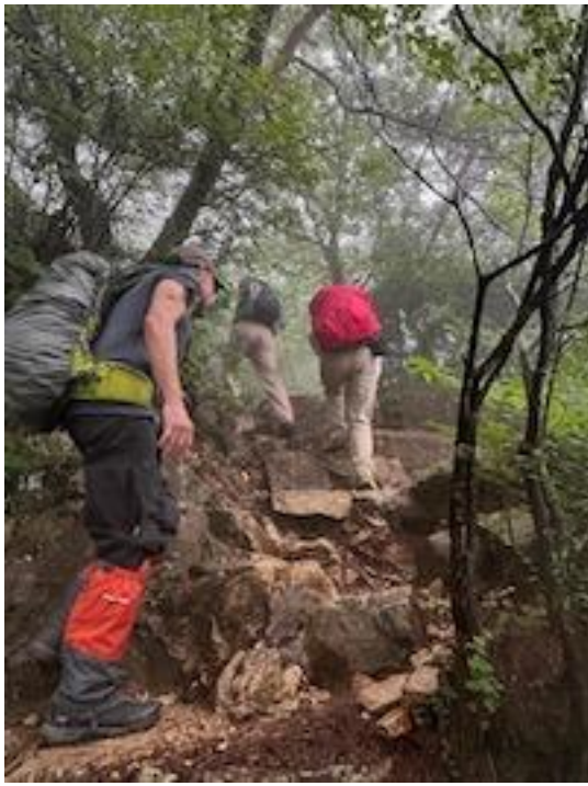
7、天狗道、キツくなってきた