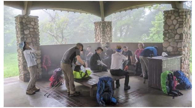
9、昼食、休憩。風が通り汗が冷えます