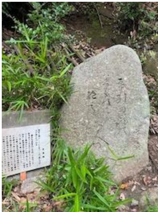
2、こんな歌碑が36ヶ所