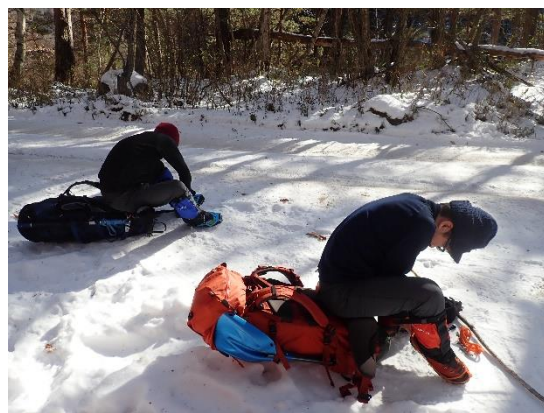
2. 程なくチェーンアイゼン装着 優れモノです。