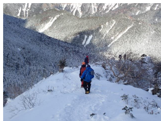
18. 行者小屋までの下り 岩場を撮るのを忘れました。