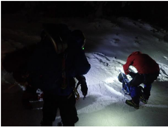
7. 準備をして赤岳へ