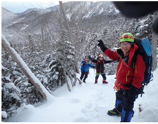
8. まだ序の口で余裕