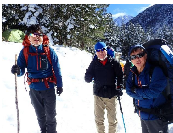
20. あとは八ヶ岳山荘への長い下り 最高の山行でした！