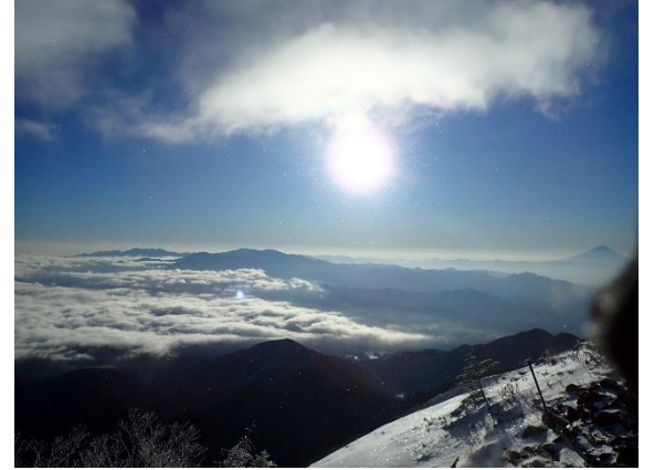
12. ようやく稜線に出た。素晴らしい！ 右側の富士山わかります？