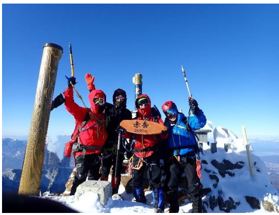
14. 赤岳登頂！ リベンジ成功！