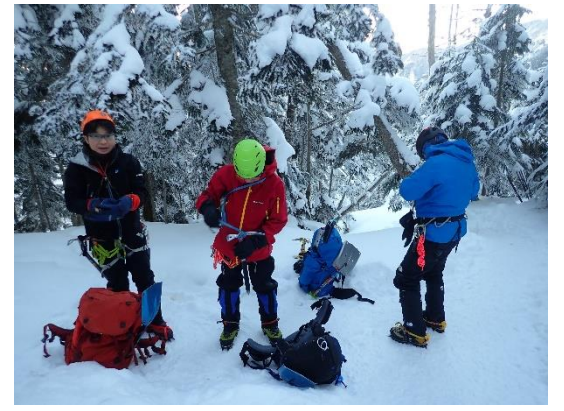
9. ここから急登が待ってました。 今はまだ余裕