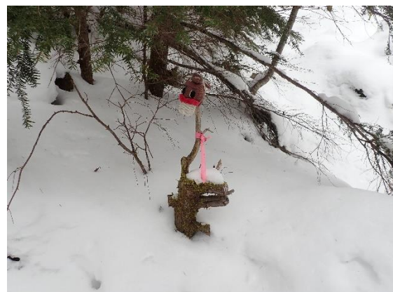
5. What's this?