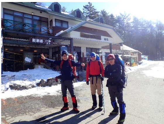
1. さあ赤岳鉱泉に向け出発！

下りの岩場を慎重に降り、順調に山行を終えました。天気に恵まれ、最高の山行でした。