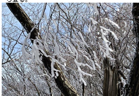
山頂手前の強風の吹く尾根で樹氷発見！ヤマレコの記録では、昼過ぎには消えていたと。ラッキーでした。