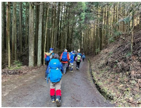
いよいよゴール間近です。

本日の山行記録 累積アップダウン 約 700m、総行程 9.2km 傾斜が登りで 30 度程度が頻発しましたので体力は B グレード相当でした。 (傾斜は gps データを用いてカシミールで算出することができます)