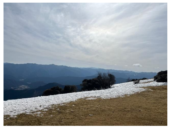
八丁平の雄大な景色も good