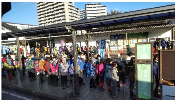
榛原駅から霧氷バスに乗車、それにしてもすごい人、観光地と見間違うほど！

霧氷観光のメッカ三峰山、最近の天気は暖かさが続きやや心配に。前日に雪が降り強風が吹いたようで何とかエビの尻尾を見ることができました。今回のルートは不動の滝から急登にとりつき避難小屋までが核心となりました。積雪は多くなかったものの山道には根雪が凍結し慎重な登攀となりました。頂上付近までは樹氷らしきものは見当たりませんでした。三畝峠から数十mの範囲で樹氷を確認できました。下りは南斜面が多く、早春の霏圀気の気持ちの良い下山となりました。