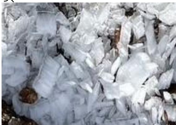
三畝峠を越えると樹氷の残骸が道筋に散乱。今日はこれくらいかとやや落胆しかかったが...