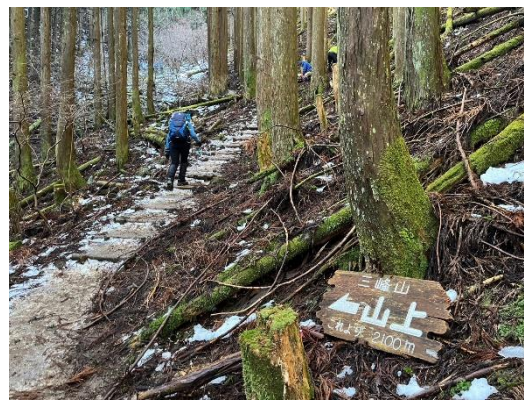
雪は多くないもののアイゼンを装着してひたすら登る。