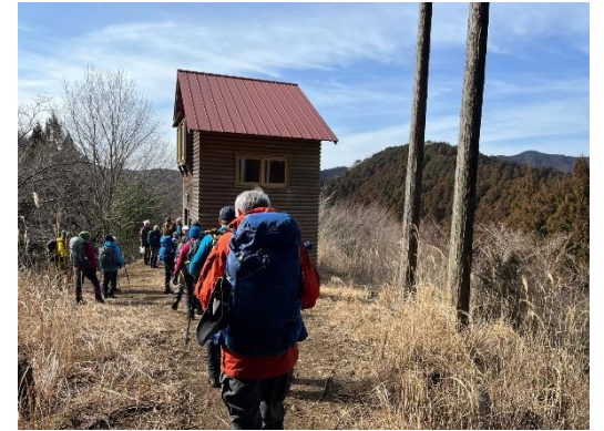
三畝山林展望台に到着