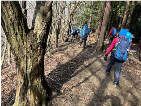
下山道は雪もなくどんどん下りてゆきます