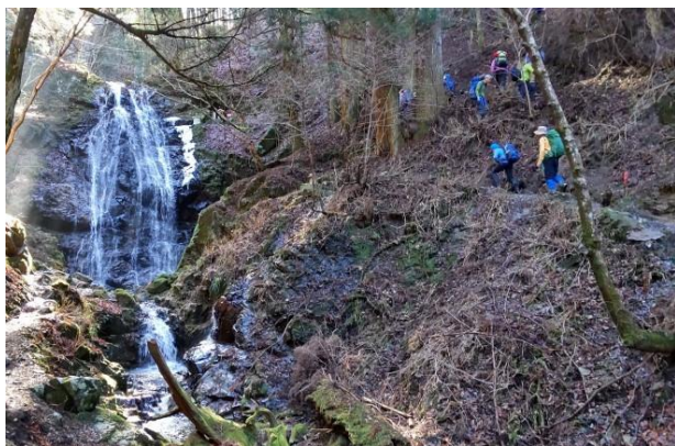
不動滝を見ながら本日の核心部の急登にとりつく