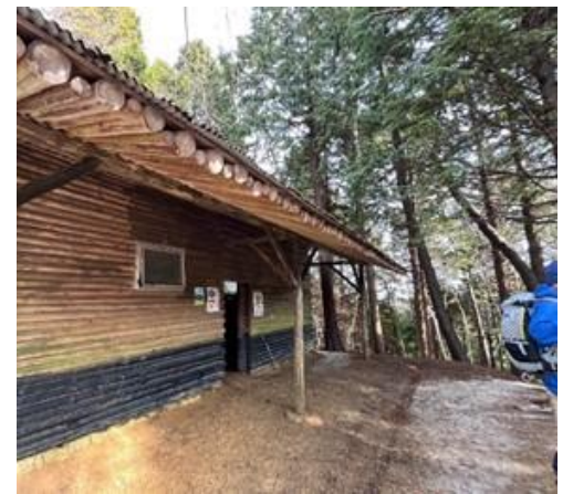
ようやく避難小屋に到着、まだ樹氷の霏圀気は感じられない