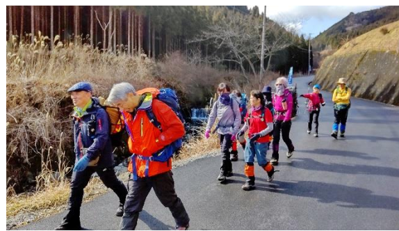
みつえ青少年旅行村から出発、あまりの天気よさに頂上での霧氷はやや心配