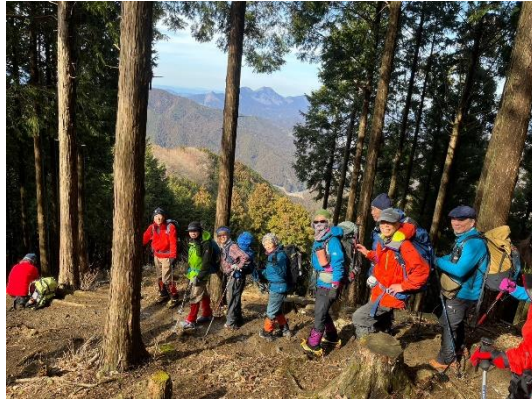
冬山に来たのだろうかという暖かさ。春到来の暖かさにまったりします。