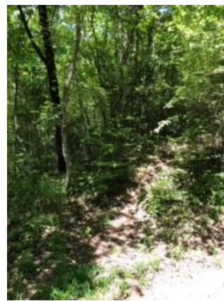
⑧ダム方向に出た道