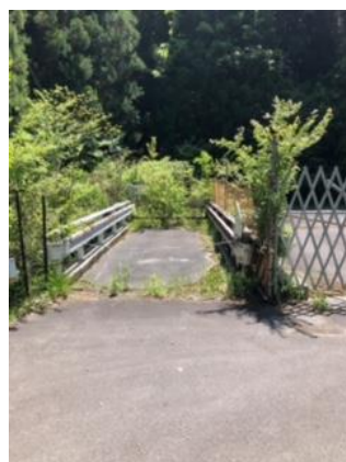
⑨立入禁止、橋の手前