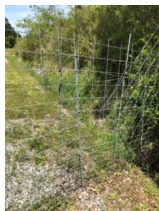
⑪宝塚北ICへの道 動物除け