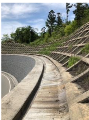
⑬ コンクリート壁の脇を下る