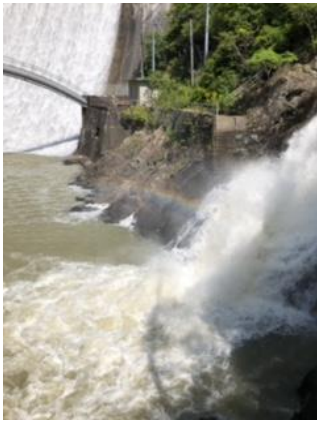
①前夜の雨で千刈ダムの水量多い。虹が見える。

今季の目的は 前回、川下川ダムより武庫川左岸に下り武田尾に出るルートが一部崩壊し危険な為、ダム上部より宝塚水道局管理下の道から登山道に入り宝塚北IC経由で武田尾への道を探索する。 大岩岳 丸山湿原 川下川ダムは順調に来たが水道局内の道が閉鎖されており川下川上流の希望の家施設を過ぎ橋を越えてから宝塚北ICに戻る道を探し南下する。人が歩いた後は少ない道。 北ICまでたどり着くがIC SA造成の為、あと30メートル手前から道がなくなりコンクリート造成地を無理やり下りICに出た。県道327号に出るまで高速出入の道路になり歩くのは危ない。大岩神社経由で武田尾駅に到着。結果、川下川ダム方向から武田尾に出るのは無理がある。再度武庫川ルートを調査するか武田尾経由のルート変更が必要。