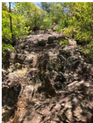
⑥川下ダムへ下る岩場