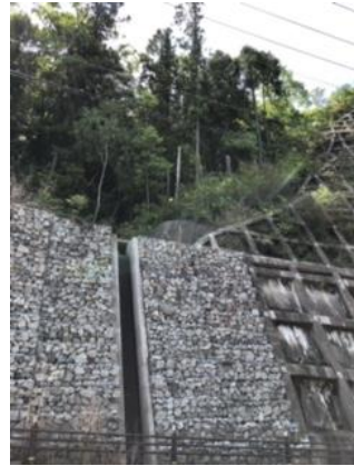
⑭ 他の登山道も遮断される