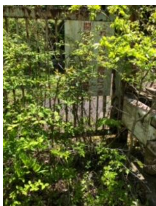
⑩宝塚水道局の立入禁止門