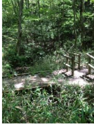
②大岩岳を過ぎ丸山湿原