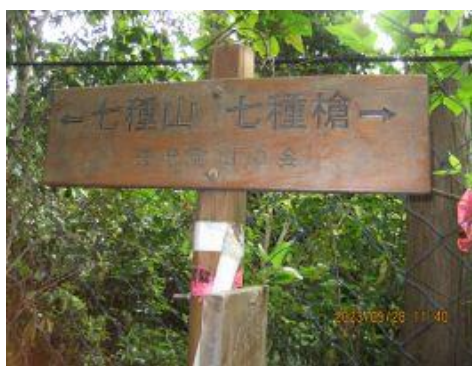
17 このまま尾根伝いに行かずに、小滝林道へ降りていくことに。 コース変更。