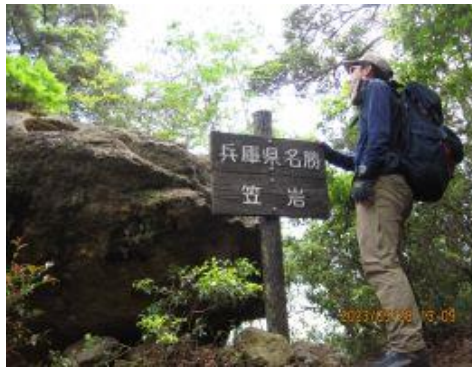
23 七種山から来たらこの標識を先に見ることになる。