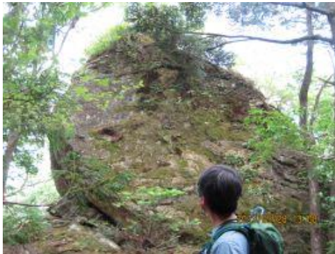
22 面白い形をした「笠岩」。岩の上から木が茂っている。