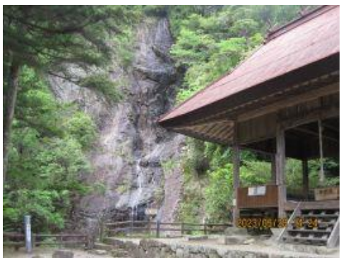
28 名勝七種の滝・七種神社到着 県下八景・県観光百選・近畿観光百景に選ばれている雄滝 落差 72m 幅 3 cm。