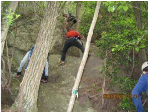
13 岩稜歩きトレーニングに最適