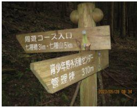
2 七種山への登山口