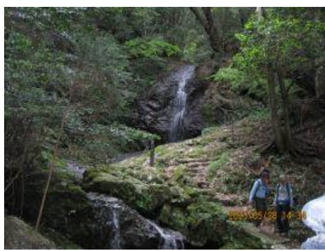
29 数日雨も降らず、水の量は少ない。