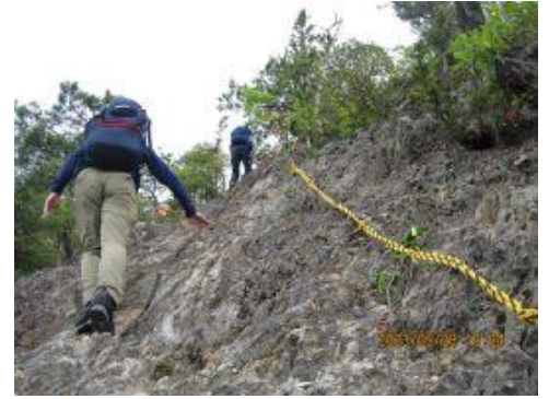
9 アップダウンが続く。