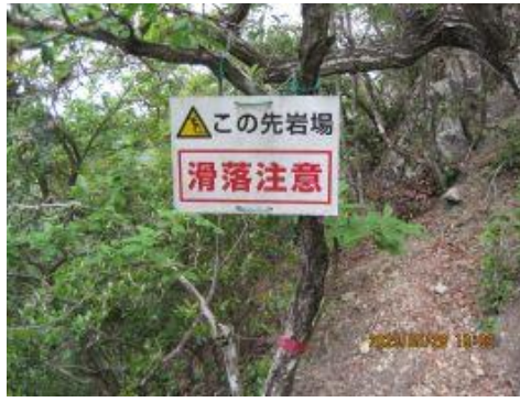
8 岩場が続いて行く。