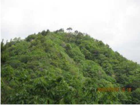
10 遠くに七種檜が見える。