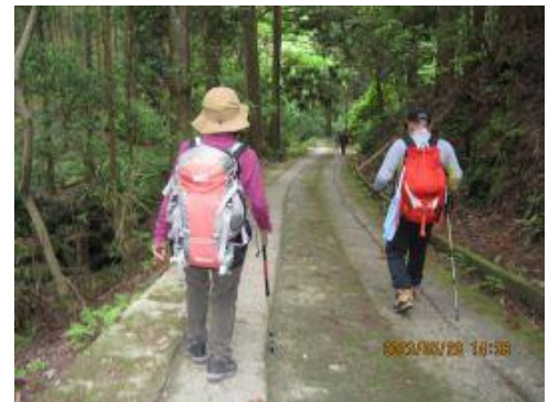
30 旧山門を過ぎ駐車場へ向かう。