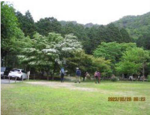
1 駐車場からなぐさの森公園を通り抜けて登山口へ(トイレもあり)

今回は2台のマイカー山行となった。蒸し暑い一日になりそうである。今季まだ暑さに慣れない山行だが水分も今までよりは多めに持参。登山口からいきなりの急登が続きかなりの汗をかきながら尾根に出た。ここから七種槍迄は尾根幅も狭い岩場が続いて行く。アップダウンの繰り返しが続き岩も切り立っている。岩稜歩きのトレーニングには最適。七種槍から七種山迄は前回の尾根コースを変更。小滝林道経由で行くことになった。一度下り(結構な下り)分岐から七種山へとまた急登を登り返す。七種山登頂後はひたすら下り七種神社、七種の滝終点に到着。滝の水の流れは数日雨も降らず少量であった。