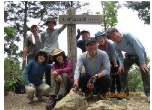
24 七種山登頂 13:18