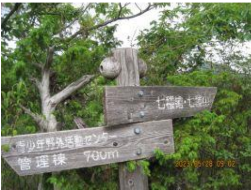
4 約30分登り詰め 尾根へ出た。