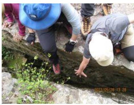
26 弘法大師がこの岩の上で護摩の秘法を修練したと言い伝えがある。高さ 15 m、幅 5m で岩の削離が途中で止まり底部で岩盤に繋がっている。