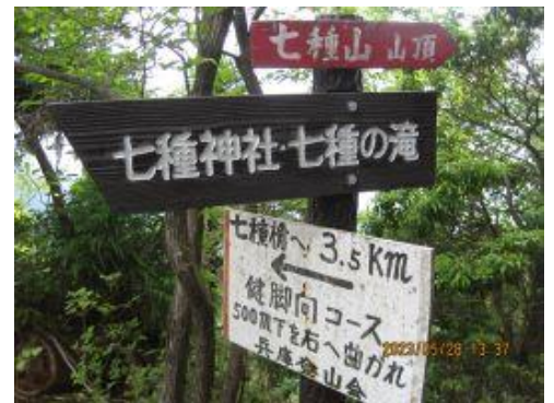
27 終点を目指してひと踏ん張りだ。