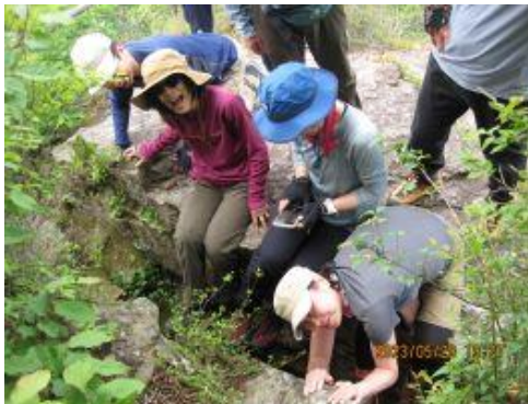
25 頂上からピストン。 「つなぎ岩」奇岩！ 女子は高い所平気。若干 1 名の男子の「危ない！やめろ！」注意もスルー！