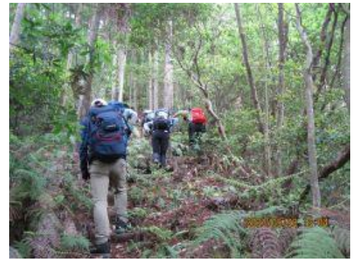
21 やはり登って行く。途中休憩と昼食を済ませた。