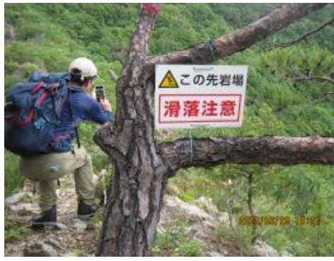
11 尾根幅が狭くなり