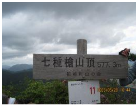
14 七種檜登頂 10:44