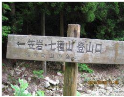
20 一気に七種山への分岐