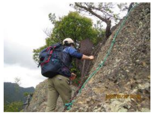
6 鎖、ロープはつかわなくても登り易いが、気を引き締めて。