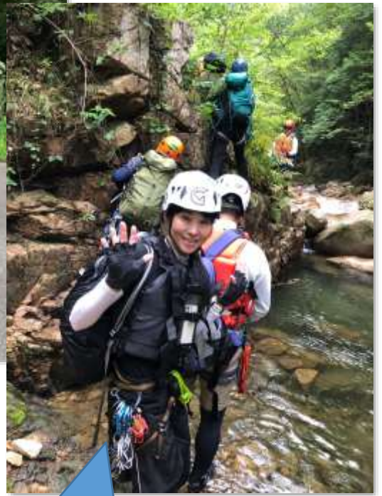
さあ、初めての沢登り