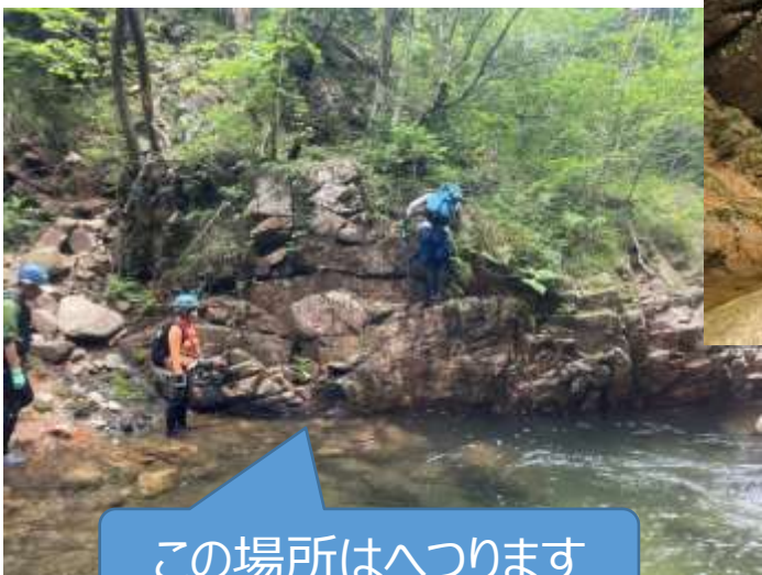
この場所はへつります