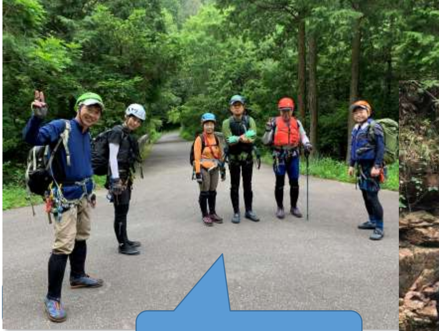
入渓準備整いました

9:00 からとの湯集合 ~ 9:48 東山橋 逢山峡入渓 ~ 11:17 ゴルジュ ~ 12:40 昼食 ~ 13:48 脱渓 ~ 14:30 からとの湯 入浴・解散