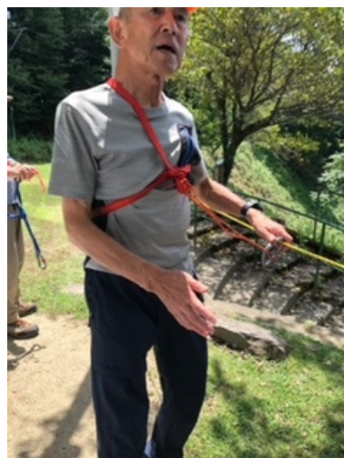
ワンポイントレッスン②(セルフビレー)