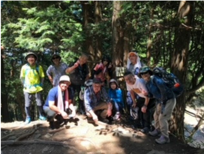
大比叡山頂にて (参加者全員)