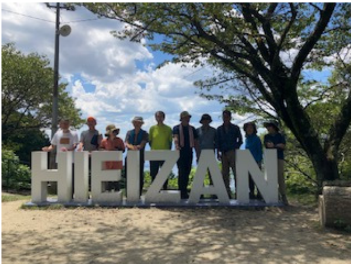
ケーブル叡山駅 (参加者全員)