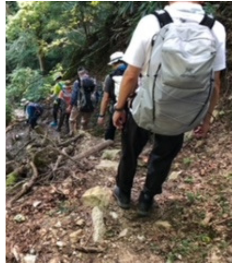
元気です (暑さ対策バッチリ)