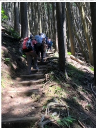
CL先頭にゆっくり進む

酷暑の中、全員無事完走。暑さ対策もバッチリの「京都の歴史を踏みしめて登る比叡山」。