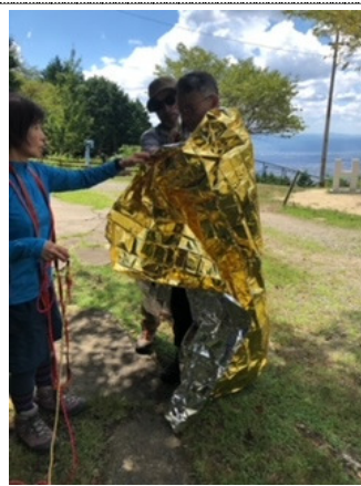
ワンポイントレッスン①(ピンチシート)