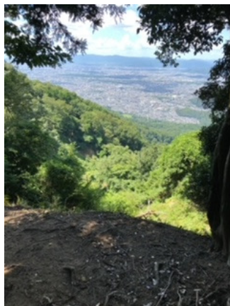
途中の展望箇所(風が爽やか)