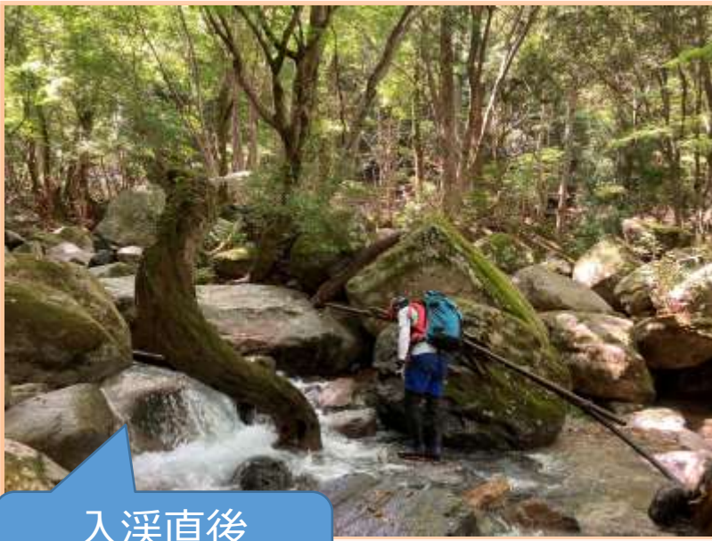
入溪直後 明るい沢です

JR宝塚駅 7:00 集合 ~ マイカーにて葛川市民センター駐車場へ移動 ~ 9:00 坊村出発 ~ 9:52 牛コバ入溪 ~ 12:46 すべり石 ~ 14:40 夫婦滝脱溪 ~ 16:06 牛コバ ~ 16:50 坊村