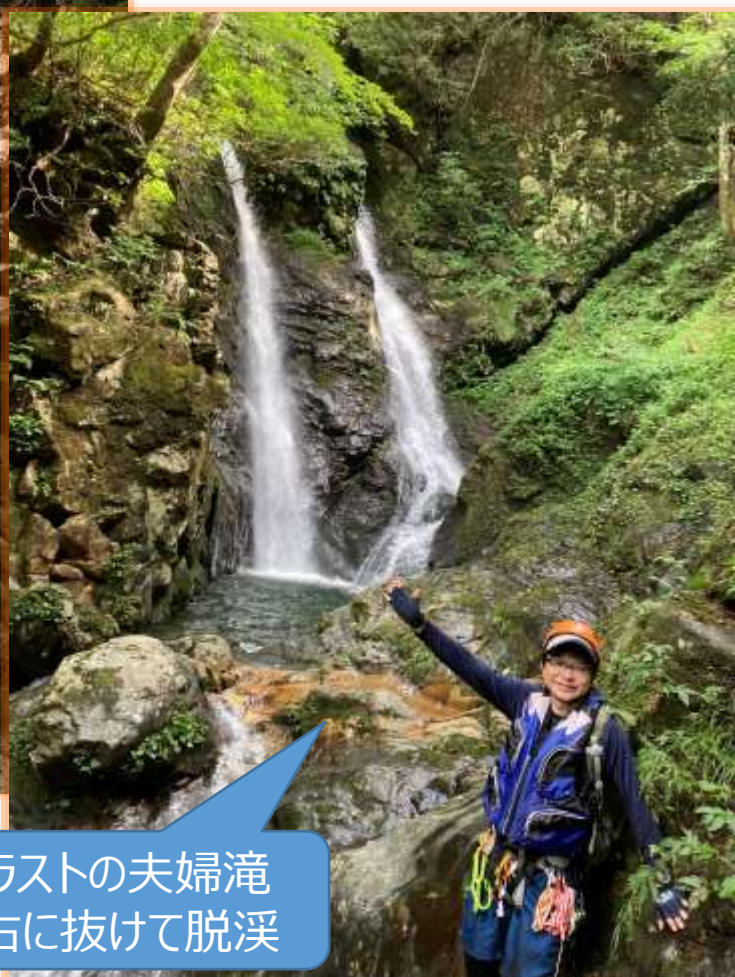
ラストの夫婦滝 右に抜けて脱渓