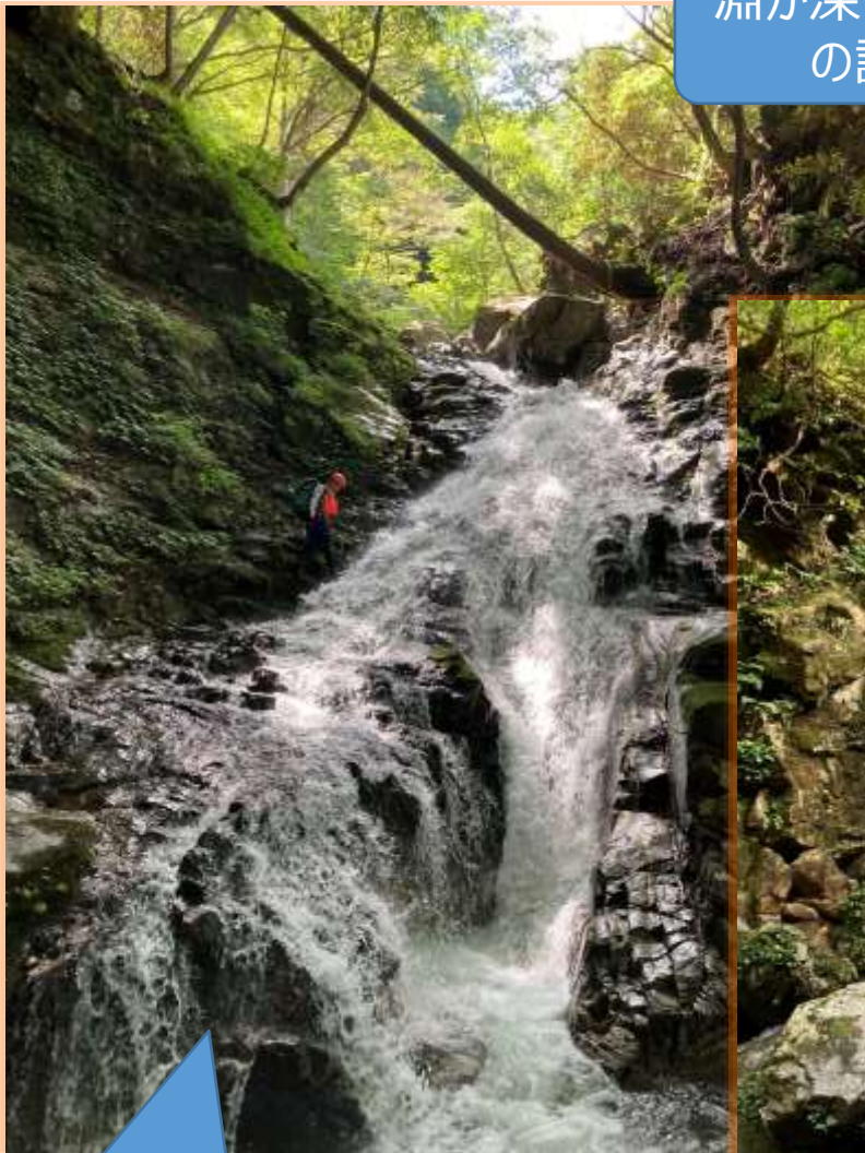
ここはロープを出してもらいました