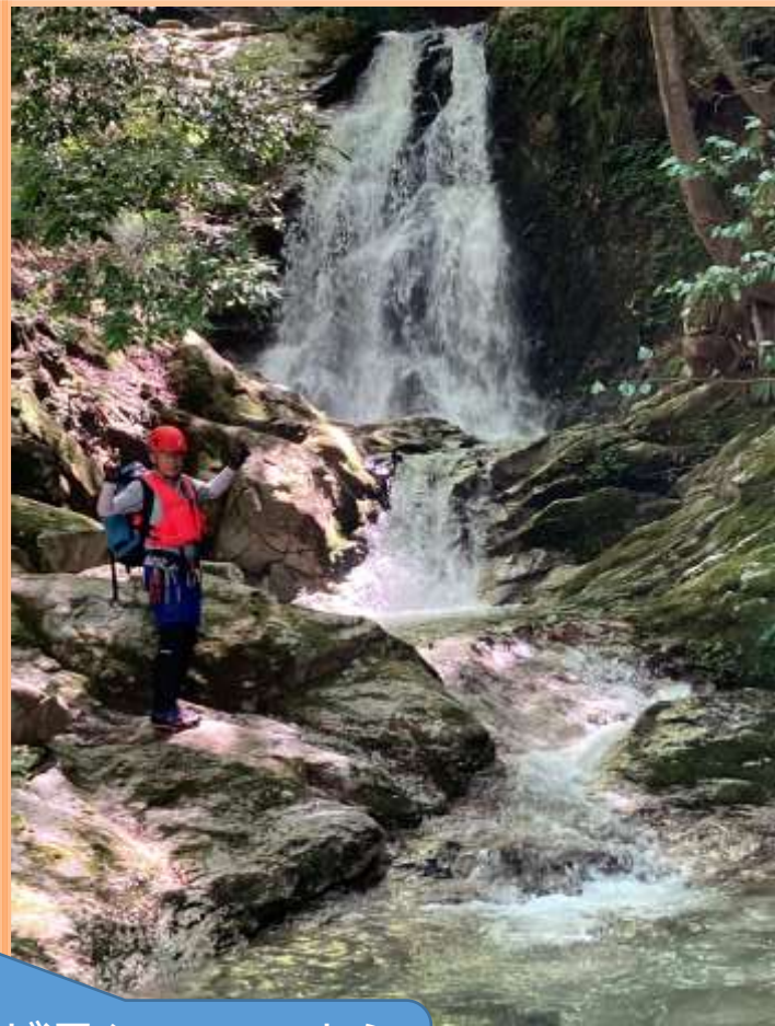
淵が深く、へつってからの記念写真