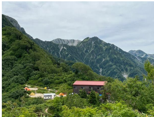
👉 丸山より早月小屋を望む。