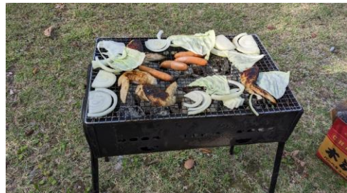
馬場島キャンプ場到着後、早々にBBQの準備。ここでもBBQのプロが本領を發揮！