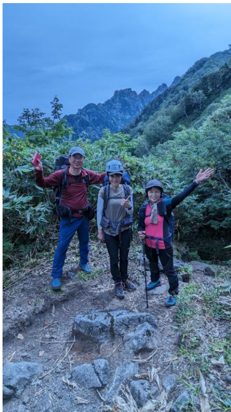
日本三大急登の早月尾根を黙々と上ります。