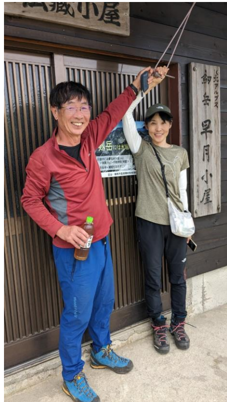
早月小屋に設置された幸せの鐘？二人仲良く、お幸せに！！！！