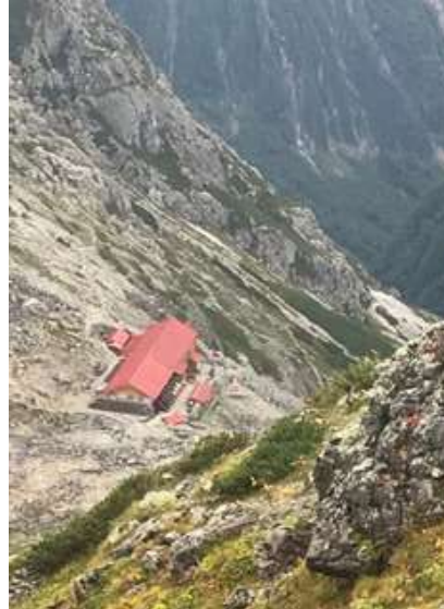
本日の宿泊地（殺生ヒュッテ）