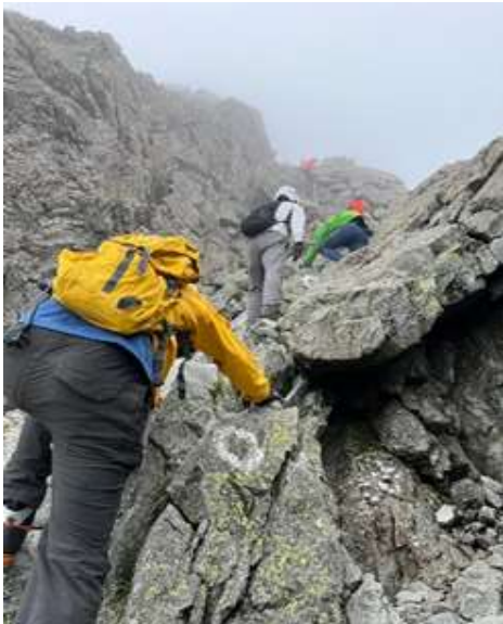
1. 穂先を目指すメンバー

9月15日、早朝、西宮を出発。新穂高温泉から槍平泊、 16日 槍ヶ岳山頂、殺生ヒュッテ泊、17日 横尾山荘 泊での3泊4日の山行 〈場所〉長野県・岐阜県の県境 〈エリア〉北アルプス 〈山行形態〉集中山行 〈月日〉2023年9月15日~18日 〈コメント〉山登りを始めてからの目標であった槍ヶ岳 の登頂に成功できました。