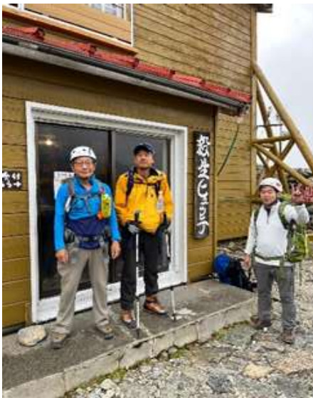
殺生ヒュッテ出発