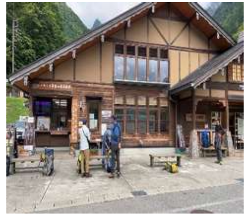
集合場所到着（横尾山荘）