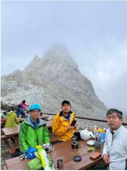
登頂成功後のティータイム