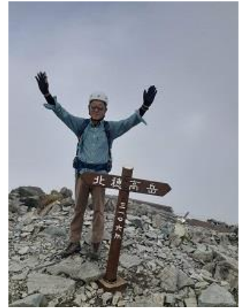
12. 北穂高岳山頂 ガスで展望なし(9/16)