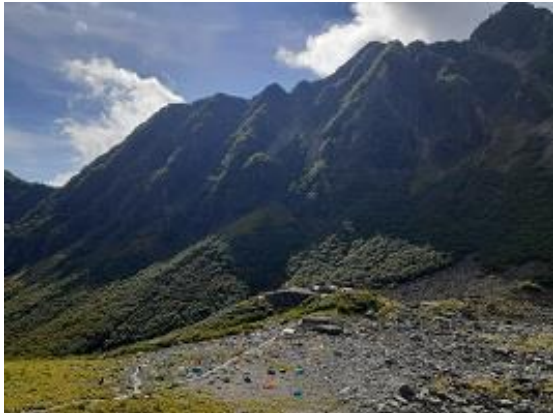
7. 眼下に涸沢ヒュッテとテント場(9/16)