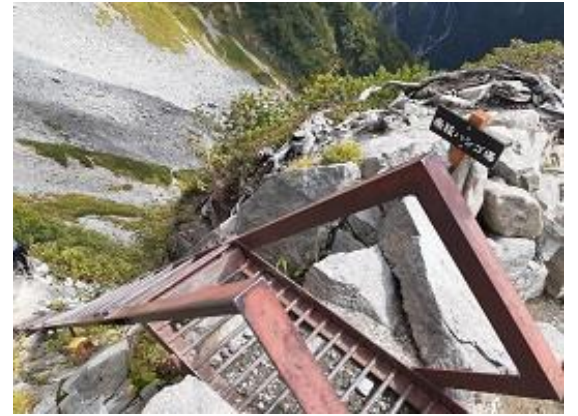
9. 南陵 鉄はしご(9/16)