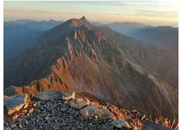
15. 北穂高小屋前テラスからの槍ヶ岳(9/17)