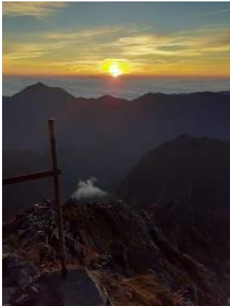
13. 北穂高小屋前のテラスで御来光見る(9/17)