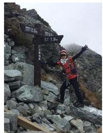
18. このまま下らずに、北穂高岳南峰に登る(9/17)