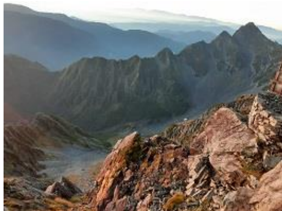
14. 北穂高小屋前テラスの景色(9/17)