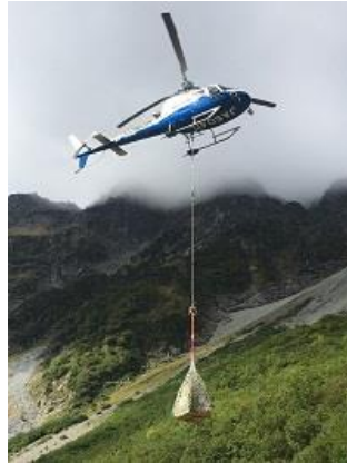
8. 荷を運ぶヘリコプター(9/16)