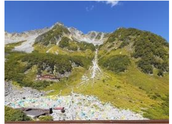
27. 涸沢カール 目の前が北穂高岳 北穂高小屋の赤い屋根が見える(9/17)