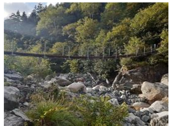
3. 本谷橋 吊り橋なのでかなり揺れる(9/16)