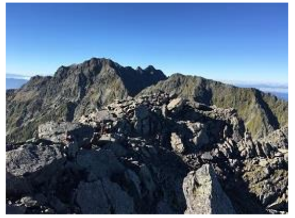
21. 奥穂高岳に向かって少し歩く 目前に涸沢岳、奥に奥穂高岳、その右がジャンダルム(9/17)