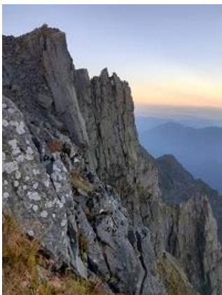
16. 北穂高小屋前テラスの西側(9/17)