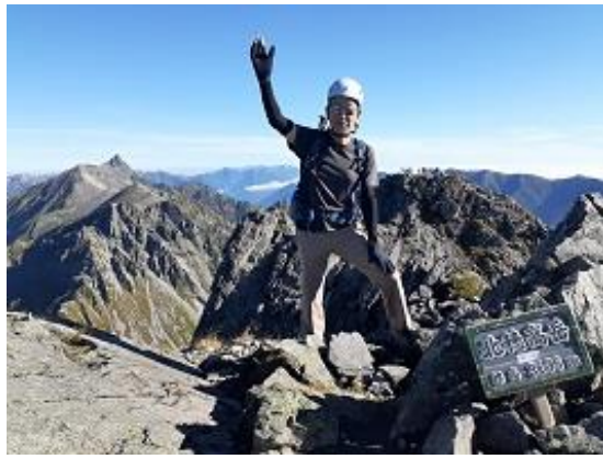
20. 北穂高岳南峰に到着(9/17)