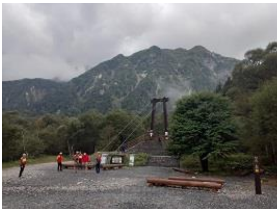
1. 出発、目の前の横尾大橋を渡る(9/16)

夜半過ぎに山小屋の屋根を叩きつけるような大雨が降ったので心配していたが早朝外に出ると眼下に雲海が広がる雲一つない快晴だった。山小屋のテラスの左手正面に槍ヶ岳と大キレット、テラスの正面からは常念岳、鹿島槍から白馬三山、右手正面には八ヶ岳、南アルプスの山々と富士山がくっきり見えた。昨日はガスの中で何も見えなかったがこんな素晴らしい景色があったとは！今日は15時までに横尾山荘に入れば良いのでテラスで絶景を見ながらゆったりした時間を過ごした。7時35分北穂高小屋を出発。北穂高岳南峰に登頂後涸沢に向かい慎重に下りる。10時30分涸沢ヒュッテに到着。ベンチに座り快晴の涸沢カールを眺める。右手に北穂高岳、小さく赤く北穂高小屋が見える。正面は奥穂高岳と涸沢岳、左手に前穂高岳が見えた。小一時間景色を楽しんだ後横尾に向けて出発。13時50分横尾山荘に無事到着。初めての穂高連峰であったが最終日は最高の天候に恵まれ楽しい山行であった。来年は奥穂高岳、前穂高岳の登頂を目指したい。