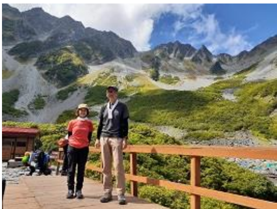
28. 後ろの山は奥穂高岳と涸沢岳(9/17)