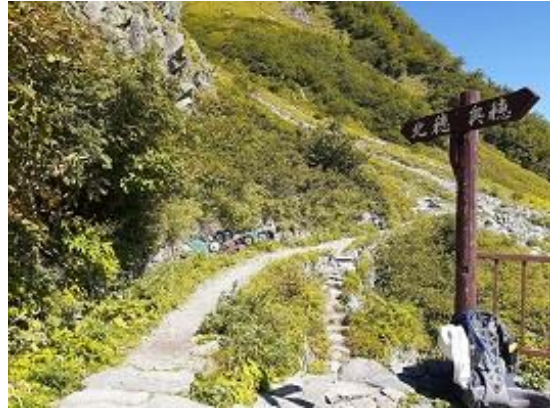
23. 涸沢に降りてきました 昨日はここから登りました(9/17)