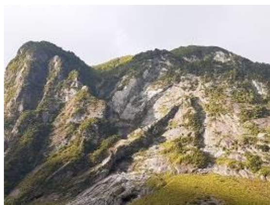
2. 屏風岩を見ながら歩く(9/16)