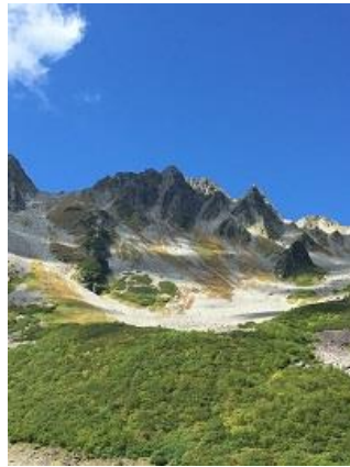
26. 奥穂高岳と涸沢岳(9/17)