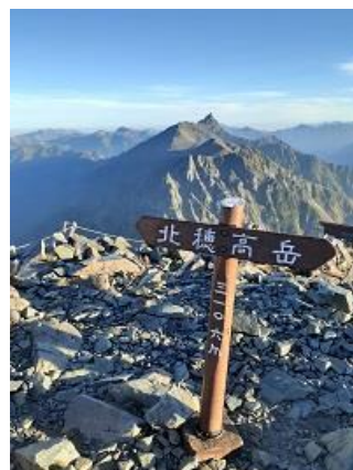
17. 北穂高岳山頂 バックに槍ヶ岳(9/17)