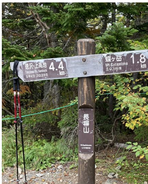
2. 徳沢までの4.4Kmが長かった