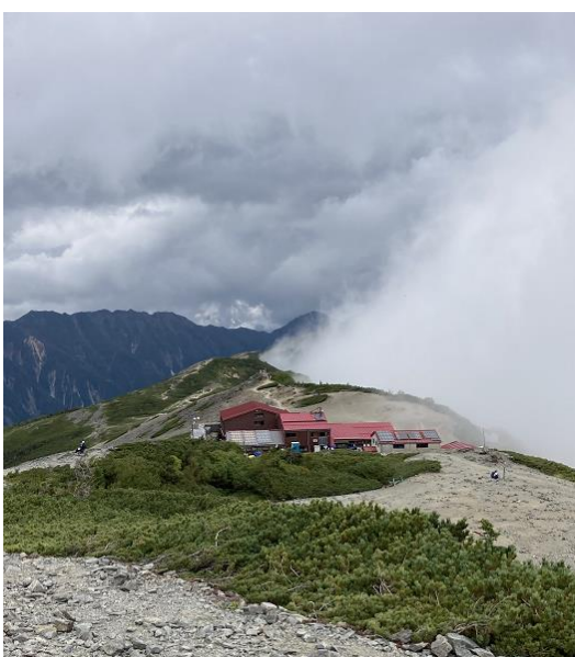
1. 尾根を境にしてガスの分布がくっきり

9/19(火) 7:30 徳沢ロッジ発→9:30 上高地BT→あかんだなP(車:帰阪 東海北陸自動車道経由)