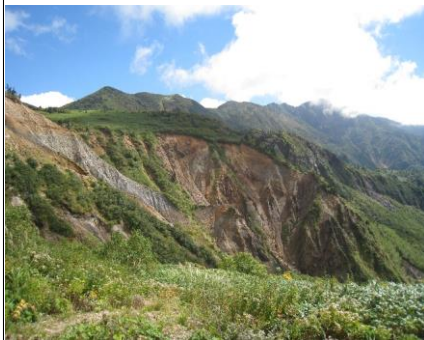
どんどん崩れている