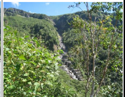
砂防施設(地道な努力)