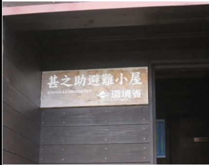
甚之助避難小屋(綺麗)