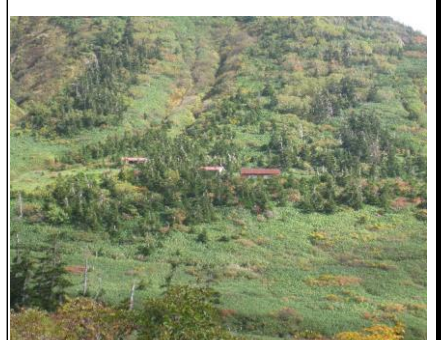
バンガロー(トイレ綺麗)