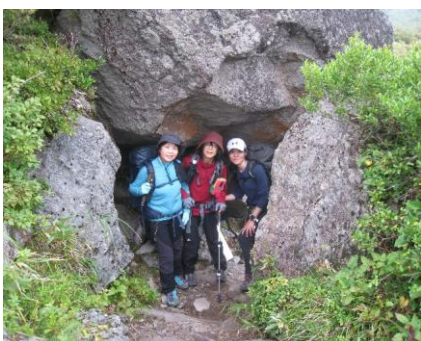
観光新道(激下り)にて