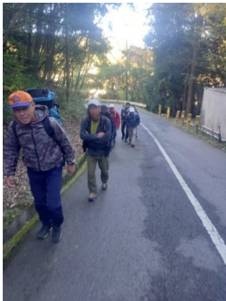
烏帽子岩へと向かう