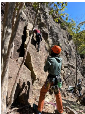
クライマー&ビレイヤー