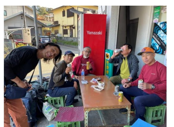
スマイル(^^) お疲れ様でした