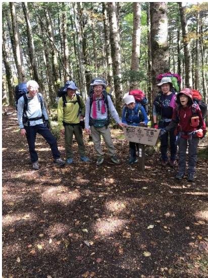
4. 最初のチェックポイント