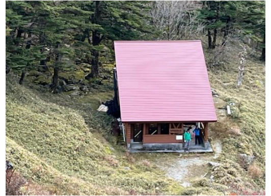
12. お亀岩避難小屋到着