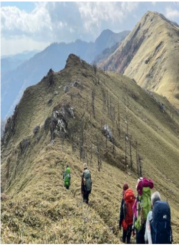
10. 避難小屋を目指して1