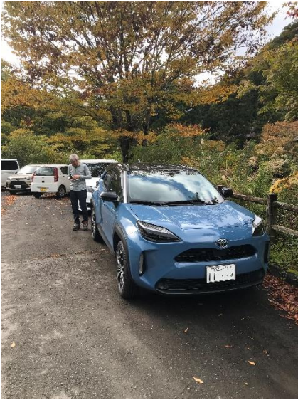
1 登山口駐車場到着