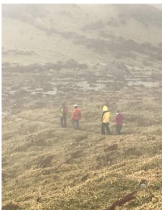
19 空身にて 2