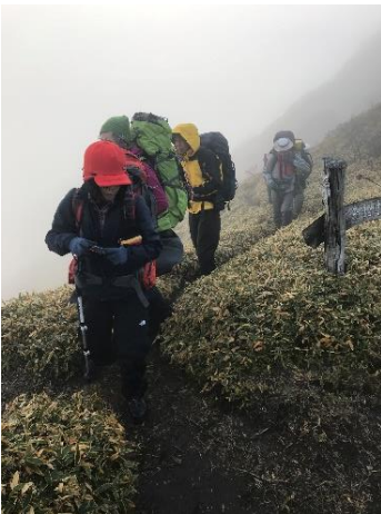
16. 天狗塚を目指して