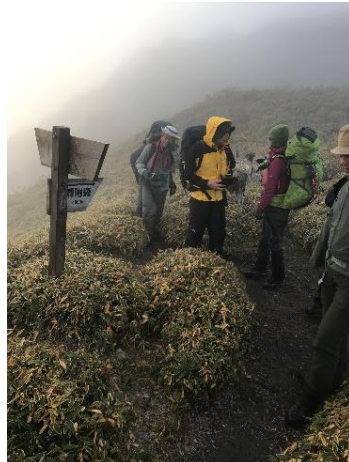
17. 荷物デポ地点到着