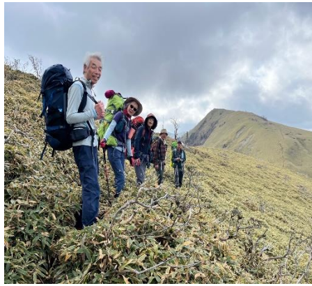
11. 避難小屋を目指して2