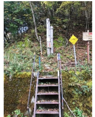
21 西山林道登山口に到着