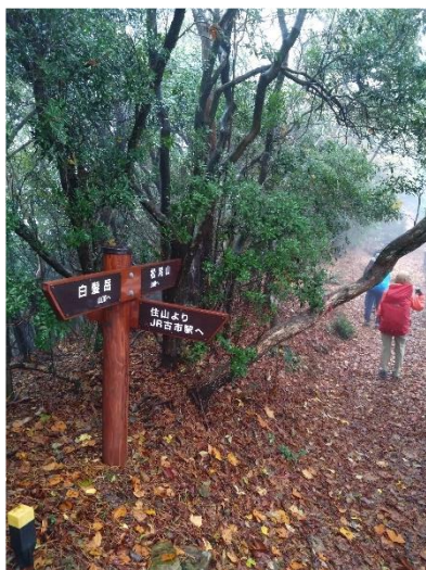
水山を下り松尾山に向かう