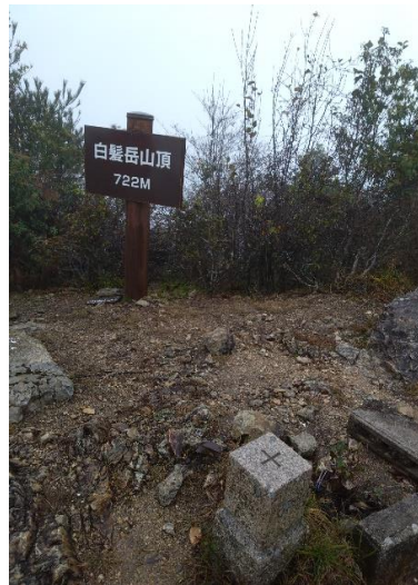
白髪岳山頂の二等三角点