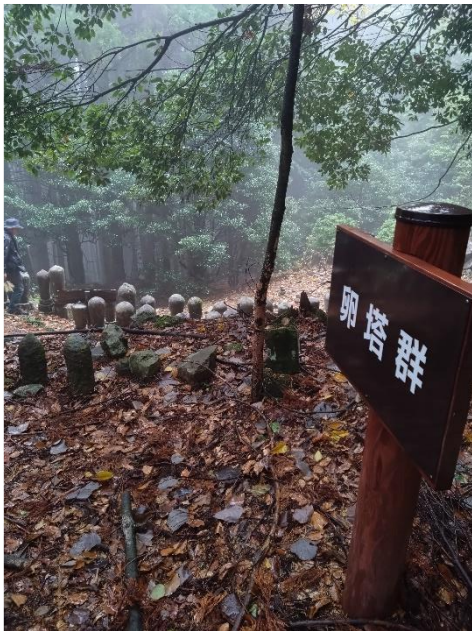
卵の形をしたお墓