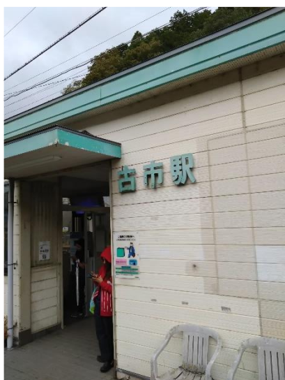
Start GoalのJR 古市駅

A班は卵塔群から尾根筋コースで松尾山登山口に下山。B班は同所より不動滝経由で下山。古市駅で解散。