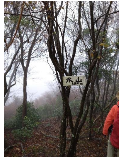
今回は水山山頂通過