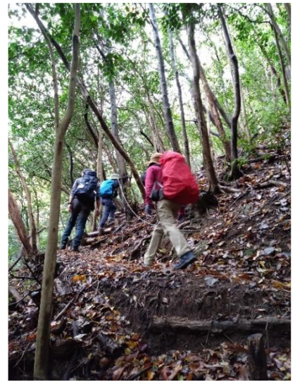
急登の連続(フィックスロープも)