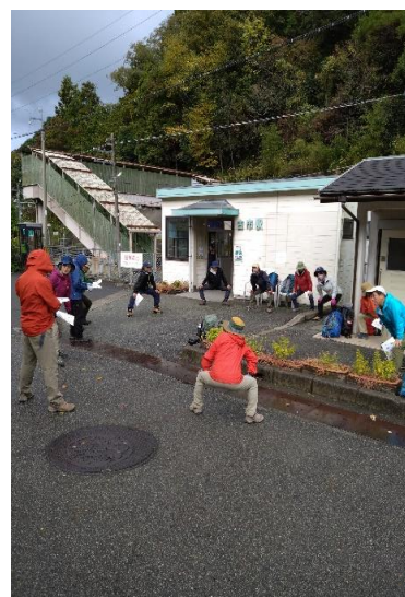
出発前T氏よりワンポイントレッスン実践中。この後出発