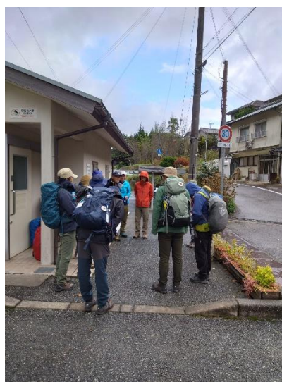
Leaderより挨拶と本日の行程説明及び班分けの案内