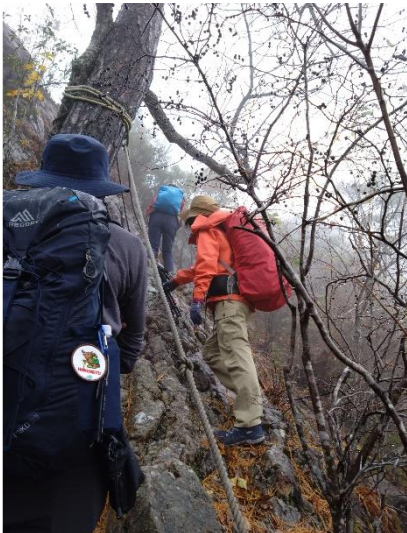
頂上直下の岩場のトラバース