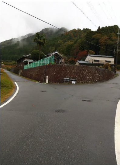
分岐を左(白髪岳登山口へ)