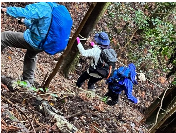
再び急坂(ロープを頼り下山)