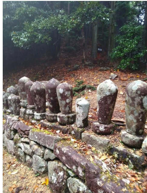
卵塔はお坊さんの墓