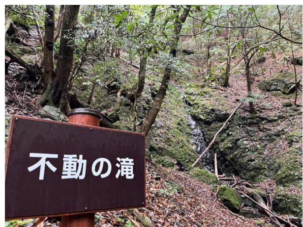
不動の滝(ここから沢沿いを下山)