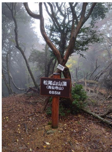
松尾山山頂 (南北朝時代の酒井城跡)