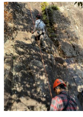
クライマー&ビレイヤー