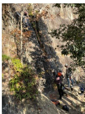
クライマー&ビレイヤー