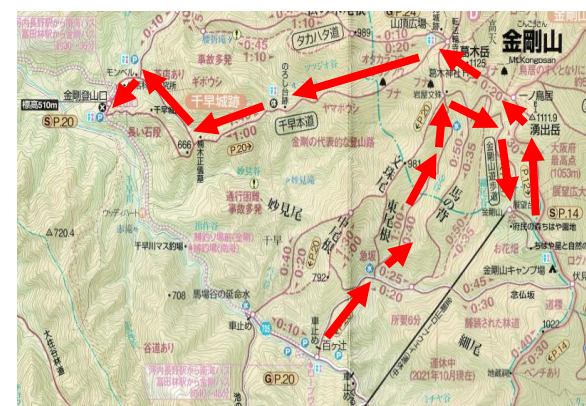
■ こんなルートでした