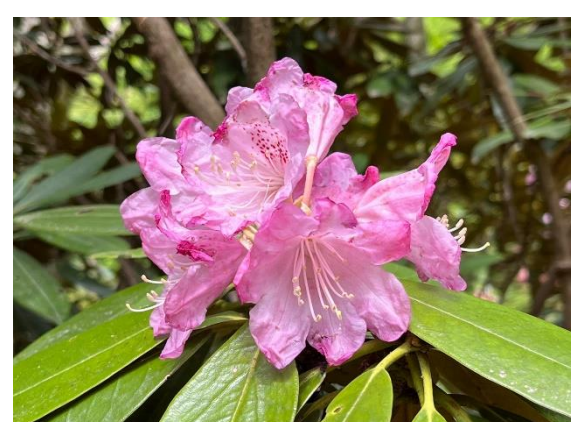
23. シャクナゲも残っていました