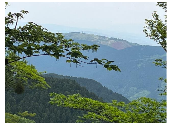
26. 葛城山も紅色に染まって見えた