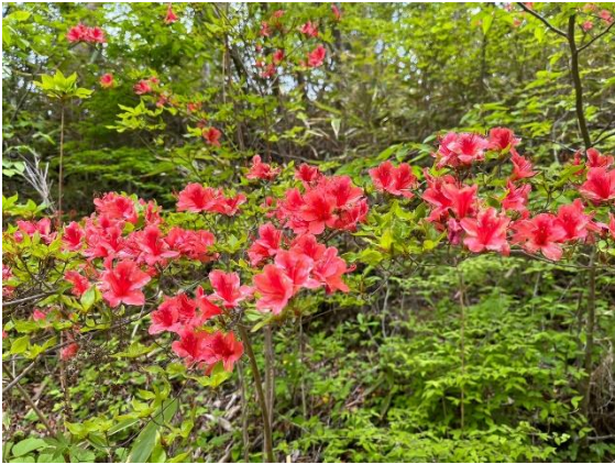
21. 山ツツジも見頃でした