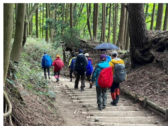
29. 千早本道の階段をひたすら下山