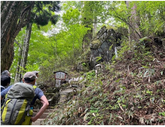
18. 寺谷を抜けて岩屋文殊へ