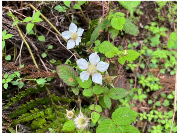
8~10. 種類が多過ぎてついていけず