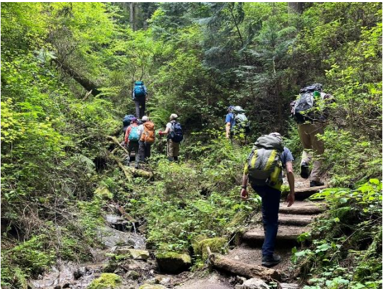
11. 寺谷の沢沿いを登る