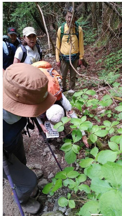
6. 花ガイドと見比べ