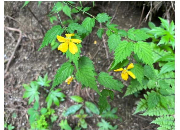
13. よく似た黄色い花