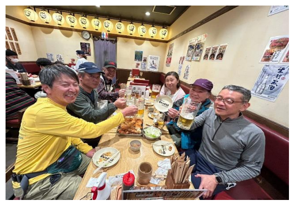
30. 有志で打上げ 🍻