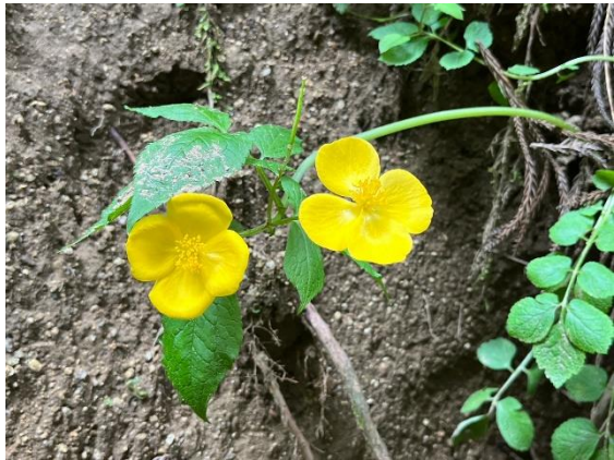
12. ヤマブキシソウだったか？