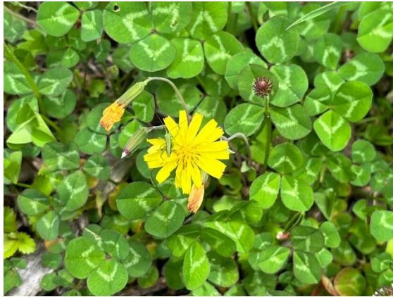
22. 花卉（或いはガク？）の多い黄色い花