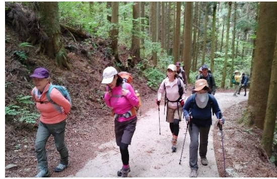
2. 最初は緩やかな林道