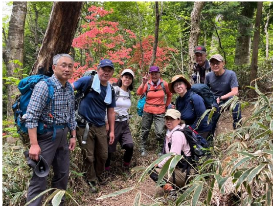
19. ちはや園地への遊歩道で