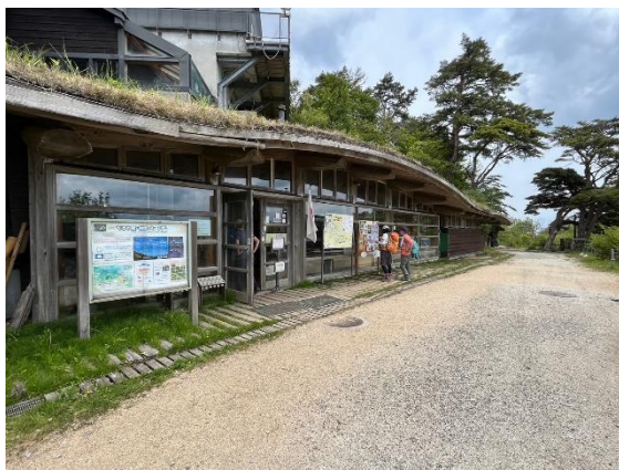
24. ちはや園地のミュージアムを覗く