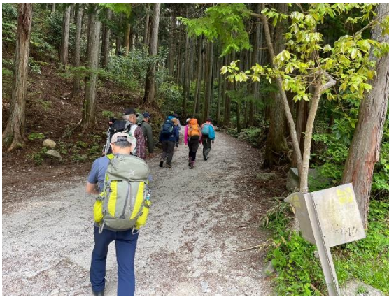
1. 伏見林道から登る

新緑の季節に近場で四季の花の山としても有名な金剛山を巡った。登りは金剛山ロープウェイ前の伏見林道から入って沢筋を辿る寺谷ルート, 下りは単調な階段続きのしかし金剛登山のメインルートである千早本道。道中, 寺谷の谷合でまた稜線伝いの遊歩道でそれなりに季節の花を楽しむことができた。予報では必ずしも好ましい天気ではなかったが, 下山初めのぱらつき始めた雨を掠めた程度で, 全行程を新緑のなか快適にハイキングできた。