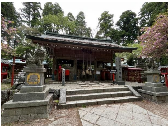
27. 金剛山の最高点は奈良県側です