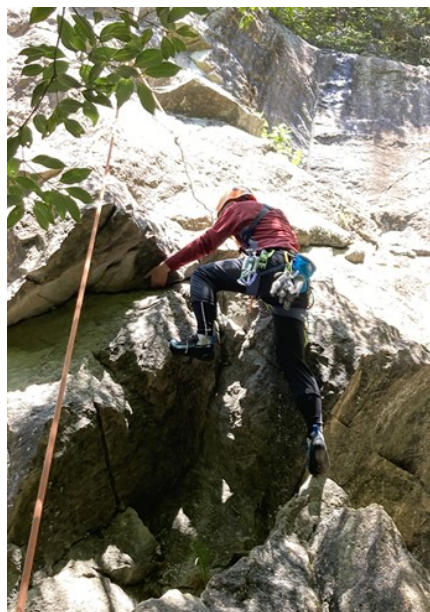
2. アンダーホールドで引き付ける