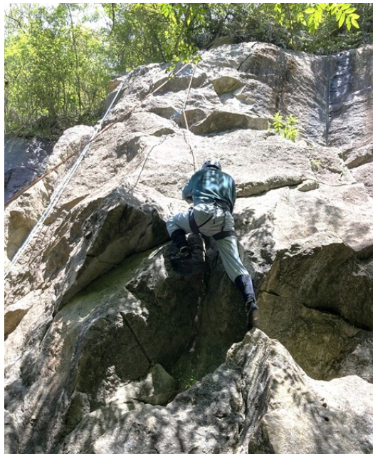
5. 果敢にとりついていく