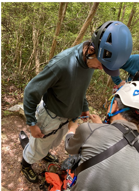
4. ビギナーも手ほどきを受け →→