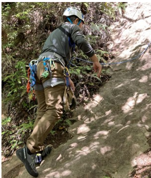
1. とりつく前にイメージをつくるが近づくとルートが見えなくなる