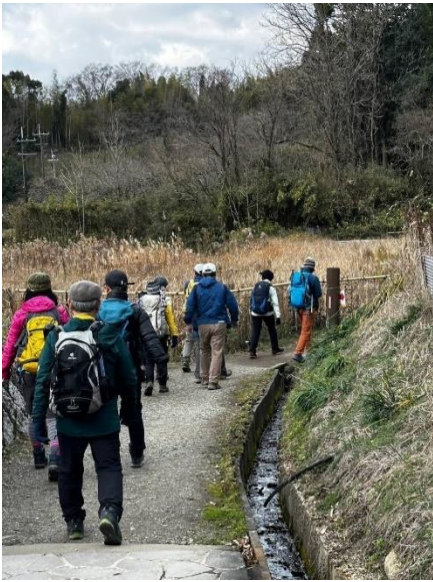
7. 山の辺の道スタート