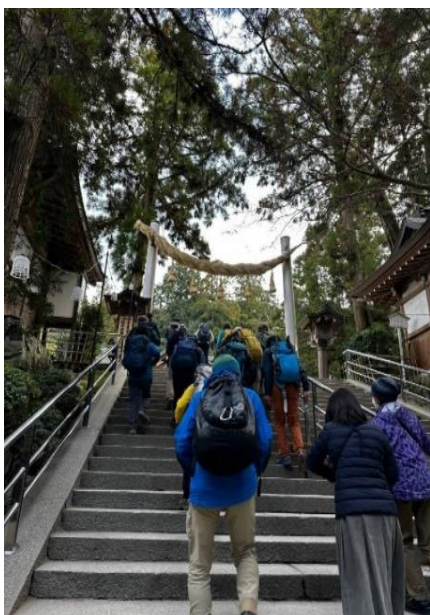
1 大神神社参拝 鳥居をぐぐります