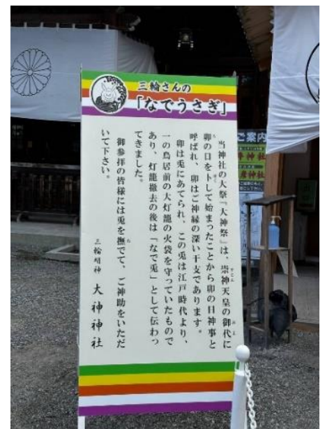
3. 大神神社内にあるなでうさぎを撫で、ご利益を!