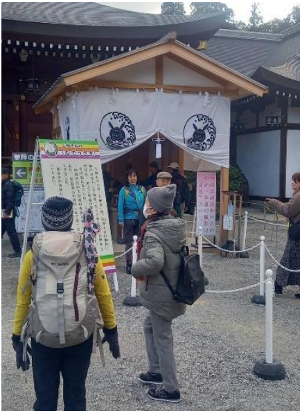
4. 皆さん撫でました。