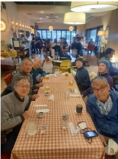
10. 洋食勝井に到着、ホットする