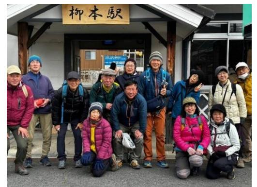
12. お疲れさまでした。