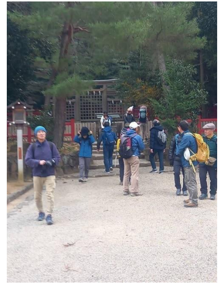
9. 途中にある檜原神社で参拝