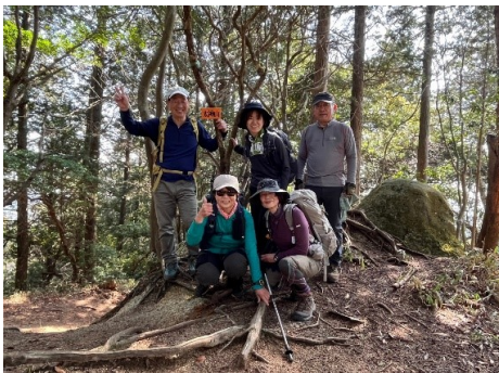
二人リタイヤになり太神山は6人 (1人はカメラマン)