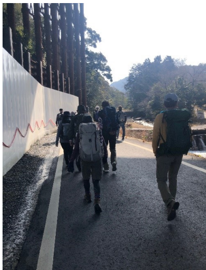
アルプス登山口より元気にスタート