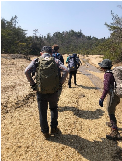
鎧ダムの上流の広い河原