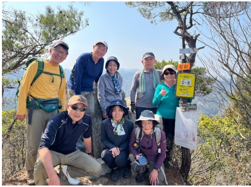
全員元気に堂山頂上