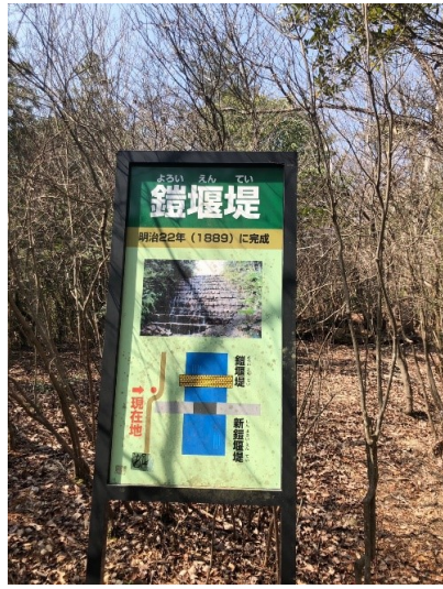
明治時代に作られた砂防ダム