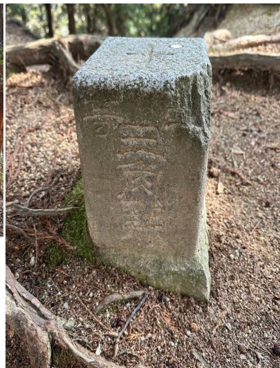
太神山 三等?三角点