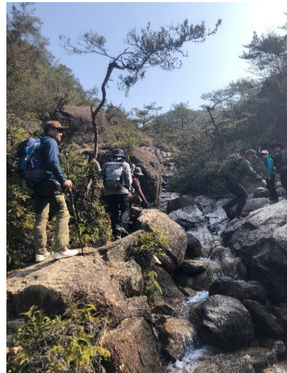
奇岩にそって遡行