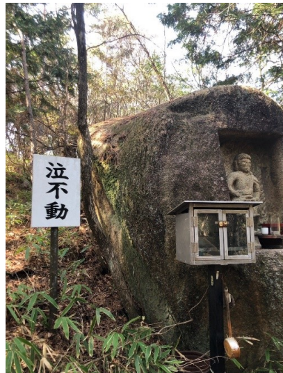
太神山に向かう途中