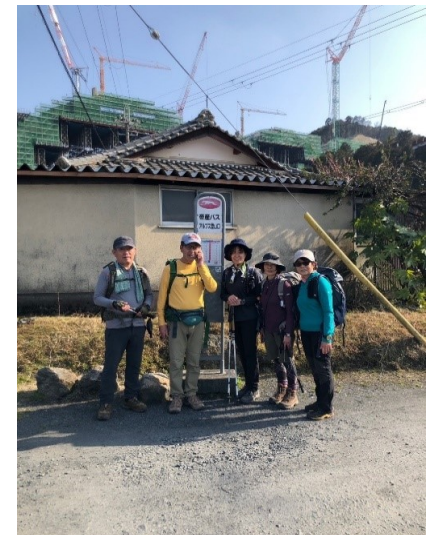
アルプス登山口無事下山 6人 2人は前のバスで石山駅