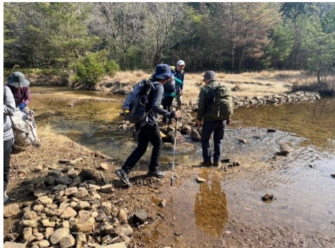
天神川渡渉 1人リドボン